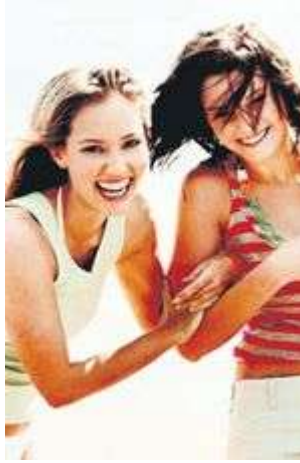
Resim 1.2: Mutlu iki arkadaş

Arkadaş grupları, iletişim kurma, sorumluluk alma, liderlik, bir işi sonuna kadar sürdürebilme gibi özelliklerin gelişmesi için uygun ortam yaratır. Grup içinde birey kendini değerlendirir. Kendisinin nasıl bir yerde ve nerede olduğunu ölçer. Model aldığı arkadaşlarına benzemeye çalışırken kendisi de başkalarına model olabilir.