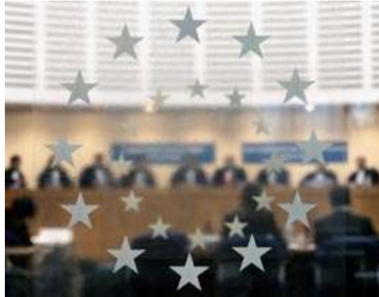
Resim 2.1: Avrupa insan hakları mahkemesi

Madde 30- Bu Bildirge’nin hiçbir kuralı, herhangi bir devlet, topluluk veya kişiye, burada açıklanan hak ve özgürlüklerden herhangi birinin yok edilmesini amaçlayan bir girişimde veya eylemde bulunma hakkını verir biçimde yorumlanamaz.