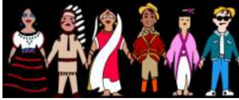
Şekil 1.4: Toplumdaki değişik kültürler

Toplumun da bireyler gibi kendine özgü özellikleri vardır. Toplum, bireylerin ortak kültürünü, değerlerini, hayat tarzlarını ve ilişkilerinin bütünlüğünü temsil eder. Topluma hizmet veren işletmeler ve kişiler toplumun bu temel özelliklerini bilmek zorundadır.