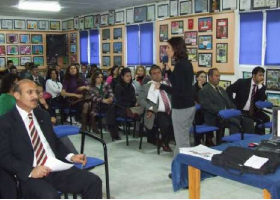
Resim 1.1: Birey ve toplum