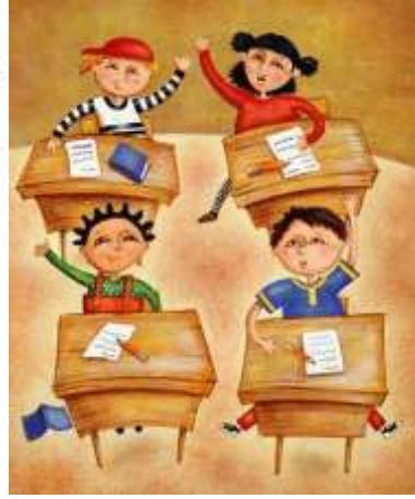
Şekil 1.2: Kazanılmış statüler