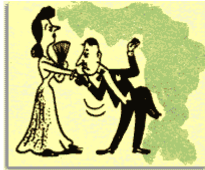
Şekil 2.2: Karşılama, selamlaşma

İnsanların birbirine selam vermeleri, insan ilişkileri açısından son derece önemlidir. Selam veriş tarzınızla kişiliğinizin yapısı hakkında karşı tarafa fikir verebilirsiniz. Örneğin güçlü, tok bir sesle, kararlı bir şekilde verilen selam kuvvetli bir kişiliğin göstergesi olarak anlaşılır.