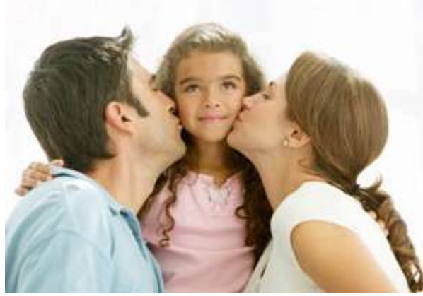
Resim 1.3: Ailede iletişim

İnsanoğlu ilk sosyal deneyimlerini aile içinde yaşar. Bireyin yaşamının ilk yıllarında sevilme, okşanma, kucağa alınma, beslenme ve korunma gibi gereksinimleri yeterince ve zamanında karşılanır ise temel güven duygusunun oluşumu sağlanmış olur. İletişim; ailenin fonksiyonlarını ortaya çıkarmak, aile bireylerinin kişisel ihtiyaçlarını karşılamak ve onların hedeflerine ulaşmalarını sağlamak için gereklidir.