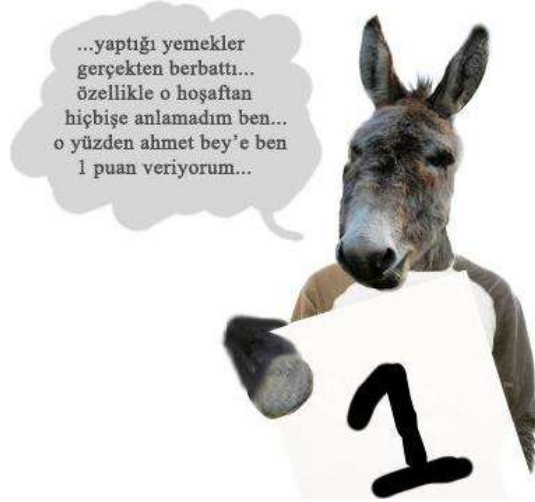
Şekil 2.1: Yemekte görgü kuralı

Görgü kurallarını çiğneyen kişi “kaba, tuhaf, bilgisiz ve görgüsüz” diye nitelendirilir. Bu nitelendirmelerin hoş olmaması nedeniyle insanlar görgü kurallarına uyma zorunluluğu hisseder. Görgü kurallarına uyma insanlar arasında iyi niyet, yakınlaşma, anlayış, hoşgörü ve dayanışma duygusu yaratır. Bu duygular ise insanları, toplumsal bütünlük ve dayanışmaya götürür.