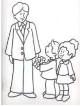
Şekil 1.3: Öğretmen öğrenci ilişkisi