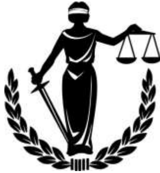
Şekil 2.3: Hukuk sembolü

Toplumunu düzenleyen kurallardan en önemlisi ve en etkilisi hukuk kurallarıdır. Hukuk kurallarının diğerlerinden ayrılan temel özelliği; insanların hukukun kendilerine yüklediği yükümlülükleri kendi istekleriyle yerine getirmemeleri hâlinde devletin yetkili organlarının, bu yükümlülüklerin zorla yerine getirilmesini sağlamasıdır. Ülkenin yasal, sosyal ve ekonomik yapısı hukuk kurallarıyla düzenlenir. Ayrıca birçok ahlak, örf, âdet ve din kuralının hukuk kuralı hâlinde varlığını sürdürdüğünü de eklemek gerekir.