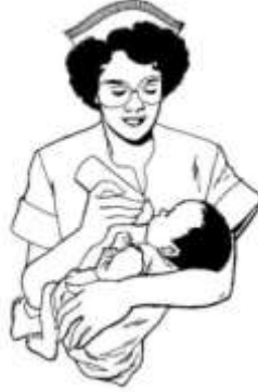
Şekil 1.5: Sağlık kurumlarından hizmet alma

Sağlık kurum ya da kuruluşları, demokratik süreç içinde vatandaşların sağlık ve sağlık hizmetlerinden beklentilerini hesaba katarak ihtiyaçlarını göz önünde tutmalıdır. Sağlık sistemlerinin finansmanı, sağlık hizmetlerinin tüm vatandaşlara erişecek bir şekilde sunulmasına ve sağlık kaynaklarının etkili kullanımına imkân vermelidir. Bu hizmetleri yürütülmesi için toplum katılımı da önemlidir.