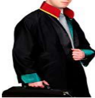
Resim 1.1: Avukat

Serbest meslek faaliyeti, sermayeden çok şahsi mesaiye, ilmi veya mesleki bilgiye veya ihtisasa dayanan ve ticari niteliği olmayan işlerin işverene bağlı olmaksızın şahsi sorumluluk altında kendi nam ve hesabına yapılmasıdır.