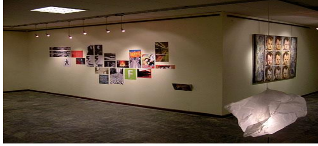
Resim 2.8: Sergi

Dar mükellefiyete tabi (Türkiye’de yerleşmiş olmayan) olanların hükümetin izniyle açılan sergi ve panayırarda yaptıkları serbest meslek faaliyetlerinden elde ettikleri kazançlar gelir vergisinden istisna edilmiştir.