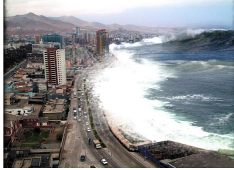
Resim 2.6: Tsunami Felaketi