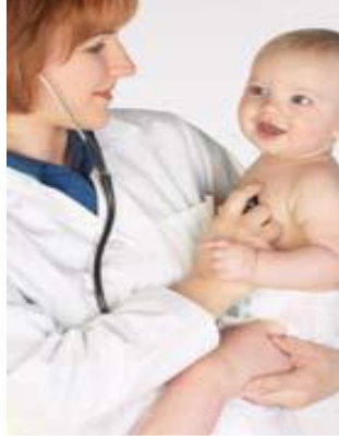
Resim 1.2: Doktor

Örnek: Muayenehanesinde hasta kabul eden bir doktorun, ilmî veya mesleki bilgiye ve ihtisasa dayanan bu faaliyeti, serbest meslek faaliyetidir. Ancak, bu doktor ayrıca bir özel hastane işletmekte ise, Türk Ticaret Kanunu ve Gelir Vergisi Kanunu'nda özel hastane işletmek ticari faaliyet sayıldığından, bu faaliyet sonucunda elde edilen kazanç “ticari kazanç” olacaktır. Bu kişi yıllık gelir vergisi beyannamesini verirken doktorluk faaliyetinden elde ettiği kazancı serbest meslek kazancı, özel hastanecilik faaliyetinden elde ettiği kazancı ise ticari kazanç olarak beyan edecektir.