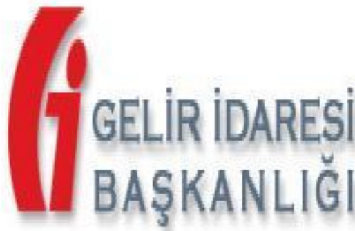
Resim 2.3: Gelir İdaresi Başkanlığı

Serbest meslek kazancı elde eden mükellefler cari vergilendirme döneminin gelir vergisine mahsup edilmek üzere, üçer aylık dönemler halinde tespit edilecek kazançları üzerinden %15 geçici vergi öderler.