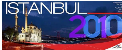
Resim 2.7: İstanbul 2010 Kültür başkenti logosu

5706 sayılı İstanbul 2010 Avrupa Kültür Başkenti Hakkında Kanun uyarınca kurulan Ajansa yapılan her türlü ayni ve nakdi bağış ve yardımlar ile sponsorluk harcamalarının tamamı gelir vergisi beyannamesinde bildirilecek gelirlerden indirilebilecektir.