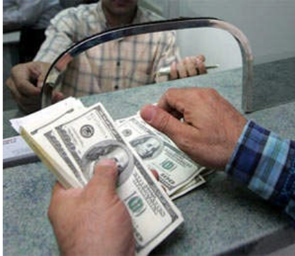
Resim 2.2: Döviz Tevdiat Hesabına faiz tahakkuk ettirilmesi durumunda; “611 MEVDUATA VERİLEN FAİZLER HESABI”nda izlenir.

Bu hesabın vadesi dolduğunda, 01.01.2005 – 10.06.2006 devresi için hesaplanan faiz tutarı ve evvelce giderlere intikal ettirilen ve 361 nolu hesapta bekleyen faiz tutarı mudinin hesabına intikal ettirilir. Bu şekilde kayda alınarak işlem tamamlanır. Menkul Kıymetler Sermaye İradı Gelir Vergisi (M.S.İ.G.V ) % 15 kesinti bu aşamada yapılır.