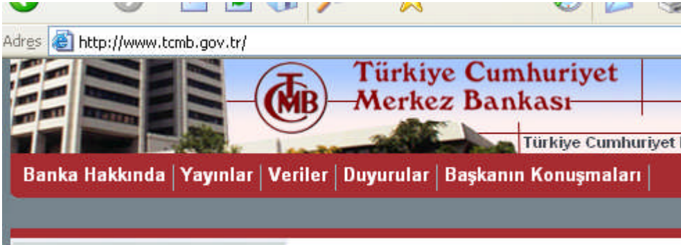
Resim 1.2: Merkez Bankası İnternet Adresi www.tcmb.gov.tr 'dir

Günümüzde uluslararası döviz piyasasının başlıca merkezleri, New York, Paris, Tokyo, Frankfurt ve Londra'dır.