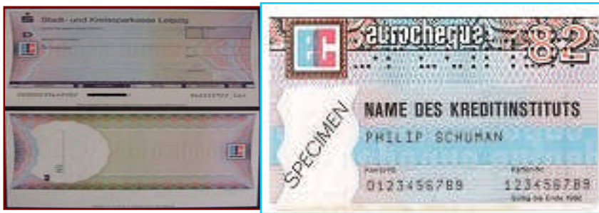
Resim 3.1: Euro Çekler: Avrupa ve Akdeniz ülkelerini kapsayan, çek ve garanti kartının birlikte kullanılmasını gerektiren bir ödeme sistemi olan çek örnekleri

Avrupa ve Akdeniz ülkelerini kapsayan, çek ve garanti kartının birlikte kullanılmasını gerektiren bir ödeme sistemidir.