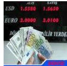
Resim 1.1: Nakit halindeki yabancı ülke paralarına efektif, yabancı ülke parası ile ödeme yapılmasına yarayan her türlü hesap, belge ve araçlar ise döviz olarak isimlendirilir