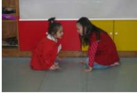
Resim1. 4: Drama ve hayal gücünü

Rol oynama etkinliklerine başlarken çocukların basmakalıp, yüzeysel karakterleri oynamalarından çok, farklı meslek gruplarından ve bu meslek grupları içinde de görevleri farklı olan insanlardan oluşmuş kişilerin toplum içindeki rollerini kavramaları çok önemlidir. Bu nedenle kişilerin mesleğiyle ilgili davranışlarından çok, kişilik özellikleri üzerinde durulmalıdır. Ele alınan konular, çocukların yaşantılarından seçilmelidir. Gerçekçi bir olay seçildikten sonra çocuklara tanımlanan rolleri almada gönüllü olup olmadıkları sorulmalıdır. Eğitmen, gönüllülerin yanında utangaç veya içedönük olanları da cesaretlendirip etkinliklere katılmalarını sağlamalıdır. Rol farklı şekillerde tanımlandıktan sonra, “Hangi rolü seçtin?”, “Neden?”, “En az istenilen rol hangisiydi?”, “Neden?”, “Roller kendini nasıl hissettirdi?”, “Gerçek durumlarda bireyler kendilerini nasıl hissederler?”, “Durumu düzeltmek için ne yapabilir?” gibi sorularla roller tartışılabilir.