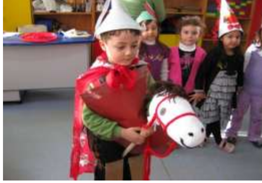
Resim 1.2.: Drama ile eğitim