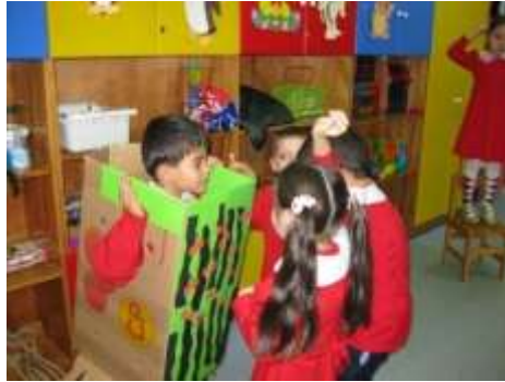
Resim1. 5: Drama ve doğaçlamalar

Doğaçlama çalışmalarında, sınıfta ya da grupta bulunanların problemlerini konu alan ve bu sorunları çözebilecek nitelikte roller ve oyunlar yaratılabilir. Sadece durumlar ve öyküler değil, nesnelere ve çeşitli malzemelerin kullanılmasıyla elde edilen yaratıcı sonuçlar da doğaçlamaların ortaya çıkmasına ya da teşvik edilmesine yardımcı olur. Etkinlik sırasında kullanılan ses efektleri, materyaller, kostümler fikirlerin oluşmasında ve hayal gücünün uyarılmasında etkilidir.