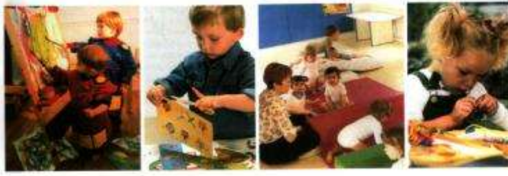
Resim 2.1: Yaratıcı drama ve ilgi köşeleri

Örnek Çalışma: Sınıf ortamında erken çocukluk eğitim kurumlarında bulunan ilgi köşeleri gibi yaratıcı drama ortamı oluşturacak şekilde bir köşe düzenleyiniz.