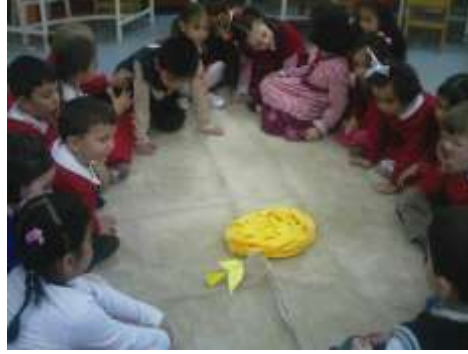
Resim1. 8 : Drama ve oyun