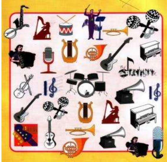
Resim 2.2: Müzik araçları ile bir oyun oluşturma

Katılımcının karakter portresine ve etkinliğin özelliğine göre müzik seçilmeli ve teknik donanımla desteklenmelidir. Örneğin; duygusal durumlarda klasik veya romantik, heyecan varsa hızlı ritimli, coşku varsa ritmik, koro sesleri içeren müzikler seçilebilir.