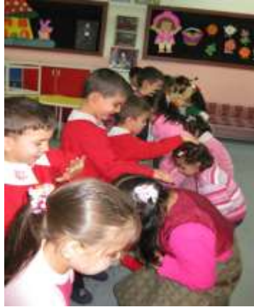
Resim1. 3: Oyun ve ısınma çalışmaları

Oyun, çocuklarla iletişim kurmanın ve onların dünyasını paylaşmanın yollarından biridir. Çocuklar birlikte oynarken etkileşime girmektedirler. Bu da karşılaştıkları sorunlara kendi kendilerine çözüm yolları bulabilmelerini kolaylaştırmaktadır. Oyun sırasında çocukların davranışlarında değişimler ve gelişmeler görülmekte en önemlisi de yaratıcılıkları gelişmektedir. Oyun, drama çalışmalarında daha çok ısınma aşamasında kullanılan ve kendi içinde sonsuz özellikleri olan bir tekniktir.