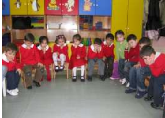
Resim 1.6: Duygulara yönelik pandomim çalışması

Okul öncesi çocuklar için karda yürüme ya da kumda yürüme gibi bilindik faaliyetleri pandomimle yapmak kolaydır. Daha ileri düzey pandomimlere, çocuğun bir ruh hâlini anlatması örnek olarak verilebilir. Daha sonra çocuklar, komik ayakkabı satıcısı, sakar pizzacı ya da balık tutamayan balıkçı gibi karakterleri ortaya koyabilirler. Pandomim; koşma, yürüme, zıplama gibi temel hareket çalışmaları (hazırlık), hayal gücünün kullanılması (bir nesne vermek), duyguların kullanılması, eylemler, duyguların kullanılması ve karakterlerin kullanılması şeklinde aşamalı olarak uygulanabilir.