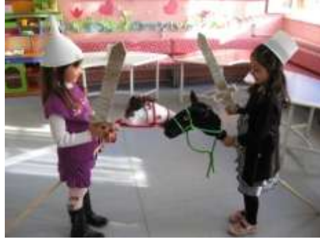
Resim 1.1 : Dramada hayal gücünü ve doğaçlama