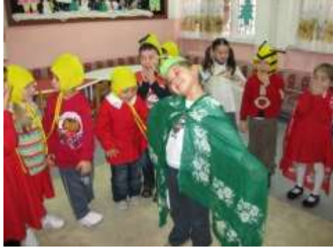
Resim1. 7: Drama ve dramatizasyon

Örnek çalışma: Liderlik yaparak, bilinen bir hikâyenin sınıf ortamında canlandırılmasını sağlayınız.