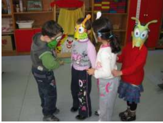
Resim2.3.Drama ve maskeler

Örnek obje: Bir kutu (Örnek oluşumlar: Kameraman, kamera olarak kullanır film çeker; simitçi tabure olarak kullanır; anne, bebek yatağı olarak kullanır, bebeğini uyutur; yağmura yakalanan yaşlı teyze, şemsiye olarak kullanır vb.)