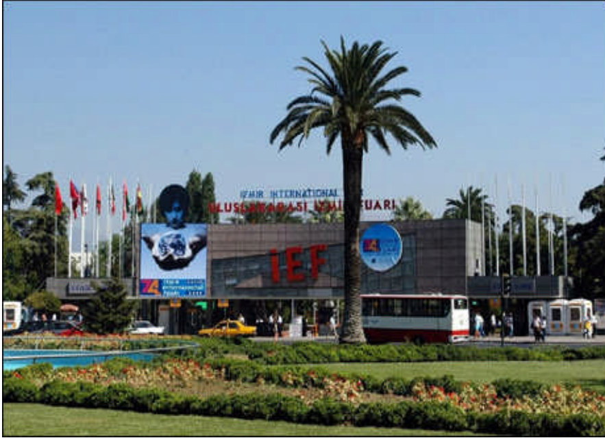
1.1. İzmir uluslararası fuar alanı

Uluslararası ticari fuar ve sergilere, gerek ülkemizi temsilen milli düzeyde, gerekse bireysel olarak katılacak firma ve kuruluşlarca yurt dışına gönderilecek bedelli veya bedelsiz mal ve eşya ile yurt dışında düzenlenecek bilim, sanat, kültür veya tanıtım amaçlı fuar/sergi, konferans, seminer vb. etkinliklere kişi ve kuruluşlarca gönderilecek bedelli veya bedelsiz mal ve eşyanın yurt dışına çıkışıyla ilgili müracaatlar doğrudan ilgili gümrük idarelerine yapılır.