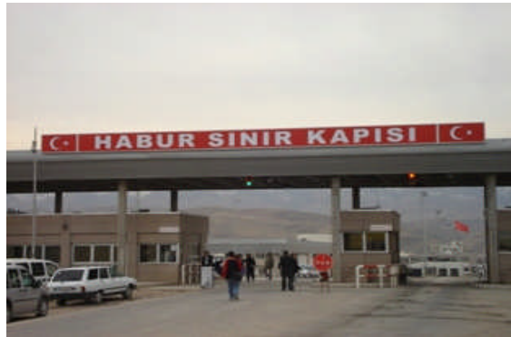
1.2. Sınır kapısı

Sınır ticareti yapılması için şekil ve esasları ilgili Valiliklerce belirlenecek sınır ticareti belgesi alınması mecburidir.