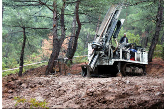
2.2. Çevreyi korumak hepimizin görevidir.

Bu yardımda amaç KOBİ ile SDŞ elemanlarının münhasıran dış ticarete ilişkin eğitim ihtiyaçlarının karşılanarak uluslar arası pazarlama ve ihracat işlemleri ile ihracatta Pazar bulma konusundaki niteliklerinin artırılması ve dünya pazarlarına hızla açılmalarının sağlanmasıdır.