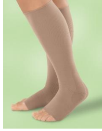
Resim 1.35: Varis çorapları