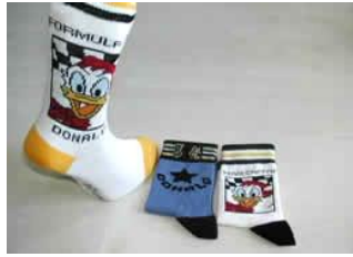
Resim 1.24: Değişik desenli çorap