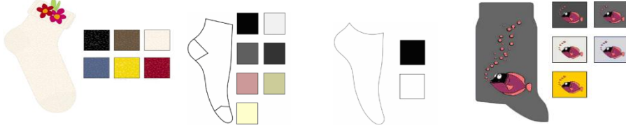
Resim 2.1: Çorap modelleri