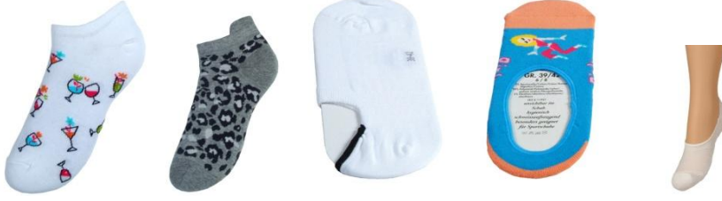
Resim 1.18: Patik çorap