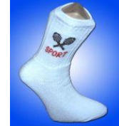
Resim 1.29: Golf çorabı