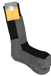
Resim 1.34: Gümüş çorap