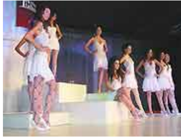
Resim 1.10: Çorap defileleri