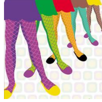
Resim 1.11: Çorap çizimleri

Çorabın işlevi (spor, iş, klasik vb.) belirlendikten sonra diğer özellikleri de tespit edilir. Böylece çorap modelinin çizilimine geçilmiş olur. Bir çorap tasarımında bulunması gereken öğeler çizgi, biçim, doku ve renktir.