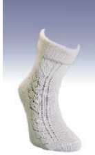
Resim 1.16: Baldır altı çorap