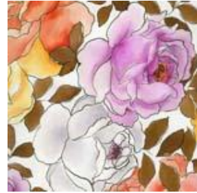
Resim 1.6: Gül figürü

Gül: Osmanlıda gül motifi kullanılmış olsa da çok tercih edilmemiştir. Kullanılanlar da tamamen sembol niteliğindedir.