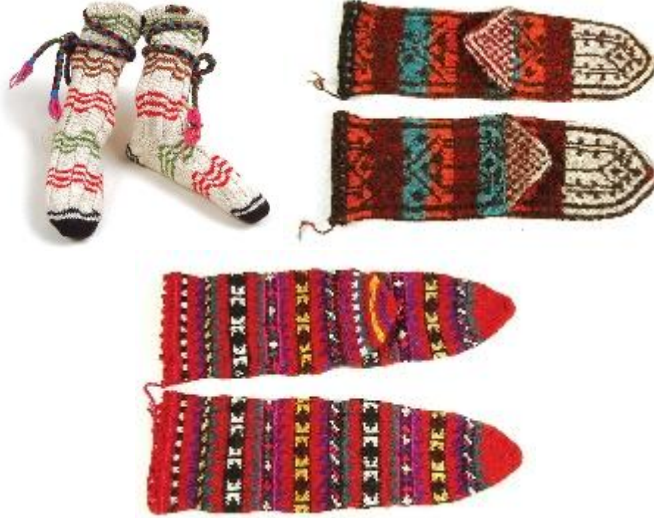
Resim 1.3: El örmesi çoraplar

Antik çağlardan günümüze günlük hayatın vazgeçilmez öğeleri olan çoraplar ve eldivenler, Anadolu geleneğinin içinde üzerine işlenen motifleriyle sahibinin sesi de olur.