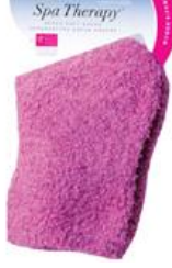
Resim 1.33: Spa therapy çorabı