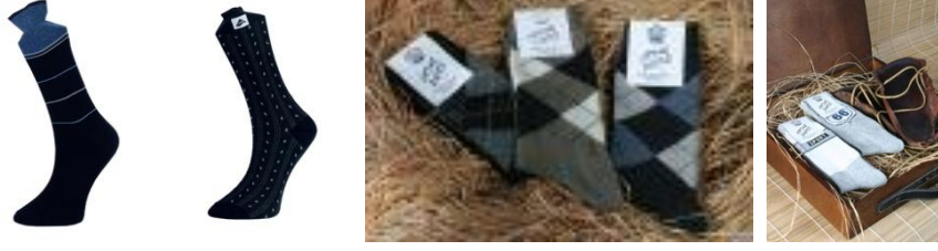
Resim 1.22: Takım elbise çorapları