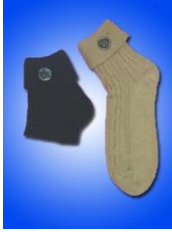
Resim 1.23: Tabiat bot çorapları