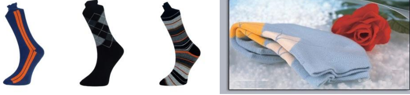
Resim 1.20: Günlük çorap