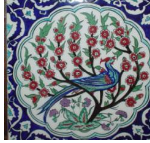
Resim 1.8: Çini figürleri

İznik çinilerinin motifleri: İznik çinileri, gizem ve hayranlık uyandıran renklere sahiptir. Özellikle mercan kırmızısının elde edilmesi ve uygulanaşı son derece zordur. Bu konuda yerli ve yabancı uzmanlar yıllardır araştırma yapmaktadır. Çinilerdeki geometrik örgülü düzenlemeler ise semavi kurallarla kişi arasındaki ilişkiye işaret eder.