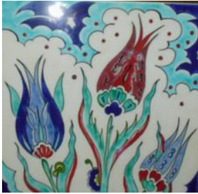
Resim 1.5: Lale figürü

Lale: Laleler; Osmanlı sanatında kulluğu, masumiyeti, yalnızlığı ve elif harfini temsil eder. Ucu kıvrımlı laleler daha çok kullanılır. Fakat ucu kıvrımlı bu lalelerin nesli tükenmiş ve sadece desen ve resimlerde hatıra olarak kalmıştır. Dünyada laleyi bu kadar sanat içinde kullanmış ikinci bir millet yoktur.