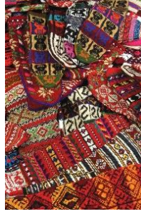
Resim 1.1: El örmesi çoraplar

El örgüsü çorap, bugünkü biçimine 17. yüzyılda örgü makinesini icat eden William Leey sayesinde kavuştu. Ardından ipek çorapların üretimi geldi. 1930'larda naylonun bulunmasıyla sanayi, ipek çorap üretme bağımlılığından kurtuldu ve dayanıklılığı nedeniyle naylon çoraplar yavaş yavaş piyasaya sürülmeye başlandı. Amerika'da üretilen ilk naylon çorabın "Naylon Günü" ilan edilen 15 Mayıs 1940'ta satışa sunulacağı duyurulmuştu. Dükkânlar açılmadan önce önlerinde oluşan kuyruklarla çoraplar daha o gün tükendi.