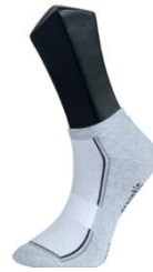
Resim 1.17: Bilekte çorap