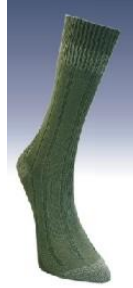
Resim 1.15: Baldır ortası çorap