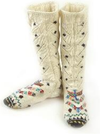
Resim 1.4: El örmesi çorap