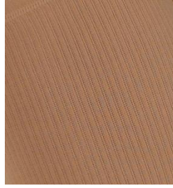
Resim 1.36: Antibakteriyel çorap