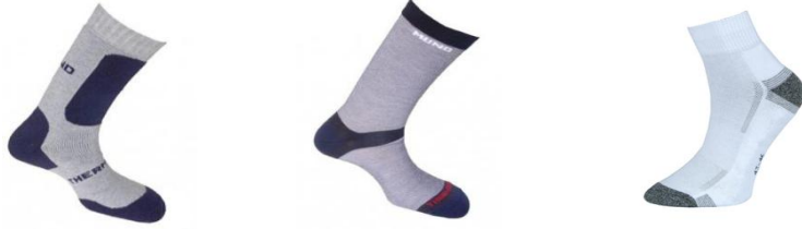
Resim 1.25: Dayanıklılık spor çorabı Resim 1.26: Koşu çorabı Resim 1.27: Bisiklet çorabı