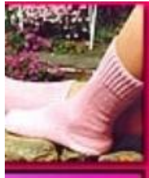
Resim 1.33: Angora çorap