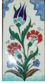
Resim 1.7: Karanfil figürü