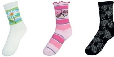
Resim 1.21: Günlük çorap