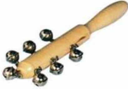
Fotoğraf 1.12:Saplı el zili

Tef: Şarkı söyleme ve ritim çalışmalarında en sık kullanılan ritim çalgıları arasındadır.