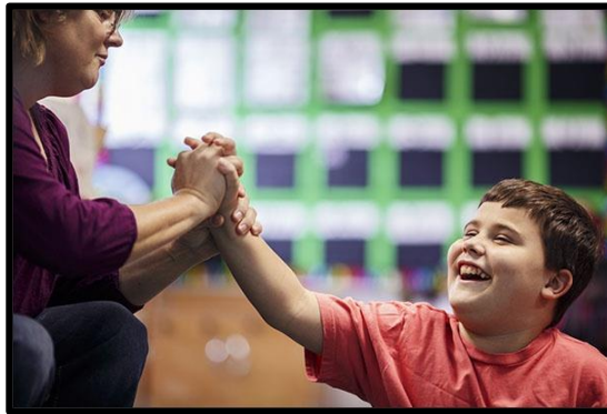
Resim 2.5: Destek özel eğitim hizmeti

Destek hizmet uzmanı, normal sınıfa gelerek kaynaştırma eğitimi kapsamındaki öğrenciye, diğer öğrencilere veya sınıf öğretmenine hizmet verir. Örneğin destek hizmet uzmanı sınıfta kaynaştırma öğrencisiyle ilgilenirken sınıf öğretmeni sınıfıyla ilgilenir. Sınıf içi yardım sağlayacak destek hizmet uzmanı; dil ve konuşma terapisti, özel eğitim öğretmeni ya da öğrencinin gereksinimine bağlı olarak başka bir uzman olabilir.