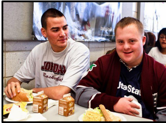
Resim 2.2: Tam zamanlı kaynaştırma

Özel eğitime ihtiyacı olan öğrencinin kaydı normal sınıftadır; öğrenci gün boyunca normal sınıfta eğitim almaktadır. Özel eğitim gerektiren öğrencilerin akranları ile birlikte okul öncesi, ilköğretim, orta öğretim ve yaygın eğitim kurumlarında aynı sınıfta eğitim görmesi ve sosyal açıdan bütünleştirilmesi için; özel eğitim destek hizmetleri (destek eğitim odası), özel araç gereç ve eğitim materyalleri sağlanır. Eğitim programı bireyselleştirilerek uygulanır ve gerekli fiziksel düzenlemeler yapılır.