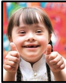
Resim 1.1: Özel eğitim gerektiren birey