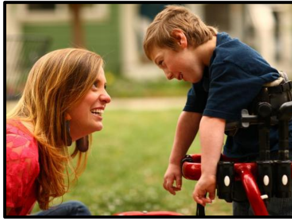
Resim 2.3: Kaynaştırma yoluyla eğitimin yararı