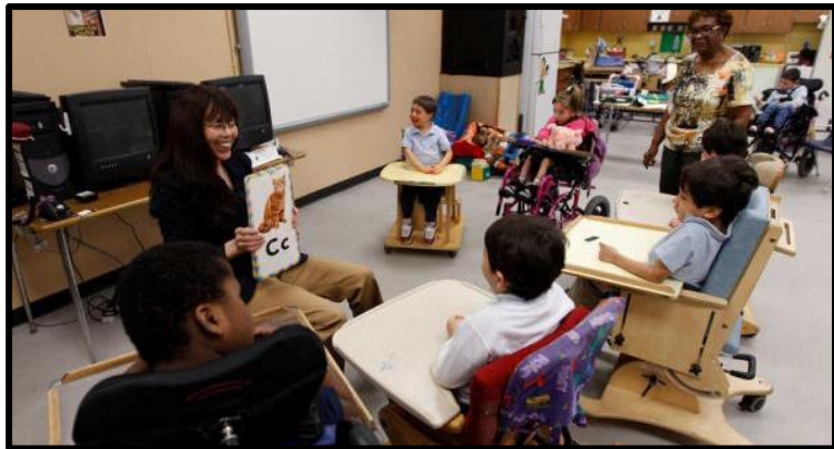
Resim 1.3: Özel eğitim ortamı