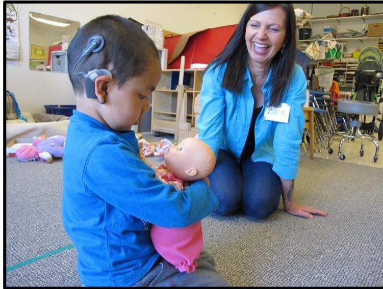
Resim 1.6: Erken özel eğitim