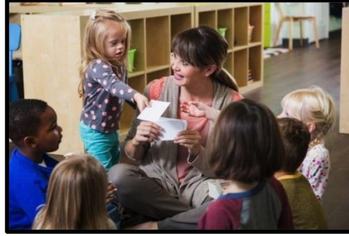
Resim 2.1: Kaynaştırma yoluyla eğitim