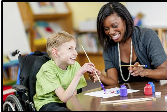
Resim 2.4: Kaynaştırma yoluyla eğitimin yararı