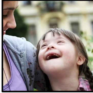
Resim 1.5: Kabul ve uyum

Aşağıda uyum aşamasında bulunan bir annenin ifadesi yer almaktadır: