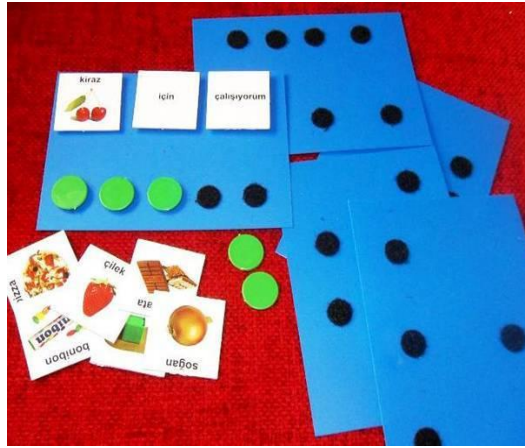
Resim 2.2: Otistik bireylerin eğitiminde kullanılan sembol pekiştirme kartları