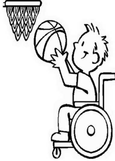
Şekil 1.2: Ortopedik engelli birey