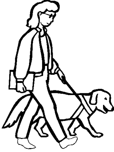
Şekil 1.1: Görme engelli birey