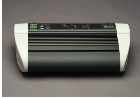
Resim 2.1: Görme engelli bireyler için Braille yazıcı