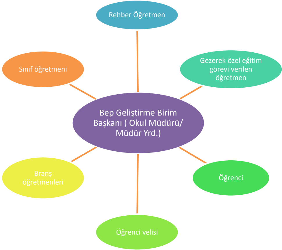
Şekil 2.3: BEP Geliştirme birimi üyeleri

Bireysel Eğitim Programı (BEP): Özel eğitime ihtiyacı olan öğrencinin farklı gelişim alanlarında yapabildiklerini dikkate alarak, kazandırılacak davranışların neler olduğu, bu davranışların nerede, nasıl, kimler tarafından, hangi yöntemlerle ve ne kadar sürede kazandırılacağını belirten, gerekli destek eğitim hizmetlerini içeren, içinde ailesinin de yer aldığı bir ekip tarafından hazırlanan yazılı bir programdır.