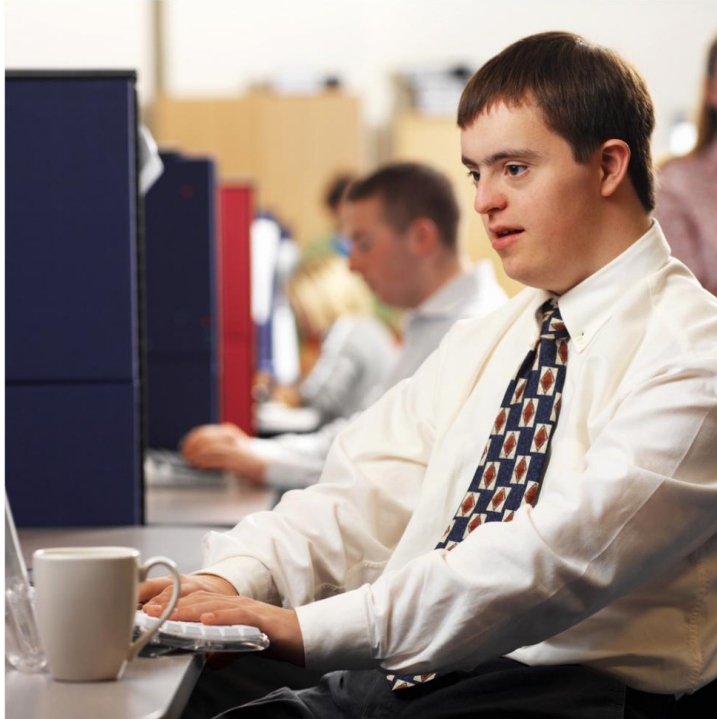
Resim 1.1: Bilgisayar kullanmayı öğrenen özel gereksinimli birey