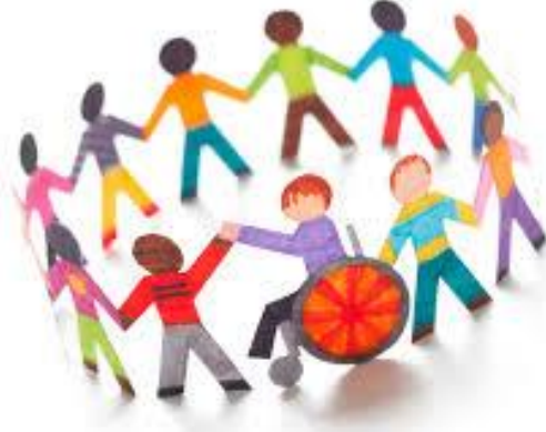
Şekil 2.1: Sosyal bütünleşme

Kaynaştırma yoluyla eğitimin tanımından da anlaşılacağı üzere bu eğitimde amaç, toplumda birlikte yaşayan yetersizliği olmayan bireyler ile engelli bireylerin birbirlerinden etkileşim yoluyla etkilenmeleridir. Kaynaştırma yoluyla eğitimdeki yaklaşım normal bireylere, toplumda engelli bireylerin de bulunduğu bilincinin aşılması, onlarla birlikte yaşamının kaçınılmaz olduğu esasının benimsetilmesidir. Kaynaştırma eğitiminin amacı çocuğu normal hale getirmek değil onun ilgi ve yeteneklerini en iyi şekilde kullanmasını sağlamak, toplum içinde yaşayabilmesini kolaylaştırmaktır. Kaynaştırma eğitiminin uygulanmaması durumunda ise özel eğitime ihtiyacı olan öğrenciler toplum dışına itilmekte ve onlara kendi yeterliliklerini geliştirme fırsatı verilmemektedir.