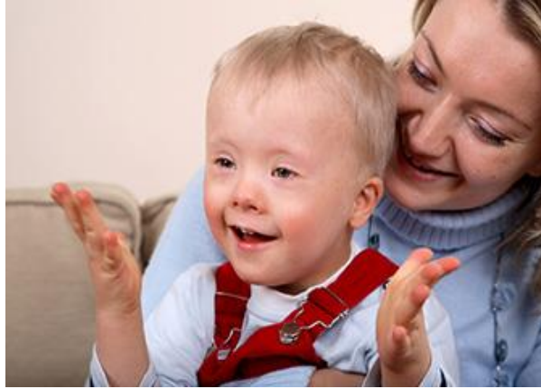
Resim 1.2:Kabul ve uyum aşaması