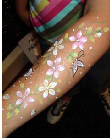
Resim2.2: Kolda çiçekler

Vücut boyama sanatı artistik görsel ifadedir; şeklindeki tanımda belirtildiği gibi insan vücudu estetik bir tablonun tuvali olarak kullanılır. Bu eşsiz ve renkli tablo, altında pek çok anlam taşır. Vücut boyama yaptıranlar ve meraklıları yapılan işi sanatsal faaliyet olarak görürken, müstehcen ve riskli bulanlar vardır. Ancak bizimle ilgili kısmı; boyna, ellere ve kollara, omuzlara, ayak ve bacaklara uygulanabilecek, göze hoş görünen ve çocuğu, anne-babayı mutlu eden çalışmalardır.