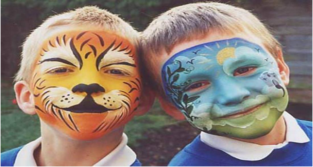
Resim 1.3:Hayvan ve doğa figürleri

Doğum günü partilerinde ve bazı özel günlerde çocukların tercihlerine göre yüzlerine hayvan figürleri (kelebek, kedi, aslan, panda ve hayvan çizgi film kahramanları) çalışılabilir.