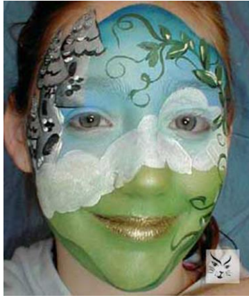
Resim1.2: Yüzde bahar

Güzel olma, göze hoş görünme demektir. Zihnimizde hoş a giden duygular oluşturan düşünce, olay, obje vb' nin estetik deđer taşıdığını söyleyebiliriz. Yüz boyama çalışmalarının beğenilmesi onun estetik deđer taşıdığını gösterecektir. Bu nedenle dizaynlar, yapılacak faaliyetin sebebine ve arzu edilen zorluk derecesine göre seçilmelidir. Yüzdeki yara izi veya hayalet yüzü gibi dizaynlar özel jeller ve soluk renkli boyalar gerektirmekte ve arzu edilen etkinin elde edilmesi ustalık istemektedir. Estetik görüntü için tema, göz önünde bulundurulmalıdır. Ayrıca dizaynı taşıyacak çocuđun kendisini rahat hissetmesi sağlanmalıdır. Korsan gibi görünmek isteyen bir çocuđa Örümcek Adam veya köpek balığı figürünü yaptırması konusunda baskı yapmanın ne anlamı nede faydası vardır.