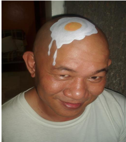
Resim 2.3: Başa uygulama