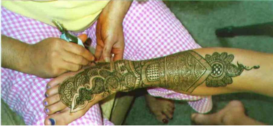
Resim 2.4: Kına uygulaması

Vücutlarına kimyasal maddeler sürmek istemeyen ancak vücutlarına estetik görüntü kazandırmak isteyen kişiler için kına en iyi çözümdür. Kına bitki özütüdür ve kullanım açısından da daha sağlıklıdır. Boyanacak hale getirilen kına, uygulama aracı ile vücuda çalışılır. Kına uygulama aracı, pasta süslemelerinde kullanılan krema enjektörüne benzer. Sürülmeye hazır hale getirilmiş kına, aracın haznesine doldurulur ve kına boyayıcıları uygulama aracını kullanarak oldukça estetik motifleri kolaylıkla insan vücuduna işler. Kuruyan kına, dökülünce altından karakteristik kırmızı rengi ortaya çıkar.