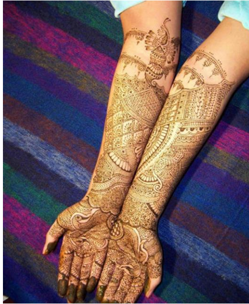
Resim2.5.: Kolda kına uygulaması

Renk ve desen seçiminde doğru karar vermek uygulamanın başarılı olması için en önemli koşuldur. Estetik görüntüyü sağlamak için renk ve desene çocukla birlikte karar vermelisiniz.