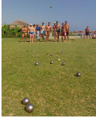
Resim 2.5: Boccia

Yukarıda sıralanan ilkeler doğrultusunda spor aktivitelerine dinamizm getirmek mümkün olabilecektir. Bu ilkelerin dikkate alınarak animasyon programlarının planlanması; konuk memnuniyetinin sağlandığı, verimliliğin ve konuklarda bağlılığın arttığı başarılı bir sezonun yaşanmasına neden olacaktır.