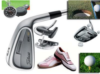
Resim 1.6: Bazı golf malzemeleri

Sezon öncesi eldeki imkanlar ve malzemeler tespit edilir. Sahip olunan malzemelere, konuk tipine, tesis özelliklerine ve işletmenin marka katkısına göre yapılacak spor aktiviteleri belirlenir. Eksik malzemeler ve yeni aktiviteler için gereken malzemeler temin edilir. Futbol topları, basketbol topları, formalar, tenis malzemeleri, dalış malzemeleri, golf malzemeleri gibi... Bu malzemeler işletmenin sistemine göre ücretli veya ücretsiz olarak misafirlerin kullanımına sunulur. Ayrıca bazı spor malzemeleri ise işletme tarafından satışa sunulmalıdır. Şapka, tişört, forma, palet, şnorkel, gözlük gibi... Bazı misafirler yapmak istedikleri spor aktivitesi için kişisel malzemelerini zaten yanlarında getirirler. Golf malzemelerini, tenis malzemelerini, masa tenisi için raket, koşu ayakkabısı, yürüyüş ayakkabısı gibi. İşletme bu malzemelere sahip olmayan misafirlere bu malzemeleri sağlayabilmelidir. Misafirlerin yanlarında getirmeleri mümkün olmayan spor malzemelerini ve araç gereçleri ise işletme sağlar. Örneğin; bisikletler, golf arabaları, okçuluk malzemeleri, sualtı dalış malzemeleri vb. gibi.