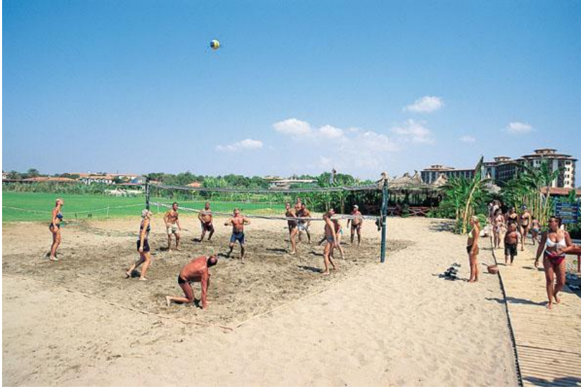
Resim 2.6: Plaj voleybolu

Bu aşamada aktivitelerde kullanılacak her türlü malzeme, donanım, araç ve gereçlerin neler olduğu belirlenir. Örneğin masa tenisi ile ilgili bir aktivite düzenlenecekse bu aktivite için masalar raketler pinpon topları file gibi malzemeler yeterli sayıda ve standartlara uygun olarak temin edilir. Ya da eksikler tamamlanır. Bu tür tespitler planlanan tüm spor aktiviteleri için yapılır. Mevcutlar ve eksikler belirlendikten sonra aktiviteler için gerekli olanlar temin edilir.