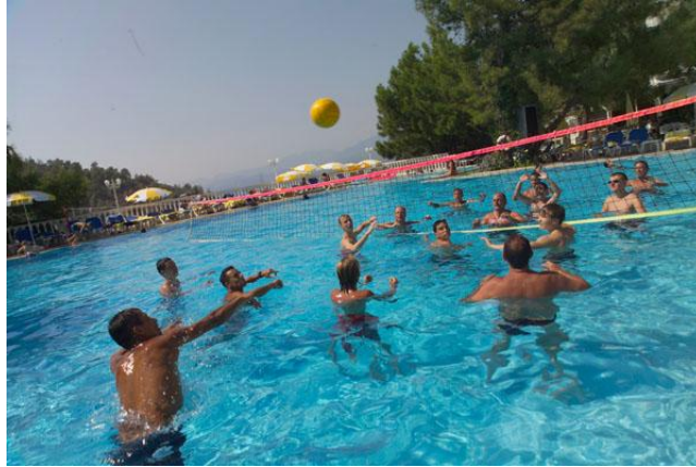
Resim 2.4: Havuzda voleybol