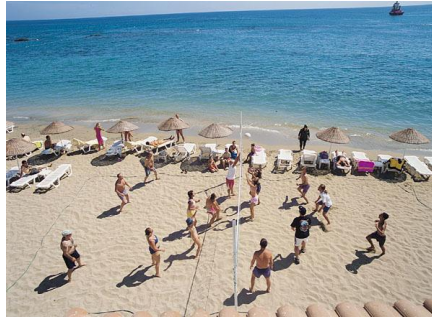
Resim 1.2: Plaj voleybolu

Sportif faaliyetler ve oyunlarla bireyler bir grup üyesi olarak yasalara saygılı, dışa dönük, girişken kişiliğe bürünürler. İşbirliği, paylaşma duyguları gelişir. Toplumsal sorumluluğu geliştirir. Kendini kontrol etmeyi, başkalarına, kurallara saygıyı öğretir. Ölçülü ve planlı bir şekilde çalışmayı ve dinlenmeyi öğretir. Birlikte olma, birlikte iş yapma ve bireyin toplumda kendisini belirlemesine olanak verir. Genç nesillerin yapıcı, yaratıcı ve üretici olmasında, sosyal kaynaşma ve kültürel kalkınmaya büyük etkisi olmaktadır. Avrupa