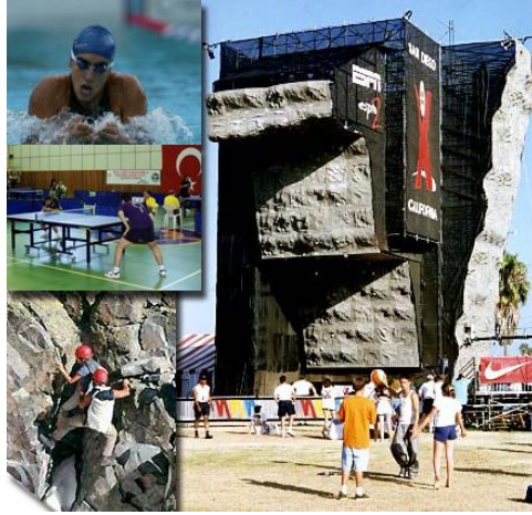
Resim 1.4: Bireysel sporlardan örnekler