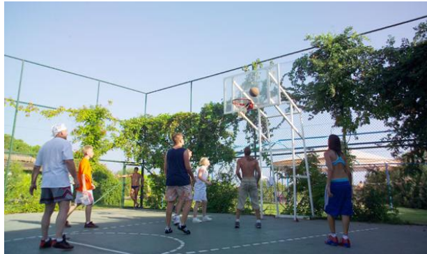
Resim 2.1: Güzel bir takım sporu basketbol