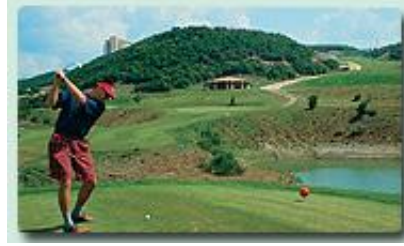
Resim 1.1: Golf

Fiziksel, zihinsel ve toplumsal faktörlerin bütünleşmesinden oluşan bir kişilik kazanılır. Kültürel zevk, duyarlılık sağlar. Boş zamanlarında sporla uğraşan insanlar zararlı faaliyetlere yönelmeyeceklerinden dürüst bir karaktere sahip olurlar. İnsanlar karşı takıma veya oyuncuya yapılan aleyhte tezahüratlarla deşarj olacaklarından saldırganlık eğilimlerini doyurarak gerginliklerini atarlar. Bireyler bir gruba, bir takıma katılacaklarından yalnızlık duygularından kurtulurlar.