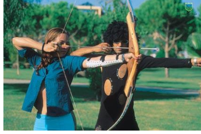
Resim 1.5: Okçuluk

Spor aktivitelerinde çok çeşitli malzemeler kullanılmaktadır. Bunlar sezon öncesinde yapılması planlanan spor aktivitelerine göre tespit edilir ve sağlanır.