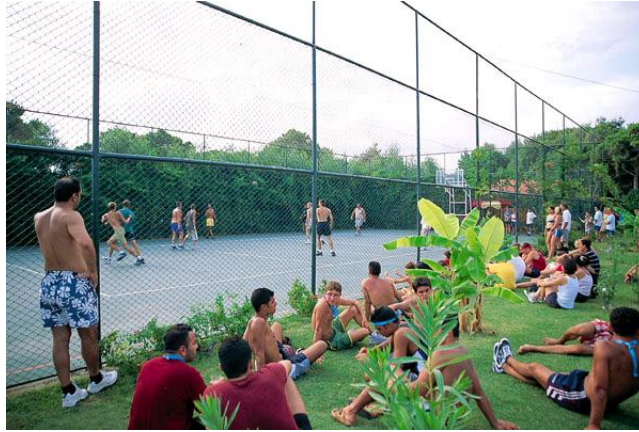
Resim 2.3: Aktiviteleri izlemek de keyiflidir