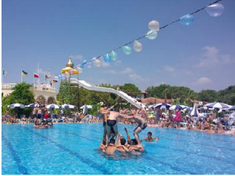
Resim 2.2: Eğlendirici havuz etkinlikleri