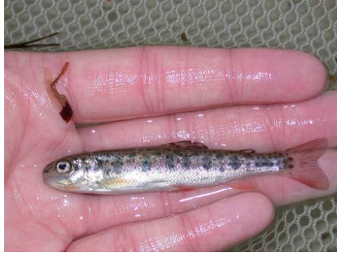
Resim 3.2: Smolt boy somon yavrusu