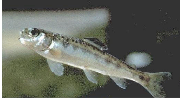
Resim 2.3: Parr dönemi yavru somon

Damızlık, somonlar yetiştiricinin tercihine bağlı olarak denizdeki kafeslerden alınarak hiçbir adaptasyona tabi tutulmadan veya sağımdan bir ay önce kara tesisine (kuluçkahaneye) alınıp tatlı suya adapte edildikten sonra sağılır. Sağım ve yumurtaların döllenirilmesi işlemi gökkuşuğu alabalığında uygulanan metodun (kuru yöntem) aynısıdır.