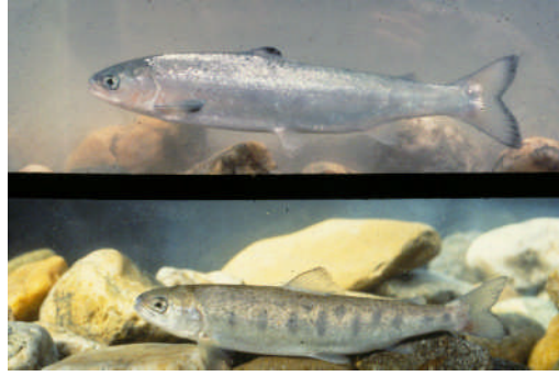
Resim 3.1: Parr (üstte) ve smolt (altta) boy somon yavrusu