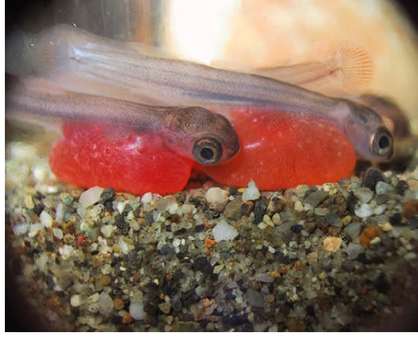
Resim 2.2: Alevin dönemi larva