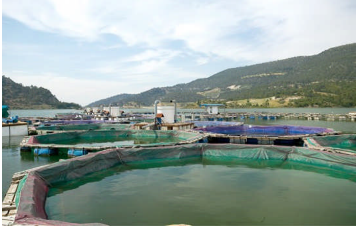
Resim 4.1: Ağ kafes sistemi