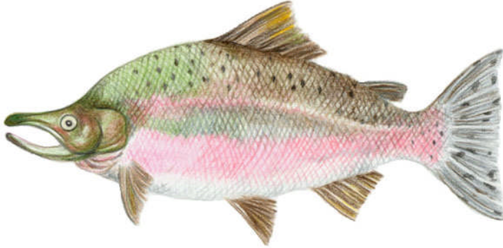
Resim 1.3: Oncorhynchus gorbuscha