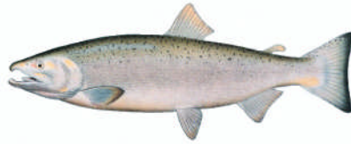
Resim 1.2: Oncorhynchus keta