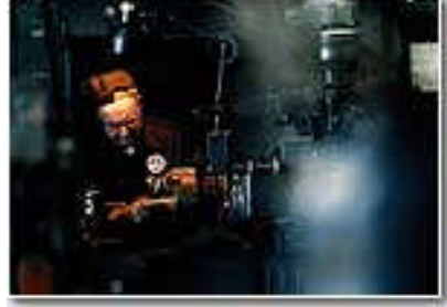
Resim 1.8: Makine başında çalışan işçiler

Normal çalışır hâlde iken veya aynı iş yerinde temizleme, revizyon veya yer değiştirme esnasında veya dururken, "ani ve beklenmedik", "istisna edilmeyen" her türlü sebepten meydana gelen maddi risklerdir.