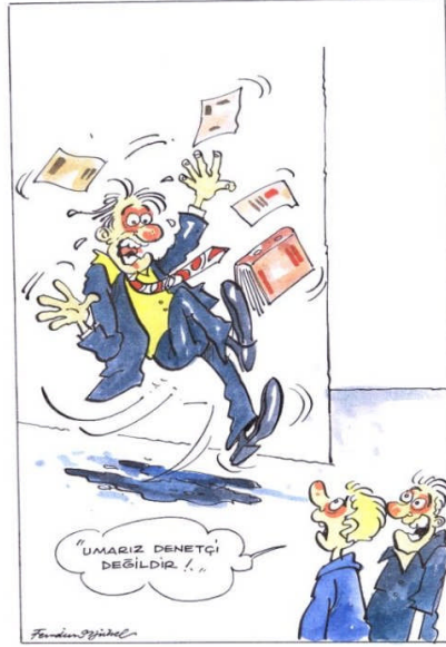
Resim 1.1: Hayat bir risktir.

Risk kelimesi bir çok dilde çeşitli yazılışlarla ama aynı telaffuza yakın şekillerde kullanılmaktadır. Ülkemizde risk kelimesi ile birlikte riziko kelimesi de yaygın olarak kullanılmaktadır.