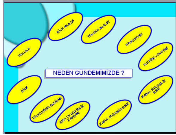
Şekil 1.2: Risk analizinin yapılma sırası

Risk analizinin yapılabilmesi için öncelikle risklerin değerlendirilmesi gerekir. Risk değerlendirilmesi aşağıdaki şekilde yapılır.