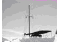
Resim 1.5: Tekne ile nakliyat

Sigorta güvencesinin kapsamında, sigorta konusu menfaatin, tür, zaman ve yer itibarıyla hangi risklere karşı teminat altına alındığı ve teminat kapsamındaki bir riskin gerçekleşmesi sonucu meydana gelen hangi zararların ne miktarda karşılanacağı hususları bildirilir.