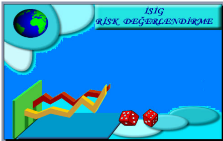
Şekil 1.1: Risk gösterimi

Öncelikle mal ve can üzerindeki risk analizlerinin yapılması esastır. Çünkü risk analizleri yapıldığı zaman mevcut riskler göz önüne çıkacaktır. Ve bunun sonucu kişi veya işletmeler mevcut riskleri bilip ona göre önlem alabileceklerdir.