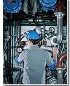
Resim 1.9: Makinede çalışan bir mühendis