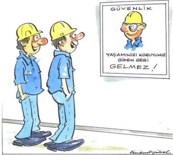
Resim 2.1: Hayatımız neden değerlidir?

Kişi yaşamı sırasında canını, bedenini, kendisini ve ailesini ilgilendiren tehlikelerle karşı karşıya gelir. Kişi kendisi üzerine gelen mali yüklerden kurtulmak ister. Bu riskler, yaşlılık, geçici veya kalıcı sakatlık, iş göremezlik, ölüm gibi risklerdir. Gerçekleştiklerinde, geleceği önemli ölçüde etkileyen bu riskleri kontrol altına almak hayat branşı üretimi içinde yer alır.