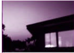
Resim 1. 2: Sigortalı bir ev

Konutlarla ilgili risklerdir. Konut olarak kullanılan binaların ve konutla ilgili eşyaların risklerini kapsar. Çok sayıda örnekleri vardır.