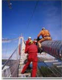
Resim1.6: İnşaatta çalışan işçiler