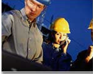
Resim 1:7: Makine montajı yapan işçiler

Montaj işi ile ilgili makine ve teçhizatın iş sahasına varmasından itibaren, bu malzemenin sahada beklemesi, birleştirilmesi, bağlantıların yapılması gibi montaj işlemlerinin tümü süresince doğan, "istisna edilmeyen", "önceden bilinmeyen" ve "ani bir sebepten" ileri gelen risklerdir.