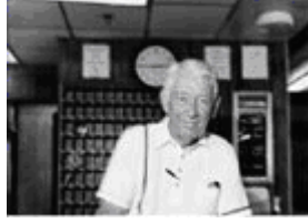
Resim 1.3: İş yerini sigorta ettiren kendinden emin biri

Büro, eczane, muayenehane, bakkal, terzi, mobilya imalathaneleri, un, şeker, çimento fabrikaları, tekstil atölyeleri, matbaalar, depolar vb. iş yerle de ilgili risklerdir. Bu grupta, endüstriyel risklerden yalın ve çok sayıda bulunan riskler de olabilir. Bu riskler, çok yaygın olan işletmelerle ilgili riskler olduğu için fiyatlandırılmaları daha önceden saptanan kıstaslar çerçevesinde yapılabilir.