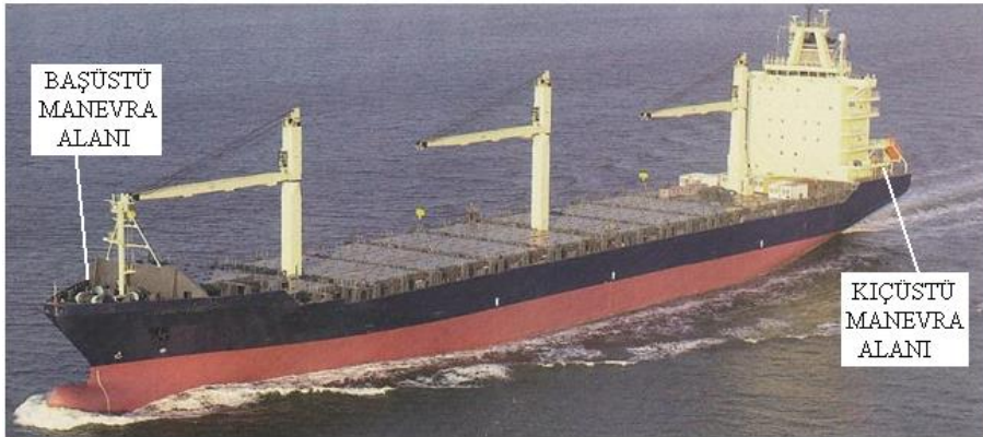
Resim 1:-Başüstü ve kıçüstü manevra yerleri

Geminin bağlanması; bir geminin bekleme veya bir işlem için rıhtım, iskele, platform veya güvenli bir başka yere halatlar yardımı ile bağlanmasıdır. Bu bağlanma, bordadan veya kıçtan kara şeklinde olabilir.