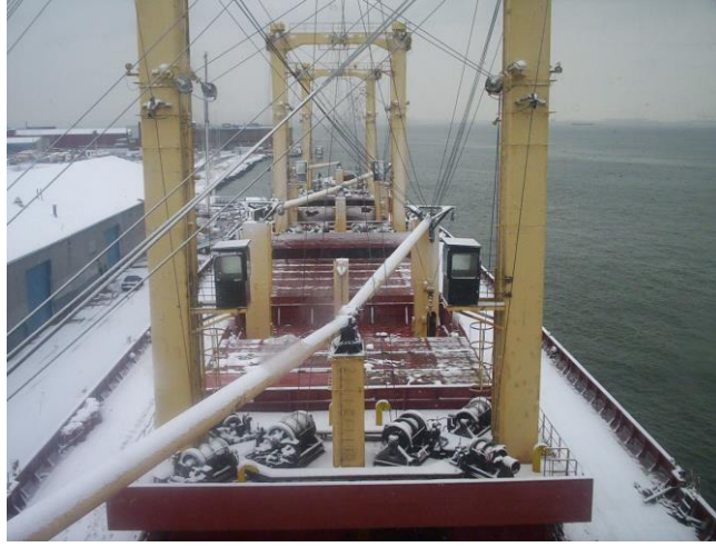
Resim 2- Kar ile kayganlaşmış güverte

Ve tüm bunlar güverteyi kayganlaştırıp üzerinde dolaşan insanların düşmesine, yaralanmasına, sakatlanmasına ve hatta ölmesine sebep olabilir. Hele gemi sacdan33 yapılmışsa ki bugün gemilerin hemen hemen tamamına yakını sacdan yapılmıştır, bunlarda düşülecek sac zemin riski daha da yükseltmektedir.