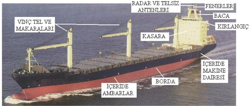
Resim 3:-Yüksekte çalışma yapılan yerler

Yüksekte çalışma; düşme halinde bir yaralanma, sakatlanma veya ölüme sebep olabilecek derecede güverteden yüksek yerlerdeki çalışmalardır. Gemilerin dış tarafında yani bir düşme halinde denize veya bağlanılan yerlere düşülebilecek yerlerdeki çalışmalarda yüksekte çalışma olarak değerlendirilir.