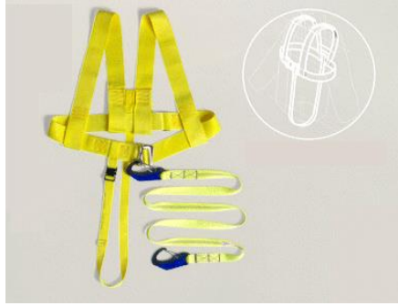
Resim 4: Emniyet kemeri

Yüksekçe bizi düşmelerden koruyacak en önemli teçhizat emniyet kemeri. Emniyet kemeri, üzerindeki kilit ve kancaların güvenli yerlere takılması ile takanı güvenceye almaya yarayan bir kemerdir. (Resim-4)