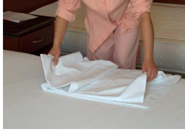
Resim2.3: Alt çarşaf açma 1

Alt çarşaf yatak koruyucunun üzerine serilir. Çarşaf yatağın iki tarafından eşit olarak sarkmalıdır.