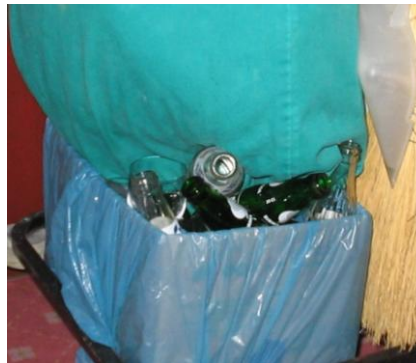
Resim 3. 9: Kat arabasında cam atıklar

Banyo çöp sepetleri plastik veya metal malzemeden yapılır, kapaklı ve plastik çöp poşeti kullanılabilir olmalıdır. (Resim 3. 9)