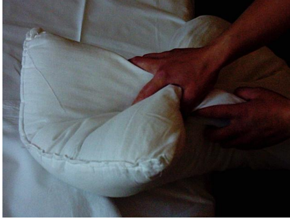
Resim 2.7: Yastık kılıfı takma