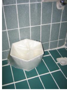
Resim 3.1: Çöp poşeti