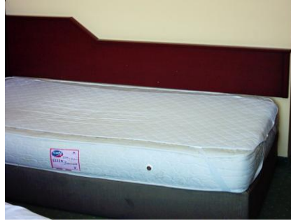
Resim 1 . 8: Yatak koruyucu

Yatak yıkanabilen bir malzeme değildir. Yatağın kirlenmemesi için, pamuklu dokumadan yapılmış yatak koruyucu alt çarşaftan önce yatağa serilir. Böylece herhangi bir leke ya da ıslaklık yatağa geçmeden yatak koruyucuda kalır. Yatak koruyucu sadece yatağı korumakla kalmaz, teri de emer. Bu nedenle sağlık açısından son derece önemlidir. Ayrıca, leke tutmayan malzemelerden yapıldığı ve kolay yıkandığı için de kullanışlıdır. Yatak koruyucu yatağın üst yüzünü kaplamalı, yataktan büyük veya küçük olmamalıdır.