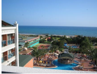
Resim 3. 7 :Otelin çevresi

Otel işletmelerinin kurulduđu yer ve faaliyet gösterdiđi bölgedir. Konukların işletmemizde kaldığı sürece çevrede oluşan kötü görüntü ve kokulardan rahatsız olmaması için otel işletmecileri gereken tüm tedbirleri alırlar.