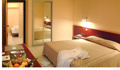
Resim 1.3: Connecting room