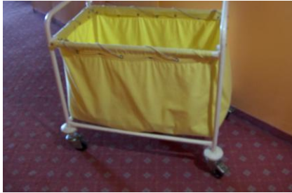
Resim 2.1: Kirli arabası