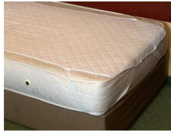
Resim 2.2: Yatak koruyucunun geçirilmesi

Kirli yatak takımları toplanırken yatak takımları içerisinde konuğa ait herhangi bir şey kalıp kalmadığı kontrol edilmelidir. Ayrıca, lekeli yatak takımları diğerlerinden ayrılmalı, işaretlenmeli (köşesine bir düğüm atılarak işaretlenebilir veya bir poşete konular üzerine oda numarası yazılır) çamaşırhaneye ayrı olarak gönderilmelidir. Yastık kılıfı dikkatlice çıkarılmalıdır. Bunun için yastık kılıfının kapak kısmı açılmalı ve yastık köşelerinden tutularak kılıf üzerinden sıyırılmalıdır. Dikkatsizce yapılacak bir işlem yastık kılıfının yırtılmasına neden olacaktır. Köşelerdeki battaniye ve çarşaf, çekiştirmeden dikkatlice çıkarılmalıdır. Önce battaniye temiz bir yere (sandalye, koltuk vb.) bırakılmalı, daha sonra çarşaf bohça şeklinde toplanmalıdır. (Resim 2. 1)