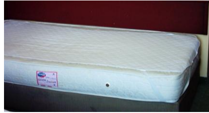
Resim 1.7: Yaylı yatak