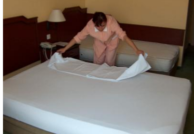
Resim 2.4: Alt çarşaf açma 2

Bunu sağlayabilmek için çarşafın ortası yatağın ortasına ve çarşafın kenarları üste gelecek şekilde yerleştirilmelidir. Çarşafın üstteki kenarlarını yatağı yapan, kendine doğru çekerek açmalı daha sonra yatağın diğer tarafına geçerek çarşafın diğer katını da aynı şekilde açmalıdır.