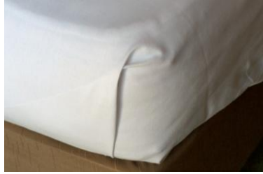
Resim 2.6: Köşe yapımı

Üst arşaf, kenarlardaki dikiş yerleri üste gelecek şekilde yerleştirilir. Üst arşafın yatak başından 10 cm. sarkacak şekilde yerleştirilmesine dikkat edilmelidir. Bu kısım daha sonra battaniyenin üstüne katlanacaktır.