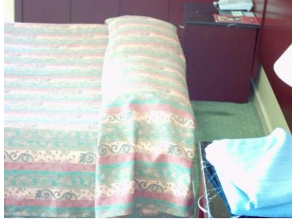
Resim 1.5: Çekilebilen yatak