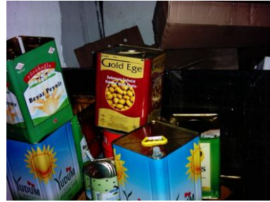
Resim 3.4: Kat arabasındaki çöp tobası Resim 3.5: Metal atık deposu