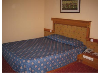
Resim 1.1: Çift kişilik yatak