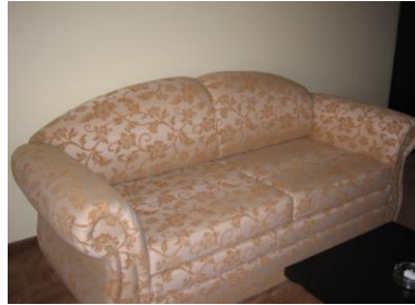
Resim 2.9: Çek-yat