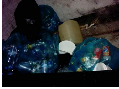
Resim3. 6: Plastik atık deposu

İnsan sađlığını tehdit etmeyecek, dışarıya karşı Resim1 1 hijyen şartlarının sađlandığı ve çöplerin kolay nakil edilebileceđi ortamlarda depolanmalıdır.