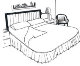
Resim 2.10: Yatak açma

Odada kalan konuğun özel isteği üzerine yapılan bir hizmettir.