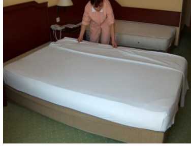
Resim 2.5 Alt arşaf açma 3

yatađın üstüne bırakılan arşaf ise öne doğru getirilerek bir elle köşe tutulup kaldırılmalı diđer elle arşaf yatađın altına sokulmalıdır.