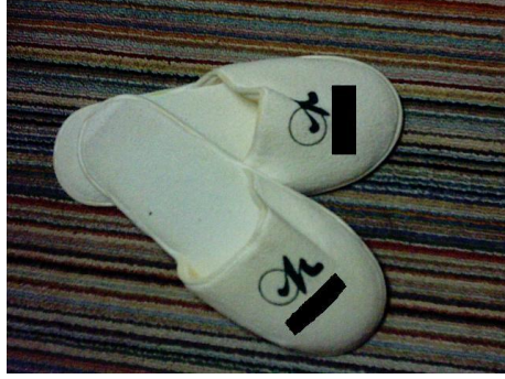
Resim 2.11: Terlik