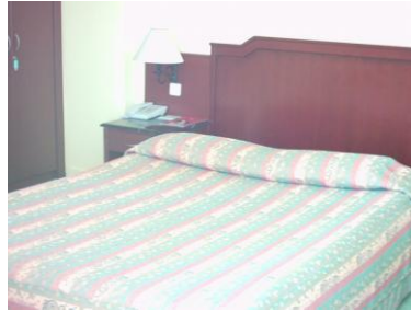
Resim 1.6: Yapılmış yatak