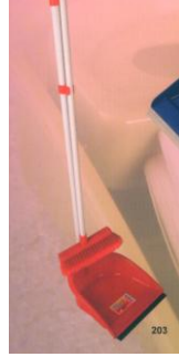
Resim 3.2: Süpürge-faraş