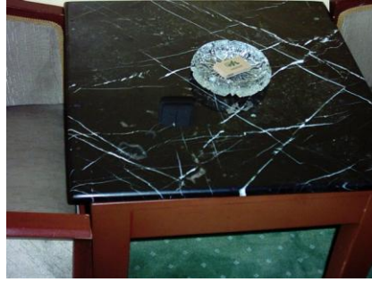
Resim 3. 8: Kül tablası

Oda temizliğine başlarken ilk yapılacak iş kül tablasının temizlenmesidir. Kül tablası temizlenmeden pencere açılacak olursa, kül tablalarında uçacak kül odaya yayılır.