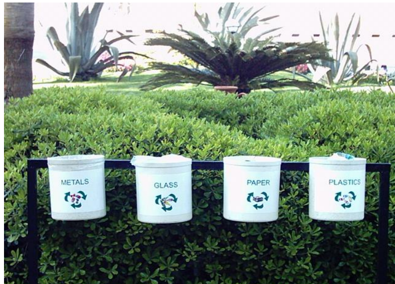
Resim 3.3: Atık çeşidine göre çöp kutuları

Kullanıldıktan sonra standartlara uygun olarak toplanan, sanayide işlenerek tekrar kullanıma sunulan, kullanılabilir (kağıt, çam eşya, plastik eşyalar vb.) madde haline getirilebilen atıklara dönüşümlü çöp diyoruz. (Resim 3. 3)