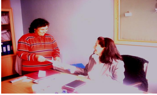
Resim 1.2: Konuşurken karşıdaki kişinin yüzüne bakma