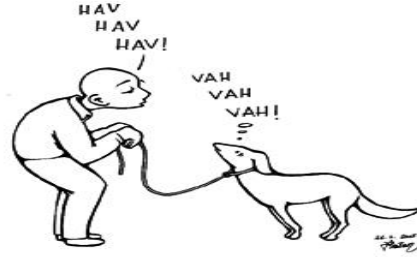
Resim 1.3: Kendini başkasının yerine koyma (Empati)

Empati tepki vermenin başlıca iki yolu vardır. Birincisi, beden dilimizi kullanarak onu anladığımızı ifade etmek; diğeri ise sözlü olarak onu anladığımızı ifade etmektir. Ancak empatik tepki vermenin en etkili yolu, herhalde ikisini birden kullanmaktır. Böylece daha etkili bir şekilde amacımıza ulaşabiliriz.