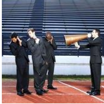
Resim 3.1: Güzel ve etkili konuşmak

Güzel konuşmak, dinleyeni etkiler ve konuşanın başarısını artırır. Duygu, düşünce ve hayallerimizi etkili bir şekilde anlatabilmek için en çok ihtiyaç duyduğumuz şey sözcük hazinesidir. Etkili ve güzel konuşabilmek için bilgi birikiminin yanı sıra örnek konuşmaları da okumak gerekir. Konuşurken kekelememek, ‘uuuu’ gibi sesler çıkarmamak, sözcükleri doğru söylemek, cümlede vurguyu yerli yerinde yapmak da önemlidir.