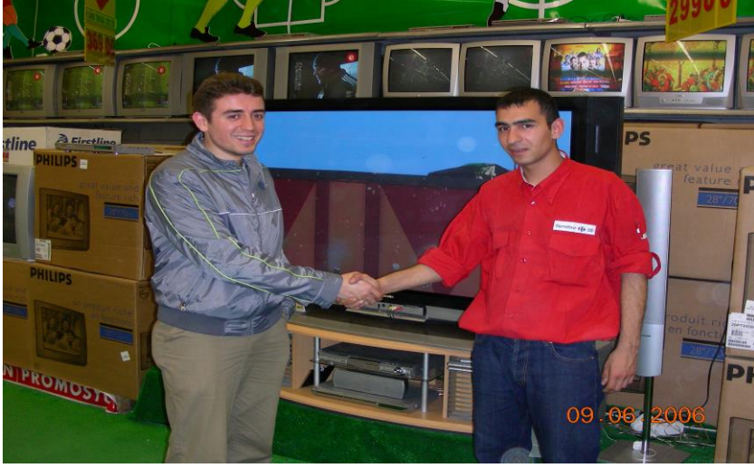
Resim 1.6: Mutlu bir müşteri