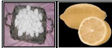
Resim 1.16: Sitrik asidin yapay ve doğal şekli