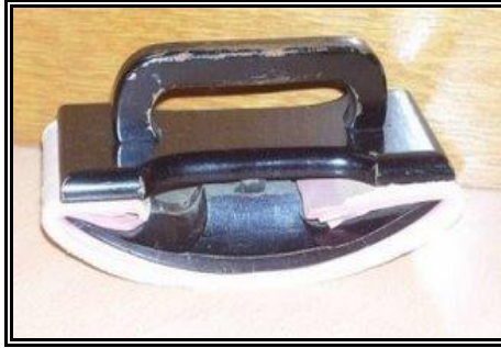
Resim 1.7: Kurutma kâğıdı ve aleti