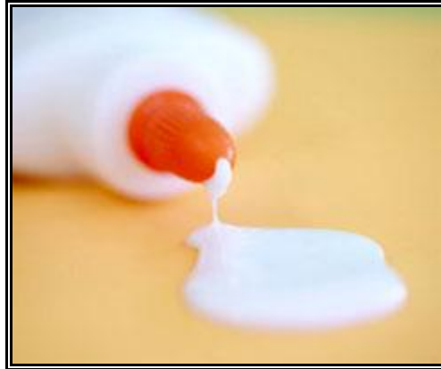
Resim 2.4: Kabuklu leke olan uhu ve benzeri yapıştırıcı lekeleri