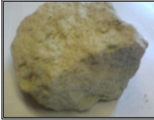
Resim 1.6: Kil toprağı