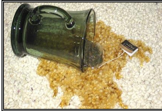
Resim 2.15: Çay lekeli