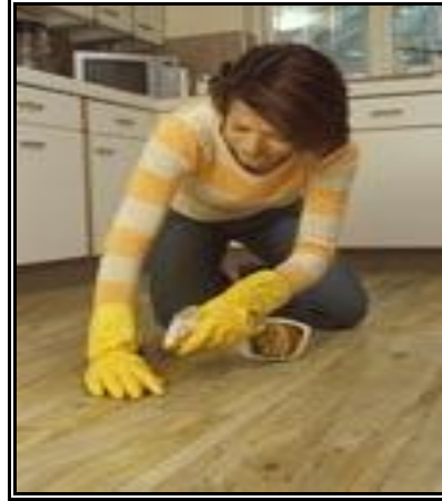
Resim 2.18: Cilasız tahta üzerinden leke çıkarma uygulaması