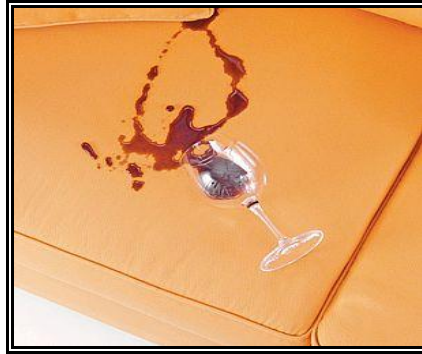
Resim 2.11: Şarap lekesi