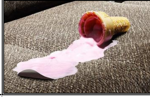
Resim 2.5: Süt ve sütlü tatlılar leke grubundan olan dondurma lekesi