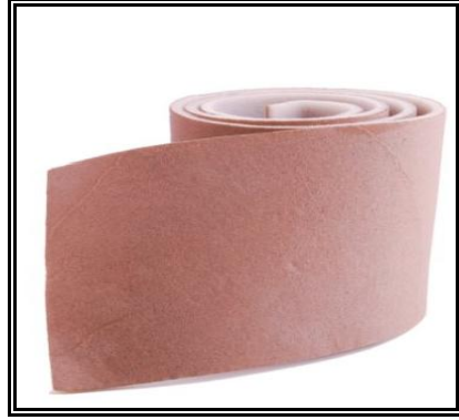
Resim 1.4: Rulo zımpara