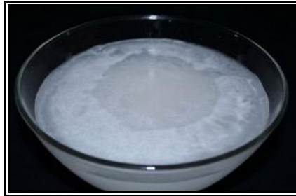
Resim 1.19: Sönmüş kireç kaymağı