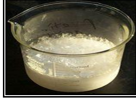
Resim 1.17: Asetik asit