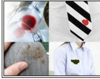
Resim 1.1: Lekelerin kişiyi psikolojik olarak etkilemesi