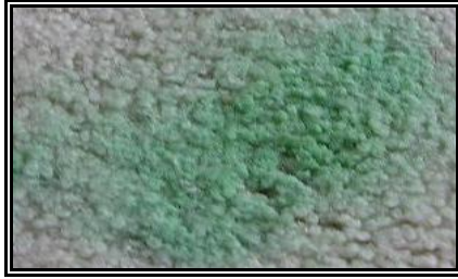
Resim 2.21: Yağlı boya lekesi