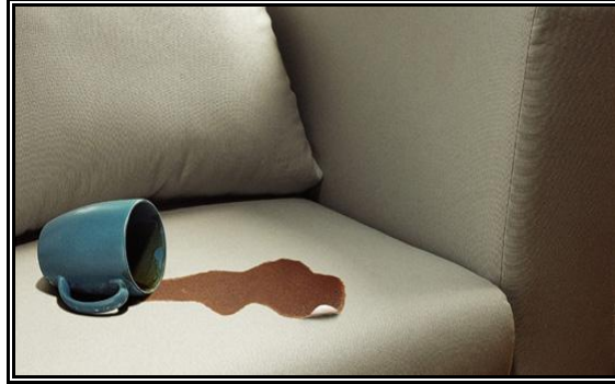
Resim 2.16: Kahve lekesi