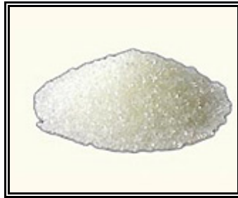
Resim 1.5: Talk pudrası