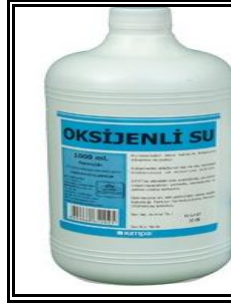
Resim 1.18: Oksijenli su