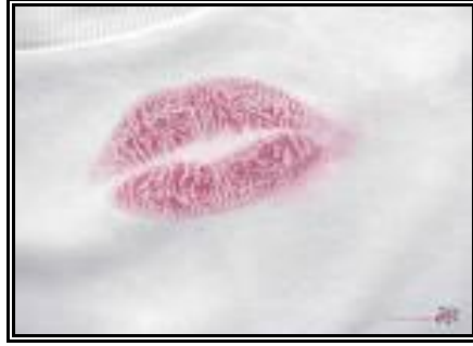
Resim 2.7: Sık karşılaşılan leke çeşidi