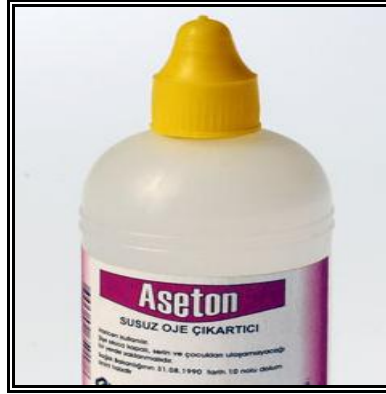
Resim 1.13: Aseton