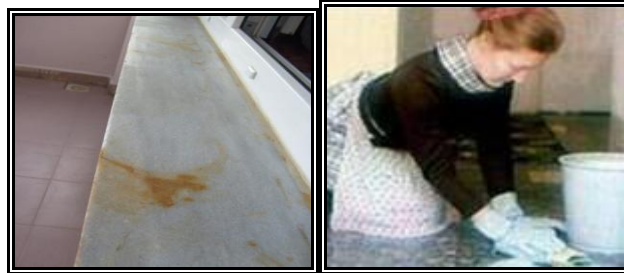
Resim 2.20: Taş döşeme üzerinde oluşan leke ve çıkarma uygulaması