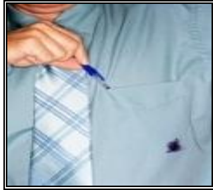
Resim 2.8: Kalemlerin kapaklarının kapalı olarak cebe konulması