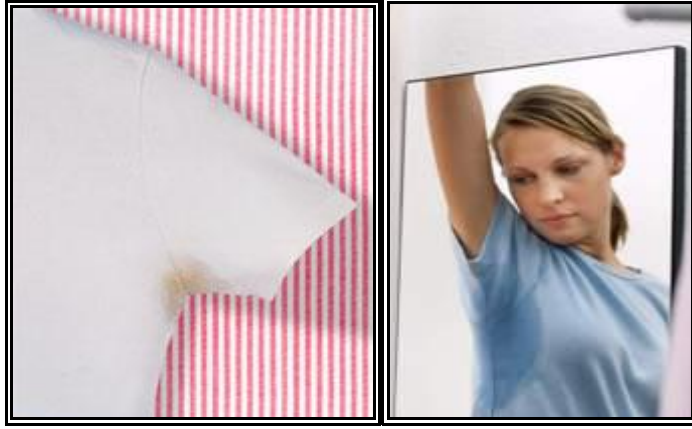
Resim 2.14: Ter lekeli