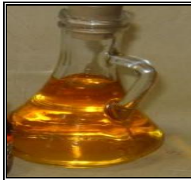
Resim 1.12: Terebentin esansı