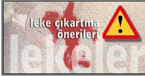
Resim 1.2: Başarılı sonuçlar için önerilere dikkat etmenin gerekliliği