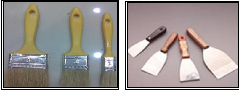
Resim 1.3: Çeşitli boylarda fırça ve spatulalar