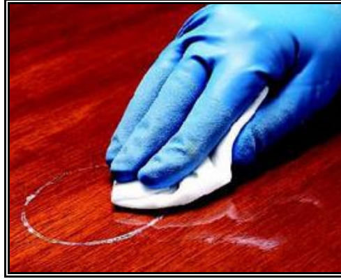
Resim 2.19: Cilalı tahta üzerinden leke çıkarmada tahtanın çizilmemesine dikkat edilmesi