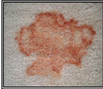
Resim 2.22: Başarısız leke çıkarma çalışması