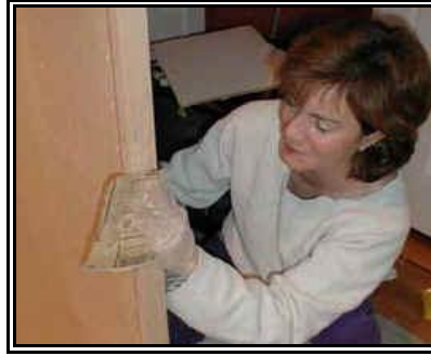
Resim 2.23: Lambri ve tahta duvar kaplamaları üzerinden leke çıkarma uygulaması

Lambriler mat cila ile cilalandığı için bakım ve temizliği kuru bez ile tozu alınarak yapılır. Lekeler kuru bez ile silinir, leke çıkmazsa kuruya yakın nemli bezle silinir ve hemen kurulanır. Lambri üzerindeki lekeleri çıkarmada mobilya bakım spreyleri de kullanılır. Bakım ürünleri mobilya üzerindeki kirleri, parmak izlerini ve hafif lekeleri temizler ve parlaklık kazandırır. Lambri ve tahta duvar kaplamaları üzerinden leke çıkarılırken eriticiler ve ovucular kullanılmamalıdır.