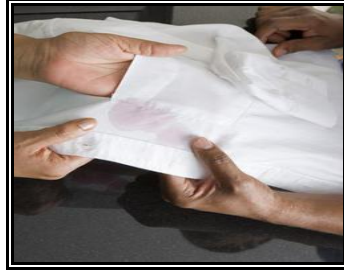
Resim 2.10: Renkli leke olan meyve lekesi