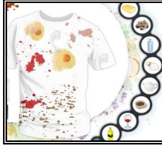
Resim 2.1: Her lekenin çıkarılma yöntemi farklı