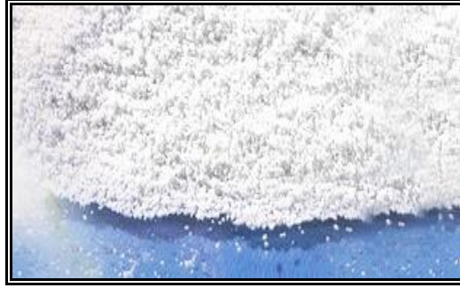
Resim 1.11: Suda kolay çözünen yüzey aktif maddesi olan deterjan