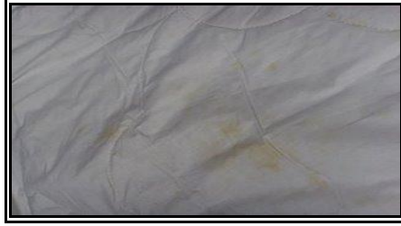
Resim 2.9: Pas lekesi