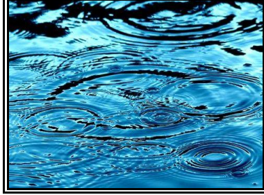
Resim 1.9: Temizlikte kullanılan yumuşak su