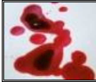
Resim 2.13: Kan lekesi