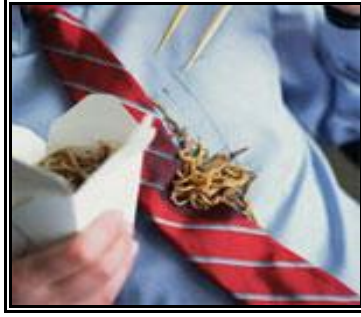
Resim 2.3: Aynı zamanda yağlı leke olan yemek lekesi

ile tamponlanarak çıkarılır. Beyaz ipekli ve yünlülerdeki renk lekesi oksijenli su, sodyum perborat veya sodyum hidrosülfid ile çalışılarak çıkarılır. Renklilerde renk açıcı maddeler kullanılmamalıdır. Pamuklu ve yapay kumaşlarda lekeli yer, ılık sabunlu veya deterjanlı su ile yıkanır. Renk lekesi kalırsa beyaz pamuklu kumaşlarda klorlu ağartıcılarla (çamaşır suyu) çıkarılır. Beyaz yapay kumaşlardaki renk lekesi oksijenli su ile çıkarılır. Renklilerde denenmeden renk açıcı kullanılmamalıdır.