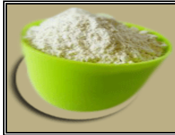
Resim 1.8: Emici özelliğinde dolayı leke çıkarmada kullanılan un