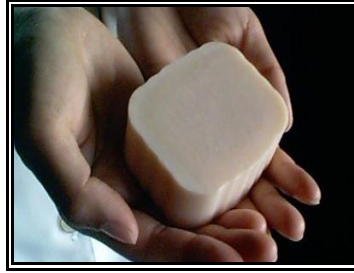
Resim 1.10: İyi bir eritken olan sabun