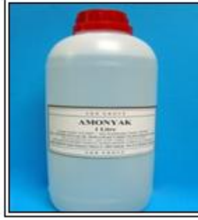
Resim 1.14: Amonyak