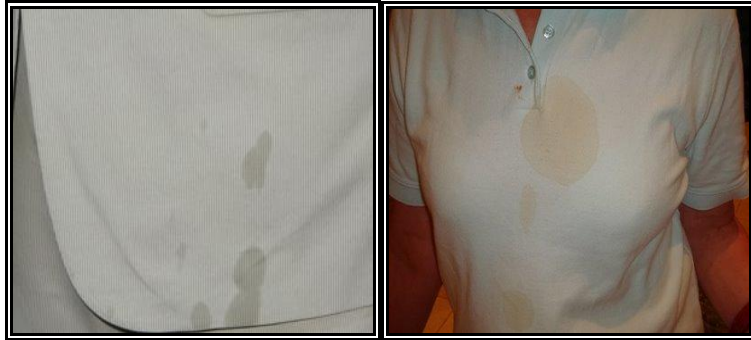
Resim 2.2: Değişik kumaşlarda oluşan yağ lekeleri