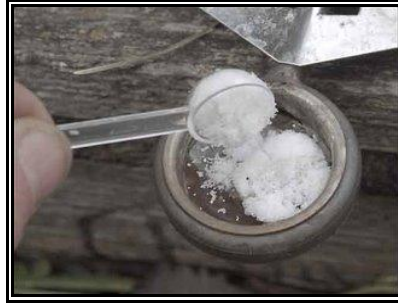
Resim 1.15: Oksalik asit