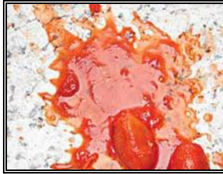
Resim 2.6: Reçel lekesi