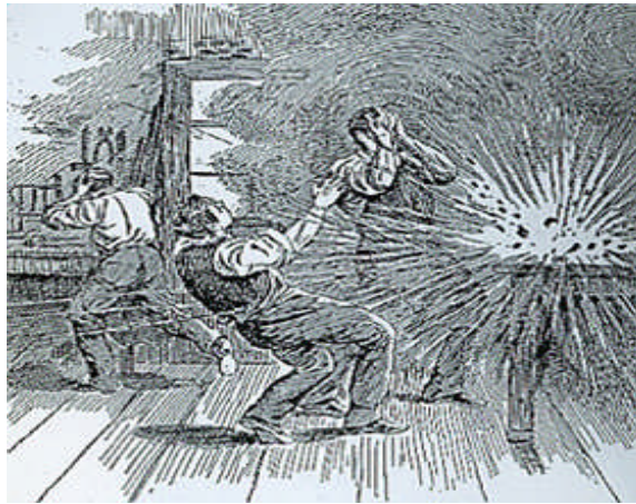
Resim 1.1: Kriminoloji (Suç Bilimi)