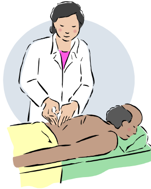
Resim 2.2: Tıbbi muayene

Tıbbi muayene sonucuna göre kişinin fiziksel ve ruhsal sorunları ortaya çıkar ve buna göre uygun tedavi yöntemleri uygulanır.