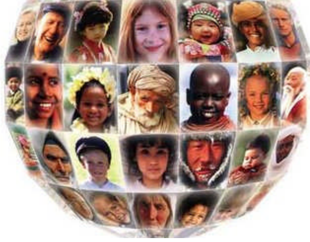
Resim 1.4: Sosyal sınıflar