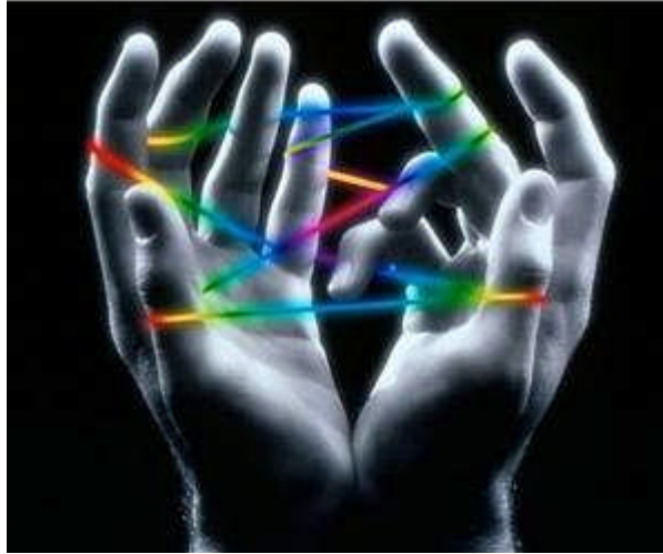
Resim 1.3: Psikolojik teoriler

Tek yumurta ikizleri birbirinden ayrı çevrelerde yetiştikleri takdirde davranış benzerliklerinin az olduğu ortaya çıkmıştır. Sapıcı davranış çok şekiller göstermektedir. Hırsızlık, sahtekârlık, adam öldürme, vergi kaçırma gibi suçlar da ancak iyi özellikler kadar soya çekim yolu ile geçer.