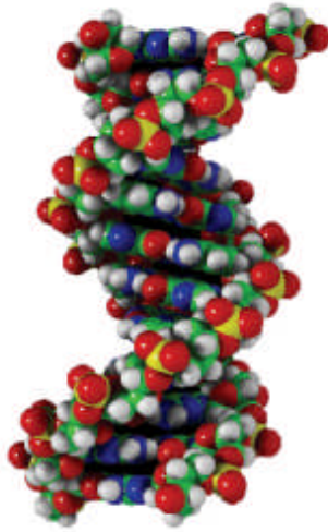
Resim 1.2: Genetik sarmal

Her beden tipinin ayrı mizacı bulunduğu ve işledikleri suçlarda bu beden yapılarının etkili olduğu savunulmuştur.