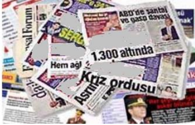
Resim1.1: Ulusal gazeteler

Gazete içinde haberlerin yanı sıra makale, fıkra, deneme, anı, sohbet, eleştiri, karikatür, fotoğraf, hikâye ve illüstrasyonlarla birlikte okuyucunun ilgisini çekecek her türlü konudaki bilgilere yer verilir.