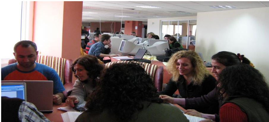
Resim1.6: Katılımlı gözleme örnek.

Arama motorlarını kullanarak katılımsız gözlem örneklerini arařtırınız.