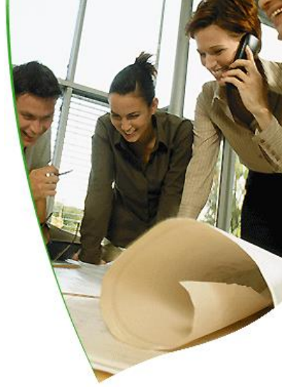
Resim1.3:İnsan kaynakları planlama vaka çalışmanın uygulama alanlarındandır.