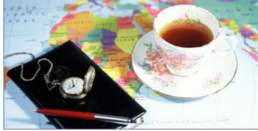
Resim1.4: Mektuplar ve anılar kişisel belgelerdir.

Çoğunlukla bu tür arşivler, o kişinin ölümünden sonra araştırmacılara açılır. Bu tür arşivlerin kullanılmasında, yanıtıcı bilgilerin alınması her zaman için söz konusu olabilir. Bu bakımdan, özel arşivlerin kaynak olarak kullanılması durumunda, alınan tüm bilgilerin başka kaynaklardan doğrulanması gerekir. Doğrulanamadığı durumlarda ise, bu durum, yazım aşamasında kaynak gösterilirken açıkça belirtilmelidir.