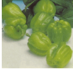
Resim 1.1: 11.B)14 dolma biber