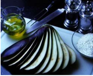
Resim2.4: Patlıcanların dilimlenmesi

İşletmenin belirlediği ebatlarda dilimlere ayrılan çekirdeksiz, acı olmayan, körpe patlıcanlar yağda hafifçe kızartılır. Doldurulmadan önce kutu ölçüsünde boyutları küçültülebilir.