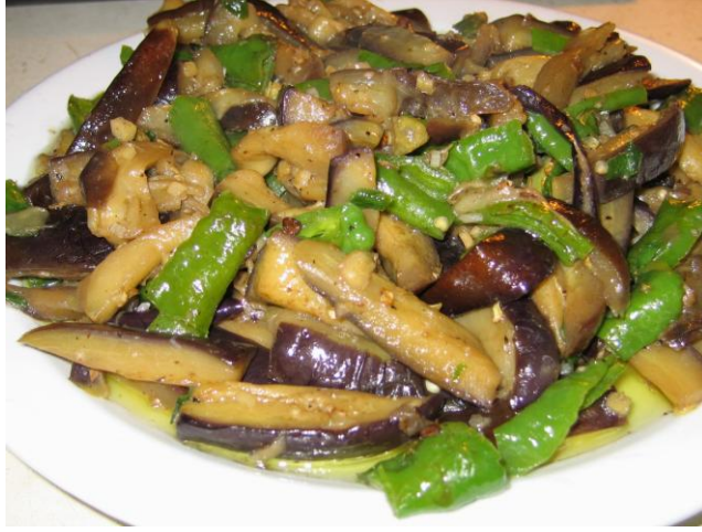
Resim2.6: Patlıcan kızartma konservesi içeriđi

Kızartma işlemleri yapılırken diđer taraftan da sos hazırlanır. Sos için kullanılacak malzemelerin oranı işletmeler arası deđişiklikler göstermekle beraber genel olarak kabul gören çeşit ve miktarlar şöyledir: