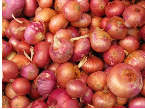
Resim 1.5: Kuru soğan