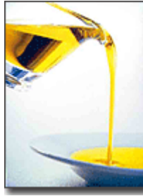
Resim 1.6: Bitkisel sıvı yağ