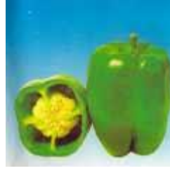
Resim1.2: Dolma biber lobu