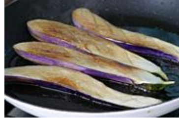
Resim2.5: Patlıcanların kızartılması

Endüstride patlıcan kızartma konservesi içeriğine patlıcanın 1/10'u kadar biber eklenebilmektedir. Biberlerin sap ve tohumları ayrıldıktan sonra uzunlamasına ikiye bölünerek kızartılır.