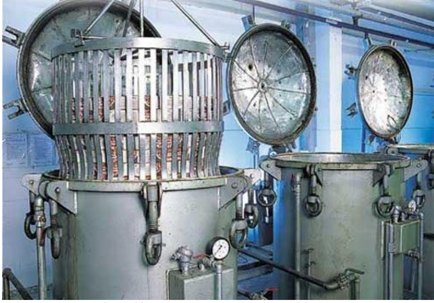
Resim 1.12: Kutuların otoklavda sterilizasyonu