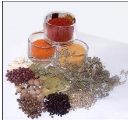
Resim 1.7: Baharatlar