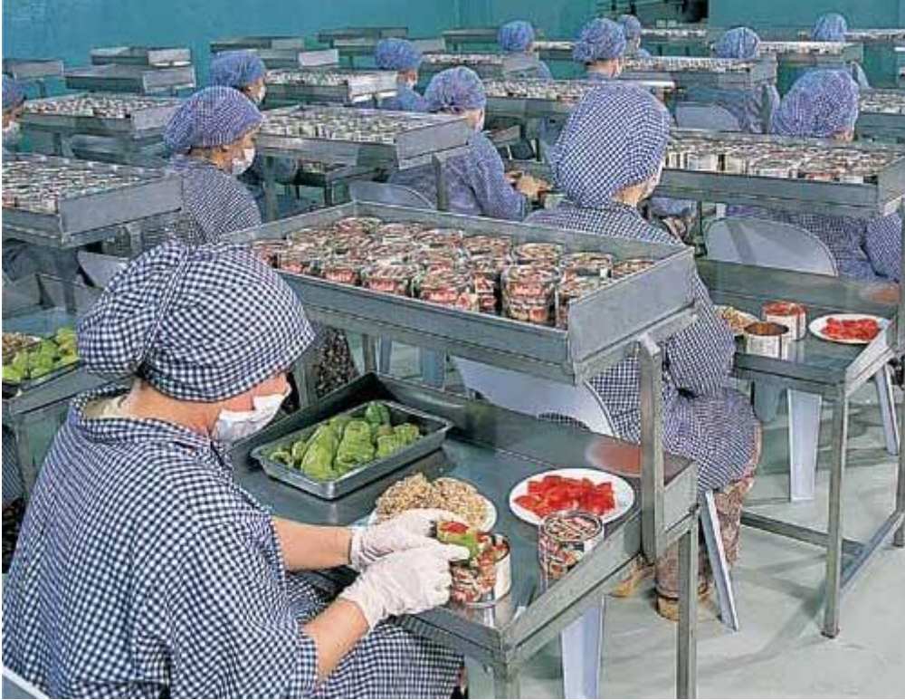
Resim 1.11: Dolma biberlerin doldurulması

Dinlendirilmiş dolma içi, ön işlemleri tamamlanmış biberlerin içine doldurulur. Üstüne bir dilim domates konur. Bu işlem yapılırken diğer taraftan da % 0.5-1.0'lik tuz içeren salamura hazırlanır.