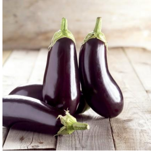
Resim 2.1: Kızartmalık patlıcan

Patlıcan Doğu Asya kökenli ve binlerce yıldır bilinen bir sebzedir. Aslında yabani bir sebze olan patlıcanın rengi genellikle maviden-mora döner. Ülkemizde çok tüketilen patlıcanın gıda sektöründe önemli bir yeri vardır. Yemeklik değeri yanında uzun yıllardan beri halk arasında ilaç olarak da kullanılmaktadır.