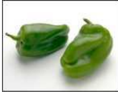
Resim1.3: Kandil dolma

Açık yeşil meyve rengi ve lezzeti ile sofralık kalitesi çok üstün olan standart bir çeşittir. Üç- dört loblu, ince kabuklu ve eti orta kalınlıktadır.