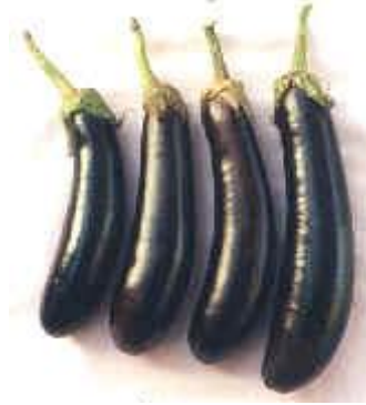
Resim 2.3: Pala 49

Meyve uzunluğu 22–30 cm, çapı 6-7 cm'dir. Kabuğu kuvvetli siyah-mor renkte, eti beyaz ve yumuşaktır. Meyvelerin sap tarafı biraz daha dar yapılı, uç kısmı ise daha dolgunca ve küt şekillidir. Sofralık ve sanayilik olarak değerlendirilir. Depolama ve nakliyeye dayanıklıdır.