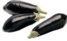
Resim 2.2: Aydın siyahı