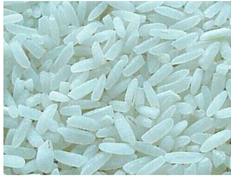
Resim1.4: Dolmalık pirinç