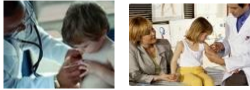
Resim 1.3: Pediatrik hasta muayenesi