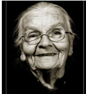
Resim 2.1: Geriatrik hasta