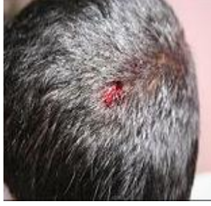
1.5: İstismarda fiziksel belirti