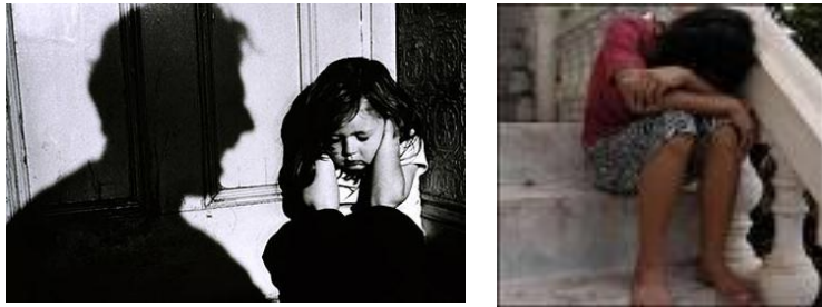
Resim 1.4: İstismara uğrayan çocuklarda duygusal belirtiler