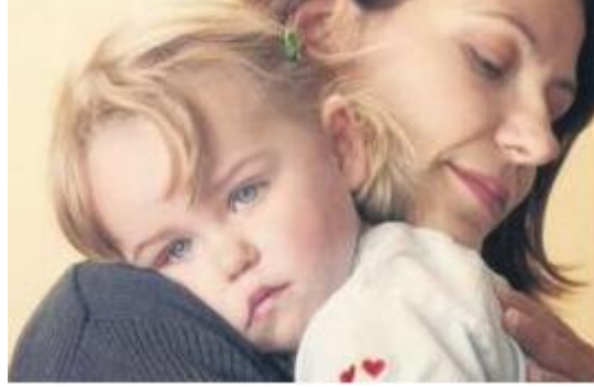
Resim 1.2: Çocukta güven duygusu oluşturma