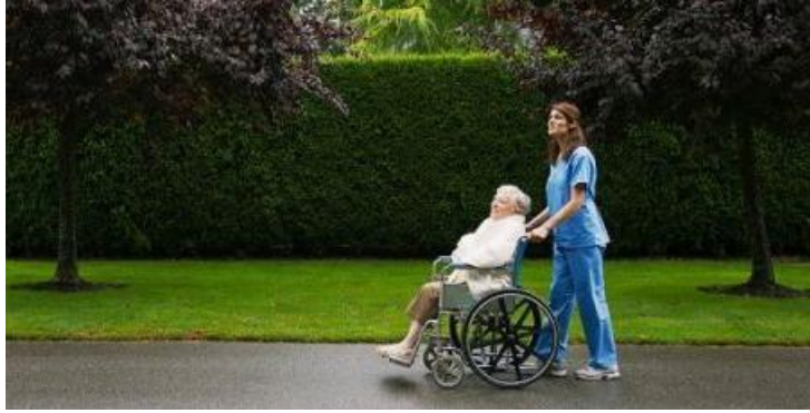
Resim 3.1: Sosyal hizmete muhtaç insan