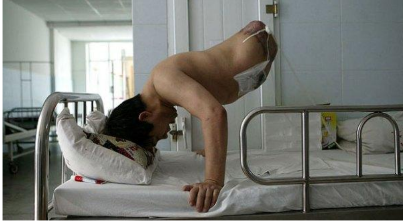
Resim 4.2: Ampute edilmiş hasta