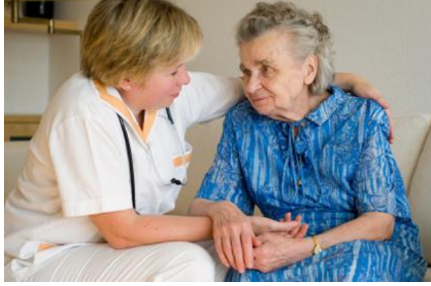
Resim 2.3: Geriatrik hastalara psikolojik yaklaşım