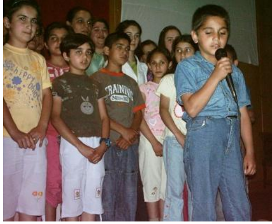
Resim 1.1: Çocukta kişilik ve sosyal gelişim

Bebeklik ve ön çocukluk dönemlerinde fiziksel gelişimin yanı sıra duygusal ve sosyal gelişim de hızlıdır. Çocuğun ilkokula başlamasıyla, sosyal gelişimi daha da hızlanır. Arkadaşları ve öğretmenlerinin çocuk üzerinde etkisi artarken ebeveynlerin etkisi azalmıştır. Yaptığı faaliyetlerde beğeni toplamak ister.