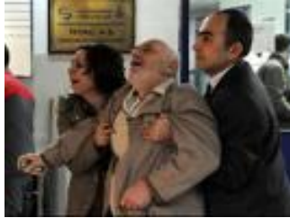
Resim 4.1: Ölüme hasta yakınlarının tepkisi

Hepimiz yaşantımızın bir diliminde uzaktan yakından sevdiklerimizi kaybetmişizdir. Her kayıp, acı verse de ölüm karşısında kendimizi çoğu zaman çaresiz hissederiz. Bu gerçeğe yüzleşmek, baş etmek onunla yaşamayı öğrenmek kolay olmayabilir. Ölüm karşısında dünyamız alt üst olur. Değerlerimiz, hedeflerimiz, beklentilerimiz karışır, duygularımızı taşıyamaz oluruz.