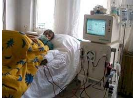
Resim 5.1: Kronik hasta