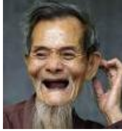
Resim 2.2: Geriatrik hastada psikolojik özellikler