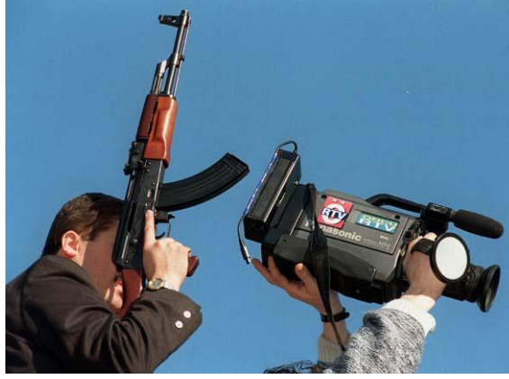
Fotoğraf 1.5: Gazetecilerin haber toplarken çeşitli zorluklarla karşılaşması

Haber kaynaklarının güvenilirliği açısından bir sorun da enformasyonun, haber kaynaklarınca yönlendirilerek verilmesidir. Haber yönlendirme; basın bültenleri, açıklamaları ve bildirimleri ile toplantı, konferans, turlar ve tanıtma çalışmalarında sürekli gündeme gelmektedir.