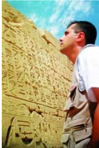
Fotoğraf 1.6: Luxor'daki ünlü Karnak Tapınağı'nda, Kadeş Savaşı'na ilişkin asılsız kahramanlık öykülerinin betimlendiği "gazete-duvarlar"dan biri...

(M. Önay'ın “İmaj Pazarlama” makalesinden alınmıştır.)