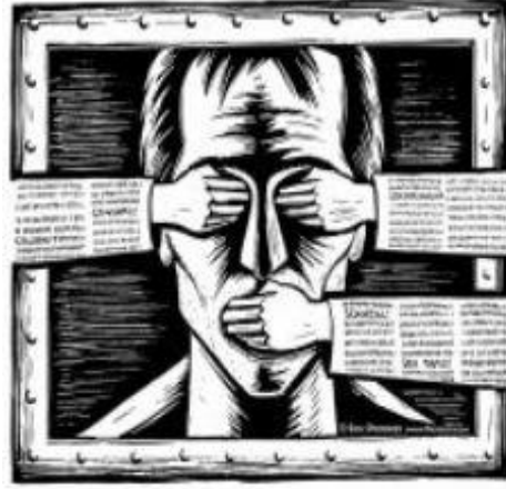
Resim 1.1: Sansür

Özgün bir mesajın tamamına ya da bir bölümüne el koymayı, düzenlemeyi ve manipülasyonunu içeren uygulamaya “ sansür ” denilmektedir.