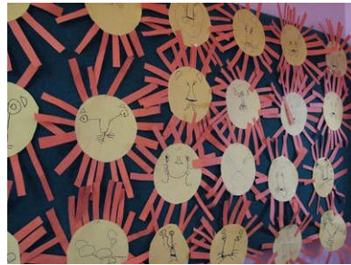
Resim 2.6: Anasınıflarında çocuklar planlı ve sistemli bir eğitim programı doğrultusunda yönlendirilirler.

Anasınıfları da anaokulları gibi çocukların tüm gelişimlerini planlı ve sistemli bir eğitim programı içerisinde yönlendirmektedir.