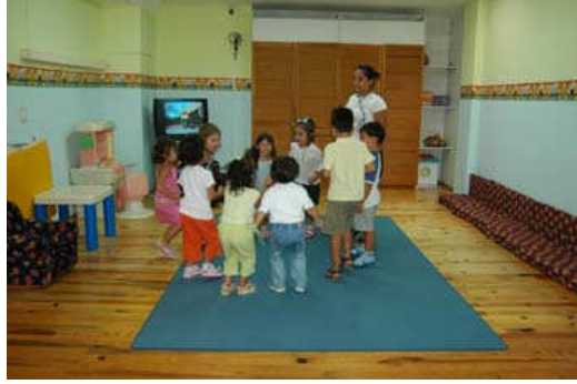
Resim 1.4: Erken çocukluk eğitimi çocukları ilköğretime hazırlar, sosyal uyumlarını artırır.