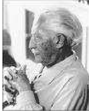
Resim 1. 10 : Erik Erikson çocuklukta kazanılan güven duygusunun ileriki yaşlarda çocukları olumlu yönde etkilediğini belirtmiştir.

I.ve II. Dünya Savaşlarından sonra, başta bulunan yöneticiler erken çocukluk eğitim kurumlarını, kimsesiz kalan çocukların olumsuz çevre koşullarından daha az etkilenmelerini sağlamak, endüstrinin gereksinimi olan kadın gücünden yararlanmak ve çocukluk yıllarındaki deneyimlerin, toplumsal yönelimler üzerinde etkili olduğunu kavramak gibi nedenlerle desteklemişlerdir.