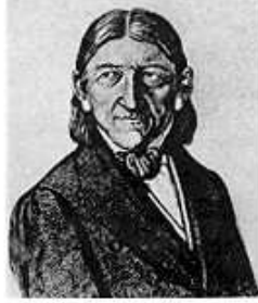
Resim 1. 5: Almanya’da ilk anaokulunu açan Friedrich Wilhelm Froebel

Froebel’in öğrencisi olan Carl Schurz da 1855 yılında Amerika’da, Elizabeth Peabody de 1860 yılında İngilizce konuşan çocuklar için özel bir okul açmıştır. Çocuk eğitimi konusunda büyük katkılarda bulunan İtalyan eğitimci Maria Montessori uzmanlık çalışmalarında, zihinsel engelli çocuklarla ilgilenmiş ve uyguladığı yöntemlerle büyük gelişmeler sağlamıştır. Montessori aynı yöntemlerle normal çocukların gelişiminde de daha iyi sonuçlar alınabileceğini savunmuştur. Roma’da 1907’de, kendi deyimiyle ilk çocuk evini açmıştır. Montessori, çocuğun doğumdan başlayarak “emici” zihinsel bir yeteneğe sahip olduğuna inanır. Erken çocukluk dönemini, zihnin büyük ölçüde alıcı olduğu kritik bir dönem olarak kabul eder. Bu süreçte çevrenin etkili olduğunu ifade eder.