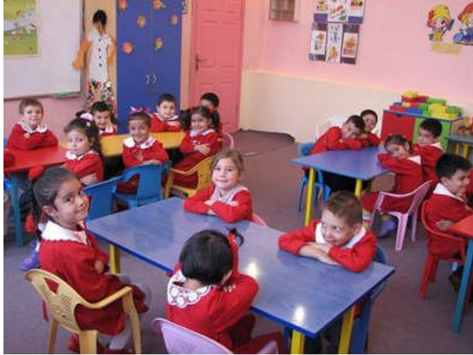
Resim 2.4:Anasınıfları ilkokulların bünyesinde yer alır.

Anasınıfları 61–72 ay ( 6 yaş ) çocukların eğitimlerini kapsayan kurumlardır.