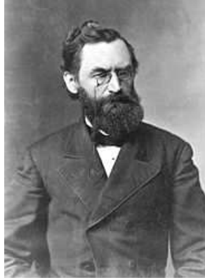
Resim 1. 6: Carl Schurz Amerika’da 1855 yılında İngilizce konuşan çocuklar için özel bir okul açmıştır.

Froebel’in öğrencisi olan Carl Schurz da 1855 yılında Amerika’da, Elizabeth Peabody de 1860 yılında İngilizce konuşan çocuklar için özel bir okul açmıştır. Çocuk eğitimi konusunda büyük katkılarda bulunan İtalyan eğitimci Maria Montessori uzmanlık çalışmalarında, zihinsel engelli çocuklarla ilgilenmiş ve uyguladığı yöntemlerle büyük gelişmeler sağlamıştır. Montessori aynı yöntemlerle normal çocukların gelişiminde de daha iyi sonuçlar alınabileceğini savunmuştur. Roma’da 1907’de, kendi deyimiyle ilk çocuk evini açmıştır. Montessori, çocuğun doğumdan başlayarak “emici” zihinsel bir yeteneğe sahip olduğuna inanır. Erken çocukluk dönemini, zihnin büyük ölçüde alıcı olduğu kritik bir dönem olarak kabul eder. Bu süreçte çevrenin etkili olduğunu ifade eder.