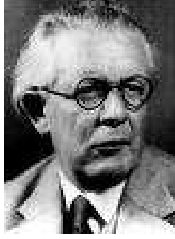
Resim 1.9: Piaget, çocuklarda zihinsel gelişimi incelemiştir.

Çocuğun zihinsel gelişimini inceleyen Piaget, yaptığı çalışmalarda, özellikle çocuk gelişiminde fiziksel olgunlaşma kadar çevrenin, deneyimlerinin, toplumsal aktarımların da etkili olduğunu ifade etmiştir.