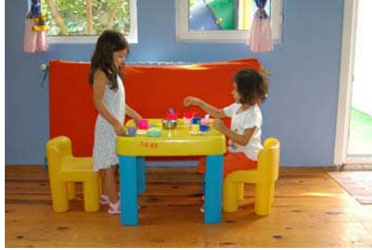
Resim 1.1: Erken çocukluk eğitim kurumları çocukların kendilerini rahatça ifade etmelerine olanak tanır.

Erken çocukluk eğitimi, çocuğun çevresindeki kişilerle sağlıklı iletişim kurmasına, duygu ve düşüncelerini karşısındakine rahatlıkla ifade edebilmesine fırsat vererek dil becerilerini geliştirir.