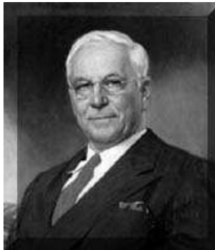
Resim 1. 8: Arnold Gesell, çocuklardaki, fiziksel ve motor gelişim aşamalarına dikkati çekmiştir.