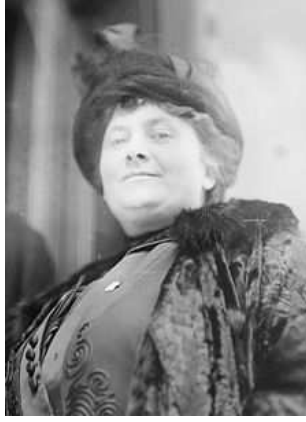
Resim 1.7: Maria Montessori Roma’da kendi deyimiyle “ilk çocuk” evini açmıştır.