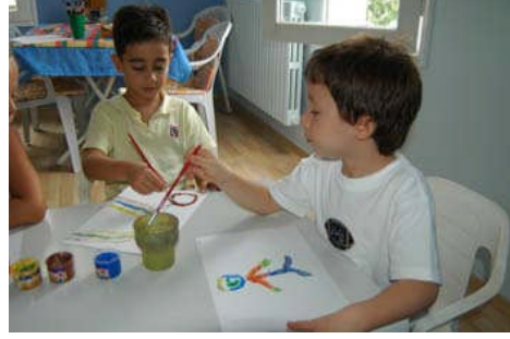
Resim 1.2: Çocuklar erken çocukluk eğitim kurumlarında verilen eğitimle yeteneklerini ve ilgi alanlarını fark eder ve geliştirirler.