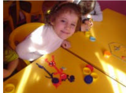
Resim 2.3: Anaokullarında, çocuklar grup halinde veya bireysel olarak çalışabilirler.

Anaokullarında, çocuğun bakımı ve korunmasına olduğu kadar, sosyal ve zihinsel gelişimlerine de ağırlık verilmektedir. Anaokulu etkinlikleri sabah ve öğleden sonra değişik çocuk gruplarına ya da tek bir gruba tam gün boyunca hizmet verilecek şekilde planlanarak