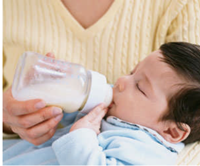
Resim 2.2: Kreşler çocukların bakım ve beslenme ihtiyaçlarını karşılar, bedensel ve ruhsal gelişimlerini destekler.

Kreşlerde sorumluluk başta öğretmen olmak üzere görevli personele düşmektedir. Çocuklar yaşamlarının ilk iki yılında temel güven duygusunu kazanırlar. Bu nedenle bu yaşlar kritik bir dönem olma özelliği taşıdığından kreşler, yalnızca bakım yeri olarak değil, bakım ve eğitimin bir arada verildiği yerler olarak değerlendirilmelidir.