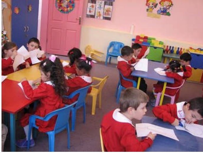
Resim 2.5: Anasınıfları, geri sosyoekonomik çevre koşullarından gelen çocukların eğitiminde önemli yer tutar.