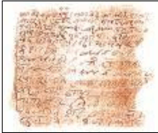
Resim 1.4: Orijinal parşömen

Papirüs kağıdı devrini, Batı Anadolu'daki Bergama şehri uygarlığının bir ürünü olan Parşömen izlemiştir. Pergament veya parşömen, hayvan derilerinin terbiye edilmesi, parlatılması ve mürekkep kabul edecek hale getirilmesiyle elde edilen bir yazı malzemesidir.