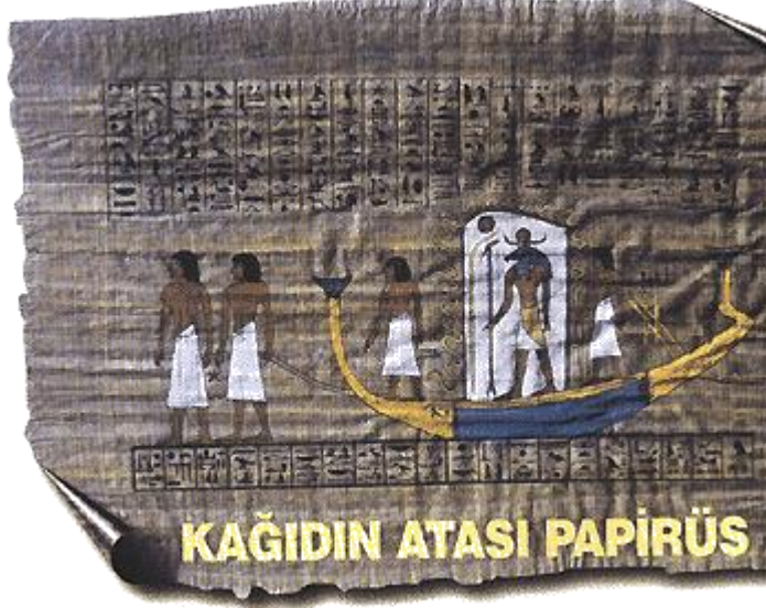
Resim 1.3: Kağıdın atası sayılan papirüs

Kağıdın ilkel şekli Papirüs'tür. Eski Mısırlılar MÖ 2000 yılından itibaren "Cyperus Papyrus" denen kamış cinsi bitkiden, üzerine resim-yazı yazılan ince tabakalar yapmışlardır.