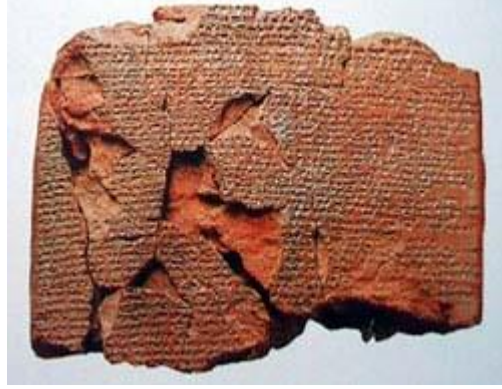
Resim 1.2:Kadeş Antlaşması'nın bir parçası. MÖ XIII. yüzyıla ait bu anlaşma, dünyanın bilinen ilk yazılı barış antlaşmasıdır.