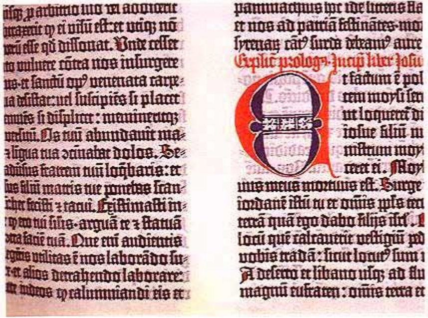
Resim 1.7:Matbaada ilk basılan eserlere örnek

Çalışmalar bu şekilde gelişirken ortaklardan biri ölmüş, bunun yerine gelen mirasçı, Gutenberg'i gizli çalışmalarla suçlayarak mahkemenen şirketin feshi kararını almıştır. Bu nedenle Gutenberg'in bütün emekleri boşa gitmiş ve araçları elinden alındığından Mainz şehrine dönmek zorunda kalmıştır. Burada zengin bir kuyumcu olan Johann Faust'u tanımış, Faust'un damadı olan el yazmaları ustası Peter Shöffer ile birlikte üçlü, yeni bir şirket daha kurmuştur.