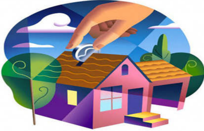
Resim 2.3: Artırımın değerlendirilmesi