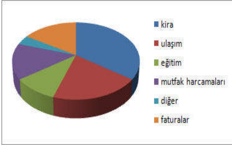
Resim 1.9: Bütçede belirtilen gider grupları

hizmet, servis ve mallar belli başlıklar altında gruplandırılabilir. Bu gruplandırma ailelerin özel durumlarına göre farklılıklar gösterebilir. Böylece aile, tüketim alanları için belirli sürede ne kadar harcama yaptığını açıkça görecektir ve başka alanlara yapılan harcamalarla bunu karşılaştırabilecektir.