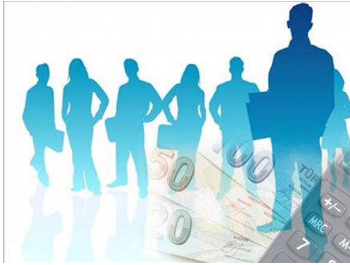
Resim 1.3: Genel bütçe

Kapsadığı konuya göre bütçe türlerinde gelir ve gider toplamı, bütçe konusu için ayrılan miktarla denk gelecek şekilde harcamalar tahmini olarak belirtilir. Gerçek harcamalar toplamının tahmini harcamalar toplamına eşit olduğu veya ayrılan miktarlardan artırım sağlandığı görülürse hazırlanan bütçenin olumlu olarak uygulandığı söylenebilir. Aksine gerçek harcamalar toplamı tahmini harcamalardan fazla ise bütçede o fazlalık kadar bir açık var demektir.