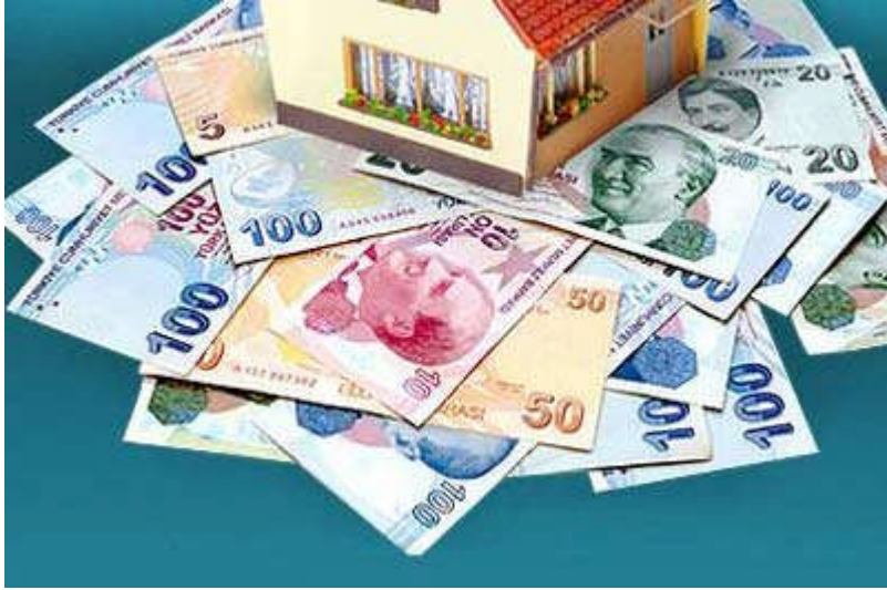
Resim 1.10: Ailenin beklenen toplam geliri