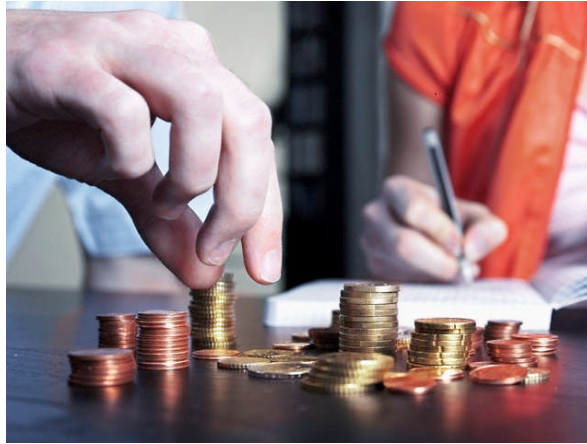
Resim 1.6: Bütçe planlama