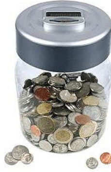
Resim 2.2: Artırım

Aile gelirinin tüketilmeyen kısmına artırım denir. Artırılan para, gelecekte beklenmedik durumda ve sosyal yaşamda meydana gelebilecek deęişiklikleri karřılamak için ayrılan miktardır. Gelirlerinin tümünü tüketmeyen aileler, belli bir süre sonunda daha iyi bir statüye ulařırlar. Çünkü o dönemde elde ettięi gelirin bir kısmını artırarak önceden sahip olduęu maddi kaynaklara bunu eklemiş olurlar. Bir ailenin artırım miktarı, o ailenin artırım yeteneęine ve artırım yapma arzusuna baęlıdır.