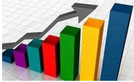
Resim 2.1: Açık bütçe

Ailede giderlerinin gelirden fazla olması durumunda açık bütçe oluşur. Yani borçlu olma durumu meydana gelir. Bütçenin açık vermemesi için iyi bir planlama esastır. Aile bütçe planının ailenin tüm bireyleri tarafından kabullenilmesi ve plana göre hareket edilmesi başarı şansını artırır. Bütçede açık vermek yani borçlu olma durumu kişilerin kendine güvensizliğine, mutsuz olmasına ve aile içi sorunların artmasına neden olur.