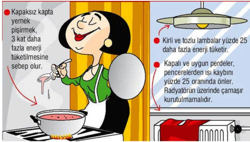
Resim 1.2: Ailede enerji tasarrufu

Aile bütçesi ise bir ailenin gelir ve giderini ve buna göre yaşam standardının oluşturulmasını konu alan bütçedir. Bir aile bütçesi yapılırken aylık ya da yıllık gelir temel alınarak giderler (kira, beslenme, giyim, ulaşım, eğitim, sağlık, tatil giderleri vb.) buna göre belirlenir. İster aile ister şirket ister devlet bütçesi olsun bütçe her zaman yaşamsal önem taşır ve insanların yaşamını temelden etkiler. Bir ailenin, şirketin ya da devletin iyi yönetilip yönetilmediği bütçesine bakılarak anlaşılabilir. Aile bireylerinin sağlık, beslenme ve eğitim gereksinimlerine az para ayıran, gösterişe yönelik harcamalara öncelik tanıyan bir aile bütçesinde doğru önceliklerin seçildiği söylenemez.