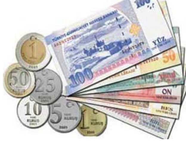
Resim 1.7: Tahmini gelir