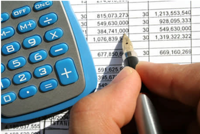
Resim 1.1: Bütçe

Bütçe, belli bir döneme ait yapılacak giderleri ve elde edilecek gelirleri tahmini olarak gösterir. Bütçe ekonomik, mali, siyasi ve hukuki sonuçlar yaratır. Bütçenin dikkatli kullanılması ile millî gelir, gelir dağılımı, ekonomik kalkınma, ekonomik ve sosyal sorunların giderilmesi vb. üzerinde olumlu etkiler görülür.