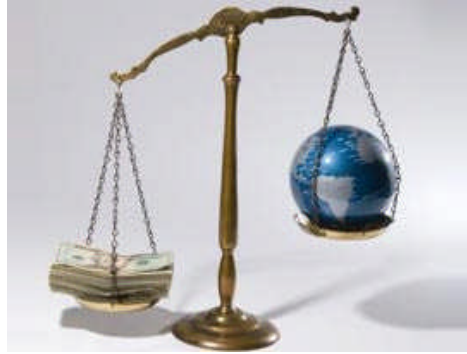
Resim 1.5: Denk bütçe