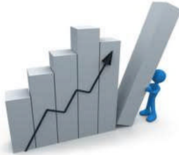
Resim 1.4: Açık bütçe