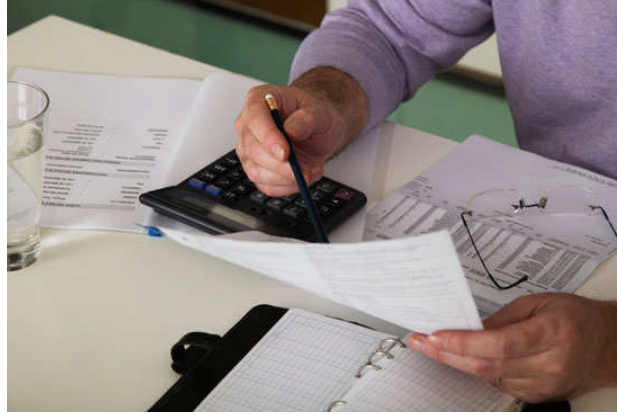
Resim 1.8: Gelir gider analizi

Bütçe hazırlamada gelir ile gider arasında denge kurmak oldukça önemlidir. Giderleri gelire göre düzenlemek ve gelir ile tahmini gider arasında denklik sağlamak demektir. Gider gelirden fazlaysa gideri kısıtlamak veya başka gelir kaynakları bulmak gerekir. Kısıtlamalar tümüyle bütün harcamalarda yapılabileceği gibi zorunlu gereksinimler dışındaki tüketim alanlarında daha başarılı olur.