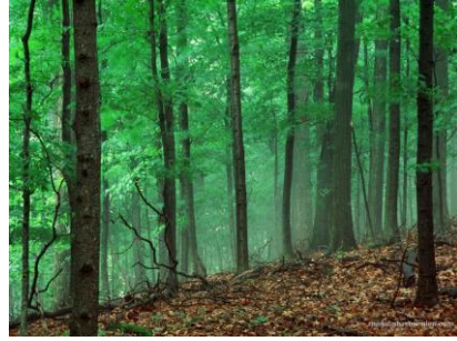
Resim 1.4: Kamu malı (orman)