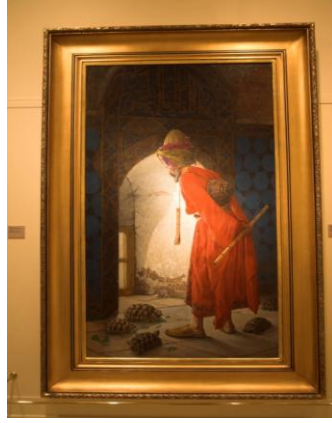
Resim 1.1: Gayri-misli eşya