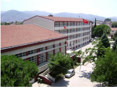
Resim 1.3: Kamu malı (okul)

Özel mallar, özel veya özel hukuk tüzel kişilerinin mülkiyetinde bulunan eşyalardır. Bu eşyalar, kimin mülkiyeti altında ise bunlardan prensip olarak sadece o şahıslar faydalanır.