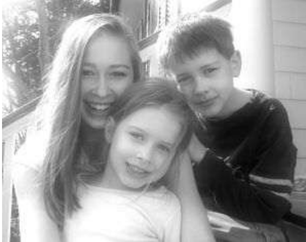
Resim 1.16: Kardeşler arasında anlaşmazlıkların olması normaldir.

Kardeşler arasında anlaşmazlıkların olması normaldir. Yetişkinler nedenini bilmedikleri tartışmaların içine girmemeli ve taraf olmamalıdır. Çocuklar; anne-babadan yardım alamayacağını, tartışma konusunu kendilerinin çözmeleri gerektiğini bilmelidir. Çocuklardan birinin korunması hâlinde diğer çocukta kardeşine ve anne-babasına karşı öfke ve düşmanca duygular oluşabilir.