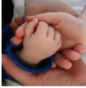
Resim 2.5: Çocuğa dokunmak ona gösterilen sevginin en iyi ifade şeklidir.

Bağımlılıktan bağımsızlığa geçiş döneminde çocuğun ebeveynlerine ihtiyacı vardır. Yetişkinlerin çocuğun kendi kendine yapabileceği her etkinliği desteklediği, çocuğun seçimlerine fırsat verdiği, onu yüreklendirdiği ve karşılaştığı problemlere yardımcı olduğu sürece çocukların bağımsızlık duygusunun geliştiği görülür.