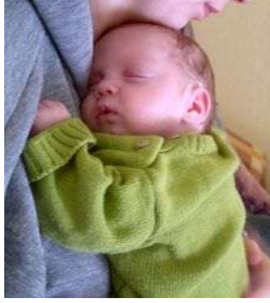
Resim 2. 1: Sevgi gereksinimi ömür boyu sürer ve sürekli doyurulması gerekir.

Çocuk yetiştirmede dikkat edilecek diğer bir unsur disiplindir. Dengeli ve düzenli bir aile yapısı oluşturmada disiplinin önemi büyüktür. Disiplin, kişilerin içinde yaşadıkları toplumun genel düşünce ve davranışlarına uyum sağlamak amacıyla alınan önlemlerin tümü olarak tanımlanabilir. Aile içinde etkili bir disiplin oluşturabilmek için aile bireylerinin özgürlük sınırlarını bilmeleri gerekir. Disiplin, kişinin kendisiyle başlar. Disiplinin amacı düzenli, tutarlı ve sorumlu davranış alışkanlıkları kazandırmak olmalıdır. Aşırı hoşgörü ve disiplin eksikliği çocukta bencillik ve antisosyal davranışların ortaya çıkmasına; aşırı otoriter ve baskılı katı disiplin de anne-babaya karşı korku, nefret ve öfke duygularının oluşmasına çocuğun bağımlı ve isyankâr olmasına neden olabilir.