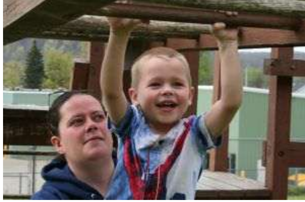
Resim 1.11: Çocuğu cesaretlendirmek öz güveninin gelişiminde son derece önemlidir.

Anne ya da babanın -tamamen bilinç dışı- çocuğa aşırı düşkünlük göstermesi hem aile hayatının mutluluğunu bozabilir hem de çocuğu olumsuz etkileyebilir. Yine anne-babanın gerçekleştiremedikleri bilinç dışı istek ve davranışlarını çocuklara yansıtmaları sonucu çocuğun kişilik özellikleri; ilgi, istek ve yetenekleri göz ardı edilerek yönlendirilmesi çocukta olumsuz duygu ve davranışlara yol açabilir. Çocuğun benlik saygısı; düşüncelerinin önemsendiği, sözlerinin dinlendiği, destek ve değer gördüğü bir aile ortamında gelişebilir.