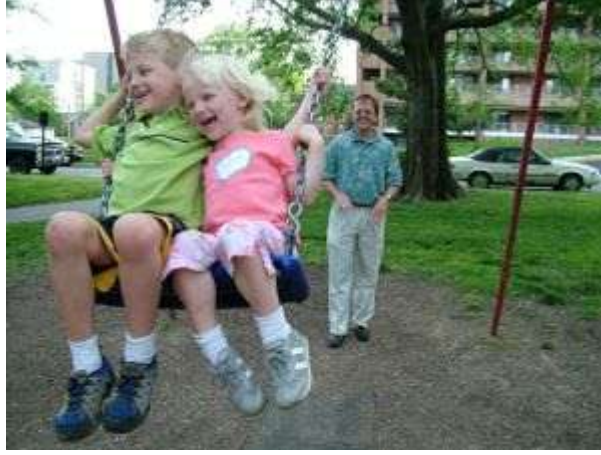
Resim 1.15: Çocuk, anne ve babasının varlığını her an yanında ya da arkasında hissetmek ister.

Çocuklar küçükken bu davranışlardan kurtulamazlarsa ileriki yaşamlarında da ciddi problemlerle karşılaşır. Anne-babaların çocuklara yaklaşımlarının farklı olması kardeşler arası ilişkileri etkileyecektir. Çocuklarına adil davranan anne-babalar onların daha dengeli ve olumlu ilişki içinde olmalarına yardımcı olur. Kardeş ilişkilerinde karşılıklı sevgi, saygı ve sorumluluk olmalıdır.