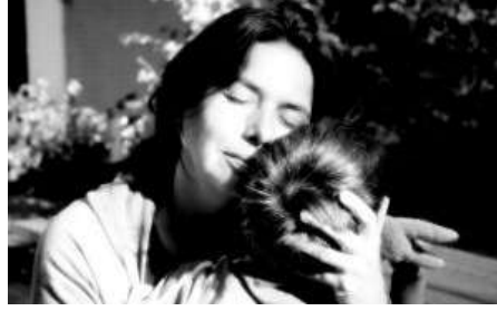
Resim 1.6: Çocuk onaylandığını bilmek ister.