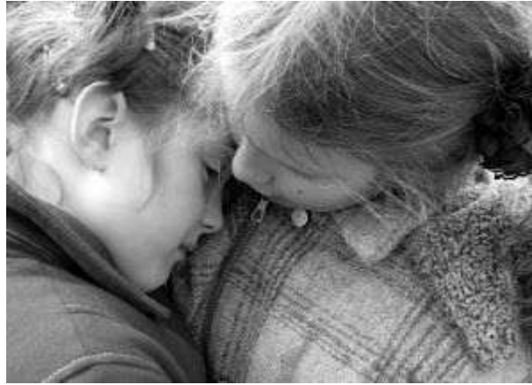
Resim 1.14: Kardeşlik bağı, bir sevgi kaynağıdır.

Kardeşlerin olumlu ilişki kurabilmesi için iletişimi engelleyebilecek etkenlerin bilinmesi gerekir. Kardeşler arasındaki iletişim ; kıskançlık, saldırganlık, bencillik vb. gibi davranışlarla bozulur.