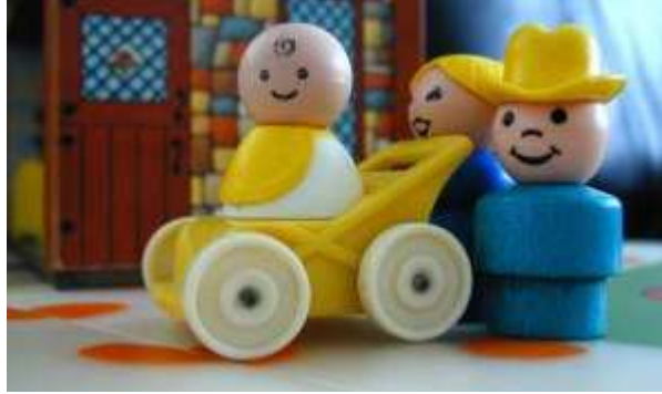
Resim 1.9: Çocuk sahibi olmak toplum hayatını sürdürmek açısından önemlidir.

Aile içi ilişkilerde tartışmaların olması doğaldır. Anlaşmazlıkların ve tartışmaların nasıl sonuçlandığı çok önemlidir. İletişim bozukluğundan en fazla çocuklar etkilenir. Çocuk; anne ve babasının problemlerini tartışarak olumlu bir şekilde çözdüklerine tanık olunca ileride kendi yaşamında karşılaşılabileceği problemlere hazırlanma fırsatı bulur. Eşler arasındaki ilişkinin çocuklar üzerinde kalıcı etkileri vardır.