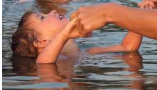
Resim 2.4: Çocuğun anne ve babasına olan ihtiyacı yaş dönemlerine göre farklılık gösterir.

Doğumla birlikte anne ve çocuk arasındaki fiziksel bağ kesilir fakat duygusal bağ hiç kopmaz ve ömür boyu sürer. Çocuğun yaşamını devam ettirebilmesi için annenin ilgisine ve bakımına ihtiyacı vardır. Çocuk anneye tam anlamıyla bağımlıdır. Zamanla çocuk kendi ihtiyaçlarını karşılama becerisi kazandıkça bu bağımlılık azalır ve çocuk büyüdükçe yok olması beklenir fakat bazı anneler çocuklarının bağımlılıklarından zevk duyar ve çocuklarının sorumluluklarını da kendileri üstlenirler. Bu durumdan çocuk çok zarar görür. Kendi kendine yetmeyen, kendi ayaklarının üzerinde duramayan bireyler olarak yetişir. Anne-babanın olmadığı durumlarda çocuk ne yapacağını bilemez, hayatını düzene sokamaz. Çocuğun böyle bir duruma düşmemesi için doğumdan itibaren anne-babasının davranış ve yaklaşımları çocuğa bağımsızlığını kazandıracak nitelikte olmalıdır.