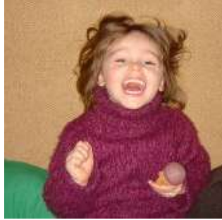
Resim 1.7: Karşılıklı sevgi ve hoşgörü aile içi ilişkileri güçlendirir.

Ailede bulunan bireylerin iletişimi, onların ruh sağlığını önemli oranda etkiler. Çocukların sağlıklı kişilik gelişimlerini aile içindeki ilişkiler oluşturacaktır. Karşılıklı saygı, sevgi, hoşgörü ve fedakârlığa dayanan ilişkilerle yetişen çocuklar sağlıklı kişilik geliştirirler.