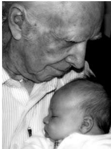
Resim 2.6: Yeterli sevgi ile büyüyen çocuğun bağımsızlık duygusu gelişir.

Hor görme, cezalandırma, aşırı sevgi ve koruma çocuğun gelişimini, başarısını ve topluma uyum sağlamasını engeller. Sağlıklı toplumlar, bireylerin ruh sağlığının korunmasıyla oluşabilir. Yeterli sevgi görerek, bağımsızlığı desteklenerek yetişen bireyler sağlıklı toplumların temelini oluştururlar.