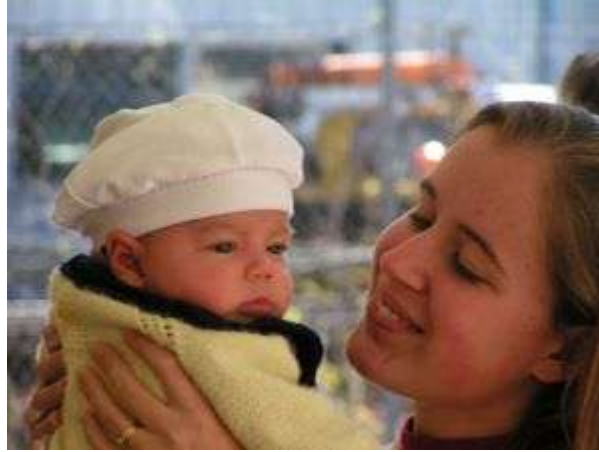
Resim 1.10: Sevginin devamlılığı çocuk açısından çok önemlidir.

Çocuk, hayata ilişkin bilgi ve becerileri anne-babasından öğrenir. Anne-babanın çocuğa karşı takındıkları tavır, bebeklik döneminden itibaren çocuk üzerinde derin ve kalıcı izler bırakır. Çocuğa anne-babanın gösterdiği dengeli sevgi ve koruma duygusu, çocukta güven duygusunun gelişimine yardımcı olur. Çocuk böylece insanları sevmeyi, onlarla ilişki kurmayı öğrenir.