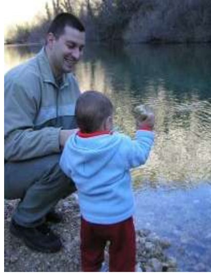
Resim 1.4: Çocuğun güvenli ortamda kişiliği gelişebilir.

İnsanların görevlerinden biri türünün devamını sağlamak amacıyla çocuk yetiştirmektir. Bunu yapabilmesi için bazı koşulların uygun olması gerekir. Öncelikle anne-baba adaylarının sağlıklı ve uyumlu bir ilişki içinde olmaları gerekir. Ailenin bakabileceği kadar çocuğa sahip olmaları da çok önemlidir. Eşlerin evlenirken dikkat etmeleri gereken bazı faktörler vardır. Bunlar: