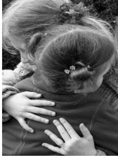
Resim 1.13: Kardeş ilişkilerinde karşılıklı sevgi, saygı ve sorumluluk olmalıdır.

Kardeşlik bağı, bir sevgi kaynağıdır. Kardeşler arasında zaman zaman rekabet ve problemler söz konusu olabilir. Kardeşler, aralarında iyi ilişkiler kurmada ve bunu sürdürmede zorluklar yaşayabilir ama zamanla sorunların üstesinden birlikte gelebilirler.