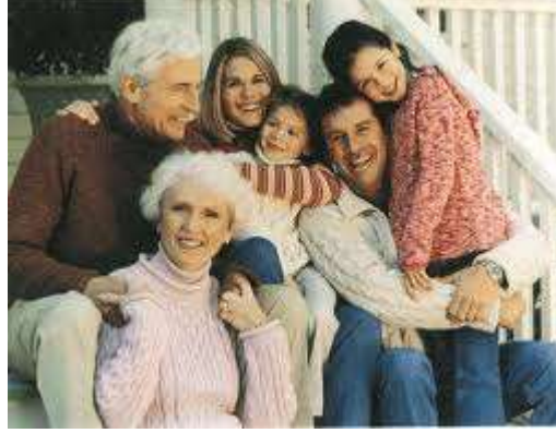
Resim 1.3: Geniş aile