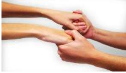
Resim 1.5: Başarılı anne-baba olma eşler arasında uyumlu ilişkiler kurmakla başlar.

Çocuklar uyumlu ve güvenli bir aile ortamında kişiliklerini sağlıklı bir şekilde geliştirme olanağı bulurlar. Çocuk, anne ve babanın birbirine karşı sevgi ve bağlılığını gördükçe ruh sağlığı yerinde bir birey olarak yaşama hazırlanır.