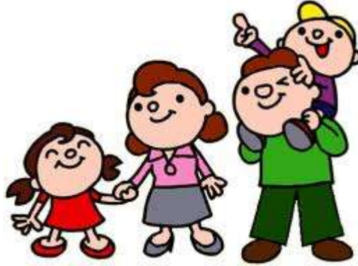
Resim 1.1: Aile toplumun yapı taşıdır.

Özellikle kırsal kesimde geleneklerin ağır bastığı geniş aile tipi yaygındır. Erkeğin egemen olduğu bu aile ortamında üretim ve tüketim faaliyetleri hep birlikte yapılır. Geniş ailede yetki erkekte, sorumluluk ise kadındadır. Aile düzeni büyüklerin deneyimleri ve kararları doğrultusunda kurulur ve sürdürülür. Eşler, çocuk eğitimi konusunda tek başlarına sahibi olmayabilirler.