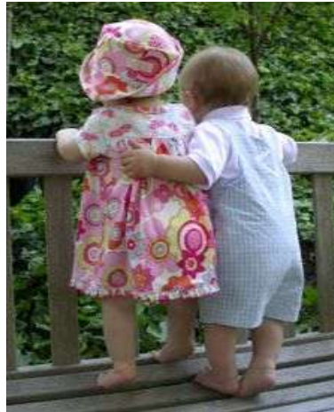
Resim 3.2: Çocuklar arasında cinsiyet ayrımı yapılması çatışmalara neden olur.

Geleneksel aile yapısında toprak bütünlüğünün bozulmaması, soyadının devamı, sosyal statü, mirasın bölünmemesi gibi kaygılarla erkek çocuk edinme isteği çok fazladır. Günümüzde de kırsal kesimde geleneksel aile yapısı devam eden bölgelerde erkek çocuk sahibi olma isteği hâlâ devam etmektedir. Bu istek çok çocuk sahibi olma nedenleri arasında yer almaktadır ancak günümüzde kent yaşamı içinde ailelerin kültürel yapılarının değişmesi, sosyoekonomik durumları ve eğitim düzeyleri yeni kuşak anne-babaların bu düşüncesinin değişmesine neden olmaktadır. Erkek çocuklara geleneksel aile yapısında maddi-manevi tüm olanaklar, en üst düzeyde ve öncelikli sunulurken günümüz aile yapısında çocuklara cinsiyet olarak değil birey olarak yaklaşılmaktadır. Ailede çocuklar arasında yapılan cinsiyet ayrımı kız çocuklarında duyguların bastırılması ve değersizlik duygularına neden olurken erkek çocuklarında üstün cinsiyet, hükmetme ve çalışma isteğinin azalması gibi olumsuz davranışlar gelişmesine neden olmaktadır. Bu tutumların var olduğu ailelerde yetişen çocuklar yetişkin olduklarında kendilerine farkında olunmadan kazandırılan olumsuz tavırlar sergilerler.