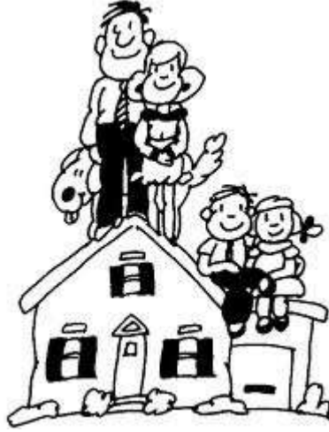
Resim 1.2: Çocuk sevgiyi gördükçe öğrenebilir.

yasalarla da belirlenen görev ve sorumlulukları vardır. Aile içinde bulunduğu toplumun değer yargılarını kültürünü, gelenek ve göreneklerini yansıtan ayrıca kendi içinde özel bir düzeni olan, çevresiyle iletişim içerisinde olan bir kurum olarak tanımlanabilir. Aile, çocuğun ilk sosyal deneyimlerini kazandığı yerdir. Çocukların gelişiminde aile yol gösterici ve kuralları öğretici rol oynar. Çocuğun doğru ve yanlış öğrenmesinde, cinsel kimliğini kazanmasında, davranışlarını kontrol etmesinde, ailenin rolü çok büyüktür. Aile içinde sadece anne ve babanın görev ve sorumlulukları yoktur. Çocuklar da yaş, cinsiyet, kişilik ve yetenekleri doğrultusunda görev almalıdır.