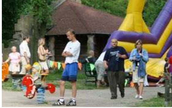
Resim 2. 2: Çocuğu ödüllendirmek onun istendik davranışları kazanabilmesinde son derece önemlidir.

Çocuk yetiştirmede dikkat edilecek diğer bir unsur disiplindir. Dengeli ve düzenli bir aile yapısı oluşturmada disiplinin önemi büyüktür. Disiplin, kişilerin içinde yaşadıkları toplumun genel düşünce ve davranışlarına uyum sağlamak amacıyla alınan önlemlerin tümü olarak tanımlanabilir. Aile içinde etkili bir disiplin oluşturabilmek için aile bireylerinin özgürlük sınırlarını bilmeleri gerekir. Disiplin, kişinin kendisiyle başlar. Disiplinin amacı düzenli, tutarlı ve sorumlu davranış alışkanlıkları kazandırmak olmalıdır. Aşırı hoşgörü ve disiplin eksikliği çocukta bencillik ve antisosyal davranışların ortaya çıkmasına; aşırı otoriter ve baskılı katı disiplin de anne-babaya karşı korku, nefret ve öfke duygularının oluşmasına çocuğun bağımlı ve isyankâr olmasına neden olabilir.