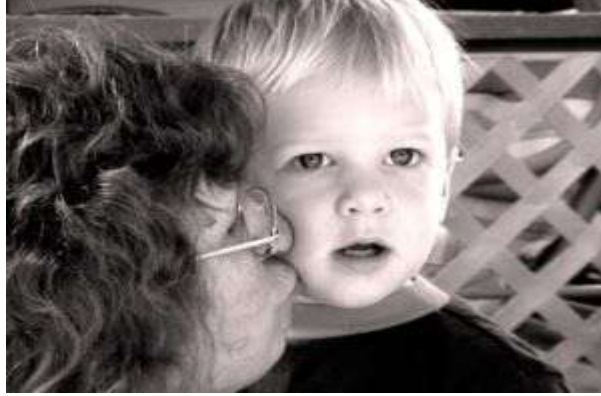
Resim 1.17: Ailede yaşayan diğer bireyler önemli bir yer tutar.

Ailede yaşayan diğer bireyler de aile içinde önemli bir yer tutar. Kentsel yaşamda bu tip aile yapısına çok az rastlanmakla birlikte kırsal kesimde daha çok görülmektedir. Özellikle dede ve nineler geniş ailede en çok bulunan bireylerdir. Çocukların dede-ninelerinden gördükleri sevgi ve ilginin anne-babalarından gördüklerinden daha çok olduğu gözlenmektedir. Bu sevgi bazen hoşgörü sınırlarını aşarak anne-babaları zor durumda bırakabilir. Bunun altında yatan neden kendi çocuklarını büyütürken düştükleri hatalardan rahatsızlık duymalarıdır. Bu yüzden anne-babaları sıkça uyarırlar. Yaptıkları her şey çocukların hoşuna gider. Çalışmadıkları için torunlarına daha çok zaman ayırabilirler. Anne-babaların yetiştirme tarzına ters düşen davranışlardan rahatsız olmadıkları için ailede bulunan diğer bireylerle çatışmalar yaşanabilir.