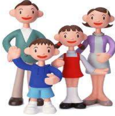
Resim 1.8: Eşler arasındaki ilişkilerin çocuklar üzerinde önemli etkisi vardır.

Evlilikte önemli olan kişiliklerdeki ayrılıklar değil, beklentilerdeki ortaklıktır. Eşlerin birbirlerini sevmeleri, saymaları, birbirlerine güven duymaları; özenli, duyarlı, hoşgörülü, paylaşımcı davranmaları evlilik bağına güçlendirir.