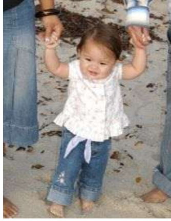
Resim 2.3: Çocukta güven duygusu erken dönemlerde gelişir.

Ancak aşırı demokratik tutumlar çocukta her alanda sınırsız özgürlük, her istediğini yapma gibi bir anlayışın gelişmesine neden olabilir. Demokratik tutum aynı zamanda başkalarının özgürlüğüne saygı, dürüst olma ve bazı durumlarda çoğul düşünebilme davranışlarının oluşturulmasını da sağlayabilecek şekilde dengelenmelidir. Güven verici ve destekleyici tutumun dengeli verildiği ailede büyüyen çocuklar katılımcı, kendilerini kolay ifade eden ve toplumsal problemlere duyarlı yetişkinler olurlar.