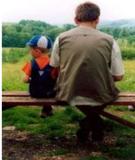
Resim 1. 12: Çocuk anne ve babasını taklit ederek sosyal yaşama alıştır.

Anne-babaların çocuğu korkutmadan işbirliğine dayalı, sağlıklı bir iletişim ortamı hazırlamaları; çocukların olumlu düşünen, uyumlu, yaratıcı kendi kendini kontrol edebilen bireyler olmalarını sağlar.