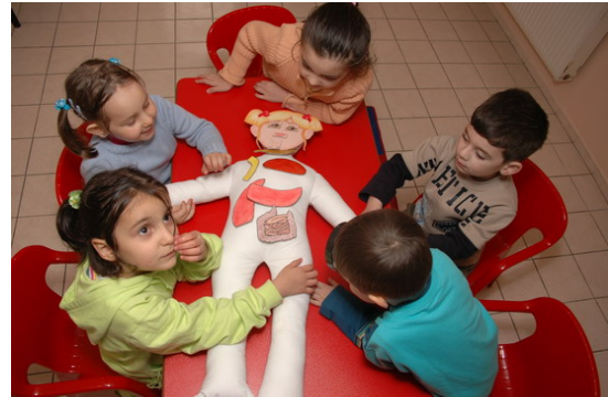
Resim 2.3. Tüm hazırlıklar tamamlandıktan sonra aktiviteler uygulanır