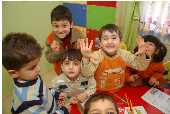
Resim 2.5. Organizasyon bitiminde çocuklar toplanır

Alanın birlikte toplanıp temizlenmesi çocuklarda çevreyi koruma bilinci oluşturulması açısından da yararlı olacaktır. Ancak çocuklar her türlü malzemeyi toplayıp kaldıramazlar. Burada animatörler devreye girerek çocuklara güçlerine göre görevler verebilirler.