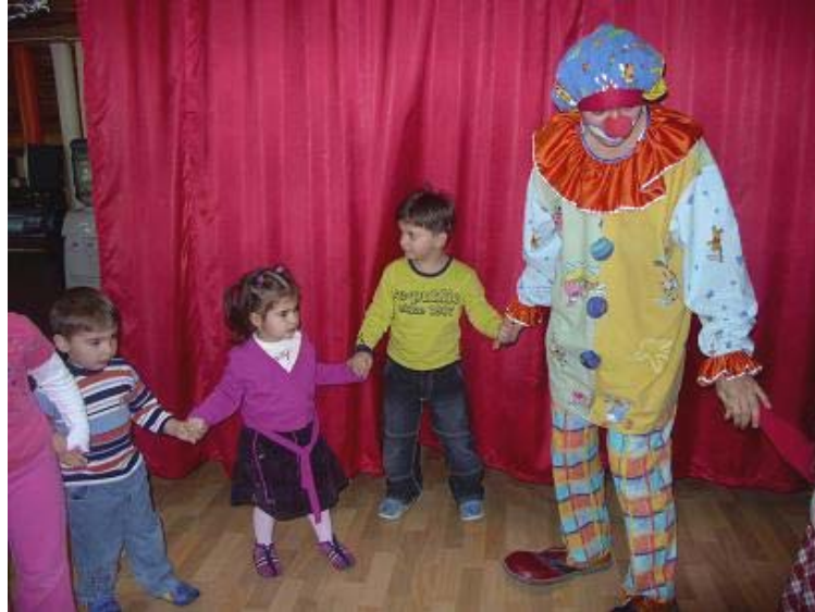
Resim 1.2. Çocuklar eğlenirken daha çabuk öğrenir.

Özel temalı günlerin genel amacı belli bir konu doğrultusunda çocukların eğlenmesini ve öğrenmesini sağlamaktır. Daha önce de değindiğimiz gibi çocukların eğitiminde eğlencenin yeri büyüktür. Çünkü çocuklar çevrelerinde olup biten olayları eğlenceli yönüyle algılamak isterler. Bu durum onların öğrenmelerini kolaylaştırır.