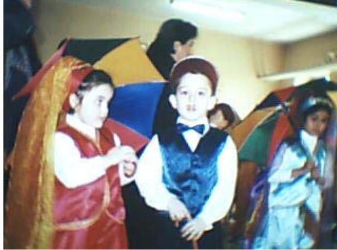
Resim 1.5. Aktiviteler çocukların cinsel rollerini kazanmalarına yardımcı olur

Ulaşılmak istenen amaçlardan biri de çocukların cinsel rollerini öğrenmeleridir. Aktiviteler toplu olacağından çocuk karşı cins ve hemcinslerini tanıyıp mukayese etme imkânı bulur. Arkadaş grubunu belirlerken cinsiyet faktörünün önemini algılar. Bu da çocuğun cinsel rolünün belirginleşmesini, cinsiyetine uygun davranışlar sergileyebilmesini sağlar.