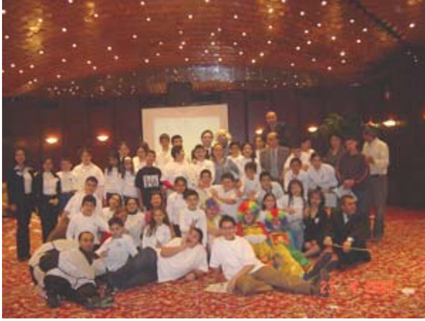
Resim1. 3 :Partiler çocukların sosyalleşmesini sağlar.

Yapılan özel temalı programların diğer bir amacı ise çocukları sosyalleştirmektir. Düzenlenen toplu programlarda çocuklar birbirleriyle kaynaşarak sosyal hayata hazırlanır. Çocuk kendini ifade edebileceği bir ortam bulur ve toplumdaki yerini, rolünü belirlemeye çalışır. Daha önceden hazırlanmış aktivitelerle bu süreç hızlandırılır ve çocuğun hızlı bir şekilde sosyalleşmesi sağlanır.