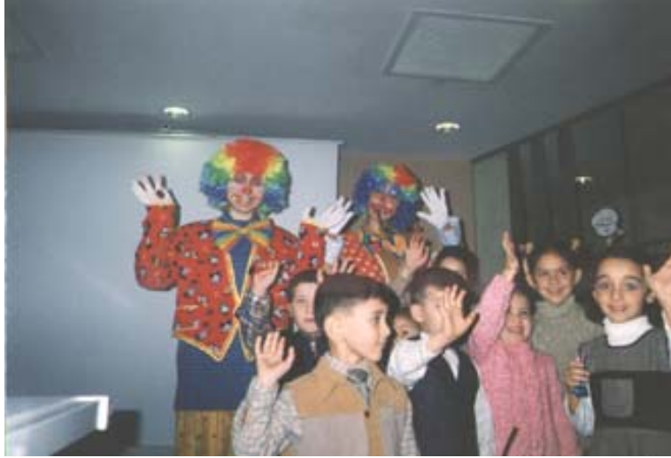
Resim 2.2. Katılımcıları bir araya toplamak için animatörler farklı yöntemler kullanırlar

Planlanan organizasyonla ilgili duyurular önceden yapılacağı için katılımcılar aktiviteler hakkında önceden bilgi sahibi olacaklardır. Organizasyonun başlama saatinden önce animatörler katılımcıları toplamak için duyurularına devam ederler. Organizasyon tesis dışında gerçekleştirilecekse katılımcılar belli bir noktada toplandıktan sonra aktivite yerine hareket edilir.