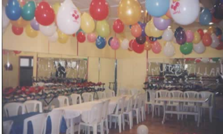
Resim 2.1. Alan önceden düzenlenerek hazır hale getirilmelidir

Alanın düzenlenmesinde aktivitelerde kullanılacak araç gereçler de hazırlanarak alana yerleştirilmelidir. Araç gereçlerin çocuk sayılarına göre yeterli olmasına, çocukların kullanımına uygun olmasına dikkat edilmelidir.