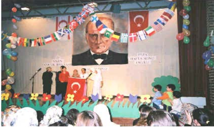
Resim 1.6: 23 Nisan kutlamalarından görüntüler

Bu tür etkinlikler ülkemizin tanıtımı açısından da oldukça yararlı olacaktır.