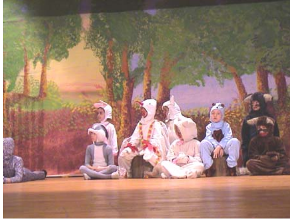
Resim 1.7. Doğa ile iç içe olmak çocuklara zevk verir

Çocukların en çok zevk aldıkları aktivitelerden biri doğada gerçekleştirilen aktivitelerdir. Doğada bir gün geçirmek çocukları eğlendireceği gibi gelişimlerine de yararlı olacaktır.