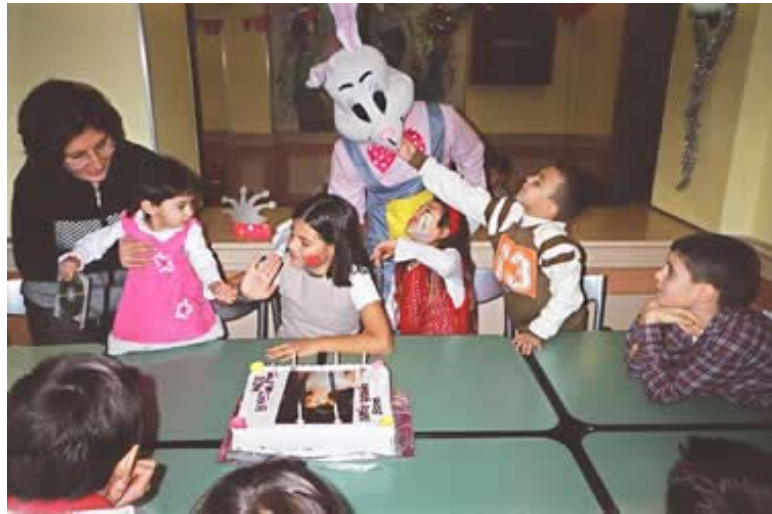
Resim 1.1. Özel temalı günlerde çocuklar toplumdaki rollerini öğrenir

Çocuk kulüplerinin aktiviteleri, genelde sezon boyunca tekrarlanan aktivitelerdir. Resim ve boya çalışmaları, el işi etkinlikleri, oyunlar, spor aktiviteleri şeklinde düzenlenen bu aktiviteler çocuklar açısından ilgi çekici olmakla birlikte, temalı programlar farklı, canlı olması, farklı mekânlarda uygulanması nedeniyle çocukların daha çok ilgisini çekebilmektedir.