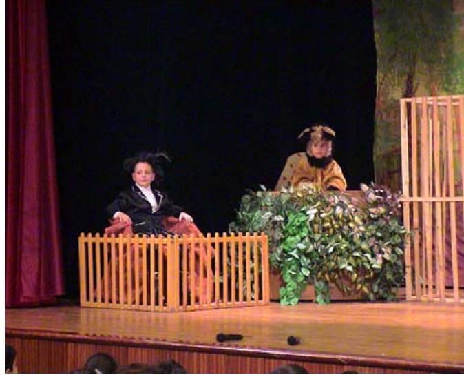
Resim 1.8. Doğa Temalı Aktivitelere Kostümler aktivitelere canlılık katar

Gün boyu doğa içerikli aktiviteler doğada gerçekleştirilir. Bu aktivitelerde doğa temalı kostümler, maskeler kullanılabilir. Çocuklarla beraber çiçek dikme ve bitkilerin bakımını yapma, kamp kurma, doğadan toplanacak artık materyallerle kolaj çalışmaları gibi aktivitelerde yer alabilir. Çiçekler çocuk kulübünde muhafaza edilerek çocukların otelde oldukları süre içerisinde her gün saksıdaki çiçekleri sulamaları sağlanabilir.