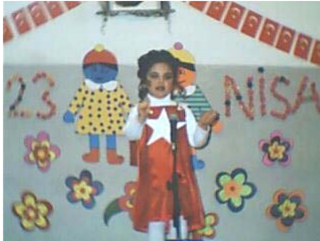
Resim 1.4. Aktivitelerde görev alan çocuklar özgüven kazanırlar

Ayrıca özel temalı günlerde yapılan aktiviteler çocuğun kendine güvenini artırma amacını güder. Aktivitelere katılma, bir işe başlama ve sonuçlandırma, yaptığı bir işte başarılı olma çocukta özgüveni artırır. Başka çocuklarla iletişim kurması ve birlikte çalışması çocuğu içe kapanıklıktan kurtarır ve cesaretlendirir.