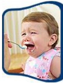
Resim 2.11: İştahsız çocuk

Ateşli hastalıklar, karaciğer enfeksiyonları, boğaz ağrısı, idrar yolu enfeksiyonları, fazla şekerli gıdalar yeme, gereğinden fazla süt içme, ek besinlerine zamanında başlamama, düzensiz yemek yedirme ve annenin fazla ısrarcı olması vb. durumlarda iştahsızlık gözlenir. Nedeninin belirlenmesi ile sorun çözülebilir.