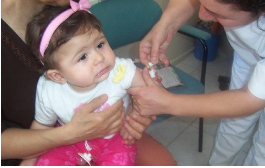
Resim 4.2: Bebekler belli aralıklarla aşılanmasının önemi

Önceden tetanos aşısı yapılmış gebe kadınlara gebeliğin 7. 8. ayında tetanos aşısı tekrarı yapılır. Hiç aşılanmamış gebelere gebeliğin 5.ayından itibaren başlayarak iki kez tetanos aşısı yapılmalıdır.