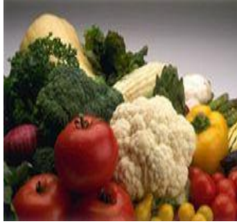
Resim2.4. Kabızlığa olumlu etkisi olan sebze- meyveler