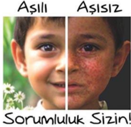
Resim 3.2: Kızamık hastası çocuklar

Döküntü safhası 3-4 gün sürer. Döküntüler çıktıkları sırayla kaybolur. Daha sonra deride kepekleme görülür, ateş düşer.