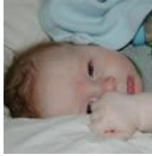
Resim 2.1 : 0-6 Yaş çocukların sık sık hasta olduğu dönem