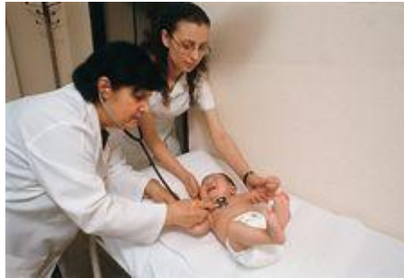
Resim1.1 : Hastalığın bebeklere olan etisi

Beden sağlığını bozan ve hastalığa neden olan etkenler kalıtım ve çevre olarak sınıflandırabiliriz.