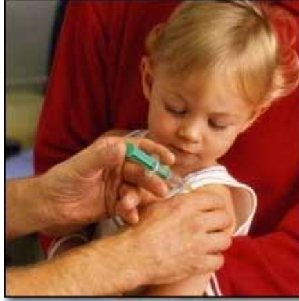
Resim 4.1: Çocuklarda aşı uygulaması

Organizmaya uygun yolla verildiğinde bağışıklık oluşturarak canlının enfeksiyon hastalıklarından korunmasını sağlayan maddelere aşı denir. Aşılar organizmada bağışıklık oluşturarak hastalığı geçirmiş gibi koruma sağlarlar. Aşılar antijenik yapıdadır.