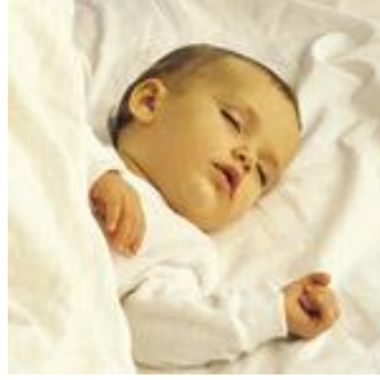
Resim 1.3: Çocuğun büyümesi etkili olan uyku

Vücutun sürekli yoğun tempoda çalışması, düzensiz ve az uyku, sinir sisteminin ve duyu organlarının fonksiyonlarını olumsuz etkiler. Dikkati ve iş verimini azaltır, vücut direncini düşürür. Sonuçta hastalıklara zemin hazırlar.