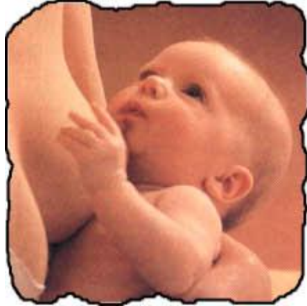
Resim 4.3 : Bebeğin ilk aşısı, anne sütü

Ülkelere göre aşı takviminde farklılıklar vardır. Aşı takvimini, ülkelerdeki çocukların öncelikli ihtiyaçları ile ülkelerin ekonomik düzeyleri belirlemektedir. Normal aşı takviminde belirlenen aşılardan dışında; salgınlar hâlinde görülüp insan sağlığını tehdit eder duruma geldiğinde de aşı yapılır. Ülkenin belirlediği sağlık politikaları doğrultusunda çeşitli aşı kampanyaları da uygulanır.