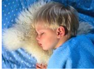
Resim 3.10: Gripde yatak istirahatinin önemi

Korunma gripli hastalarla yakın temastan kaçınılarak yapılmalıdır. Grip aşısı vardır ancak doktora danışılarak uygulanmalıdır. Özellikle astımlı ve immün sistemi zayıf çocuklara doktor önerisiyle belirtilen dönemde bu aşığı yaptırılmalıdır.