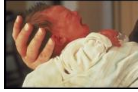
Resim 2.2 Karın ağrısı ve gaz sancısı olan bebekler

Bebek emzirilirken sütle birlikte bir miktar da hava yutar. Anne her emzirmeden sonra bebeğini, baş ve omuz hizasında dik tutarak sırtını sıvazlamalı, bebeğin gazını çıkarmalıdır. Bu işlemde önce omzuna temiz bir tülbent koymayı da ihmal etmemelidir. Çünkü bebek, gaz çıkarma esnasında yediklerinin bir kısmını da kusabilir. Gaz çıkarma işlemi, bebeğin annenin dizleri üzerine yüzükoyun yatırılmasıyla da yapılabilir. Bebeğin gazının çıktığı “gark” sesinin gelmesiyle anlaşılır. Gazı çıkartılmadan yatırılan bebekler sancılanır ve sürekli ağlar. Karnı şişkindir. Ağlama sırasında yüzleri kızarır, bacaklarını karnına doğru çeker ve yüksek sesle bağıırır.