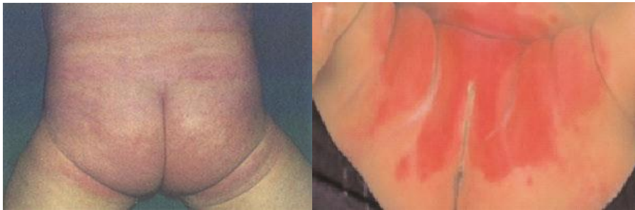
Resim 2.9-2.10: Bebeklerde pişik

Pişik, genellikle idrar ve dışkınnın bebeğin tenine temas ettiği hassas deri bölgesinde görülür. Hafif kabartılı bir kızarıklık biçiminde ortaya çıkar. İlerlemiş pişiklerde deri yer yer soyulup iltihaplanabilir. Pişiğe bebeğin dışkınsındaki bakteriler ve idrarın bileşimindeki amonyak sebep olur. Bebek bezlerini yıkamada kullanılan deterjanlardaki maddeler, bez değiştirme sıklığının azlığı da pişik yapabilir. Anne sütüyle beslenen çocuklarda pişik, mamayla beslenenlere göre daha az görülür.