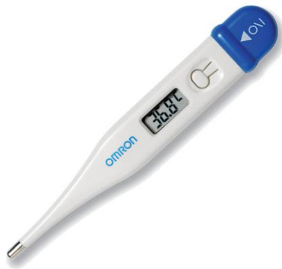
Resim2.7. Dijital termometre

Çocuklarda aksiller vücut ısısının 37,5° C üzerinde olması ateş olarak kabul edilir.