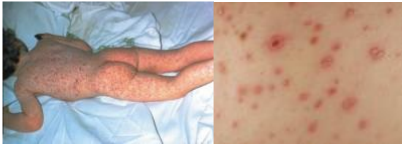
Resim 3.7: Suçiçeği döküntüleri

Korunma: Hasta kişilerle temas edilmemelidir. Suçiçeği aşısı çok etkin bir aşıdır. 12 ay-12 yaş arası çocukların %95'inden fazlası tek doz suçiçeği aşısı sonrası bağışıklık cevabı oluştururlar. Suçiçeğinin 12 ay- 12 yaşları arasında yapılabilen aşısı vardır. Bu yaşlarda yapılan aşı büyük oranda bağışıklık oluşturur. Ancak ülkemizde rutin aşı takviminde yer almaz, isteğe bağlı olarak uygulanır.