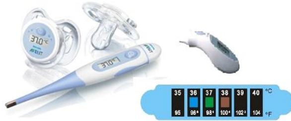
Resim 2.6: Termometre çeşitleri

Vücut ısısının ölçümü için dijital termometre, elektronik termometre, tek kullanımlık termometre (ısıya duyarlı bant) kullanılmaktadır.