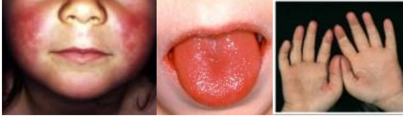
Resim3.6: Kızıl hastalığı döküntüleri