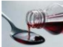
Resim 3.9: Doktorun önerdiği ilaçlar kullanılmalı