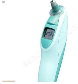
Resim 2.8. Kulak termometresi

Kulaktan infrared (kızılötesi) ışınları yoluyla elektronik ölçüm yapılmaktadır. Altı aylıktan küçük bebeklerde kullanımı zordur. Kulaktan ölçülen 38° C'nin üstündeki değerler ateş olarak kabul edilir.