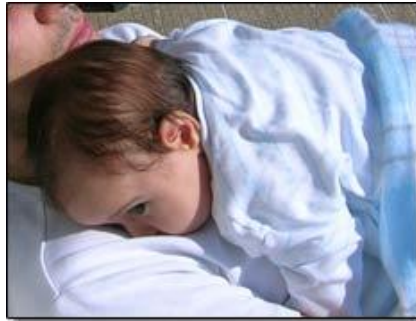
Resim 2.3: Bebeklerde gaz çıkarma

Gaz sancısı bebeğin büyüme ve gelişmesini engellemez, zamanla azalarak 3 aylıktan sonra kaybolur.