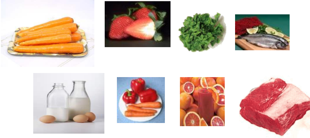
Resim1.2: Sağlıklı olmanın ilk şartı, besin çeşitliliđi

Uyku, beslenme kadar önemlidir. Çocuđun sağlıklı gelişebilmesi için yeterince uyuması gereklidir. Bazı hormonların salgısı, uyurken artar, bazıları da uyurken azalır. Örneđin; büyüme hormonunun salgılanması uykuda artar; bu nedenle uyku, büyümede önemli rol oynar. Çocuklarda uyku gereksinimi farklıdır. Yeni doğanlar, beslenme ve alt temizliđi zamanları dışında günün hepsini uyuyarak geçirirler. 9. aydan 3 yaşına kadar ortalama 11-12 saat gece,2-3 saat de gündüz uyurlar. Yetişkinlerin ise günde 8 saat uyuması gerekir. Çocuk büyüdükçe uyku süresi azalır. Böylece çocuđun doğal direnci artar, hastalıklara karşı güçlü olur. Yeterince uyumayan çocuklar, huysuz, hırçın, neşesiz ve iştahsızdır. Hastalıklara daha kolay yakalanır. Uyku, dinlenme için en iyi yoldur. Dinlenme ile vücut zindelik kazanır. İnsanın sevdiđi, hoşlandıđı işlerle uğraşması ve bu hobilere zaman ayırması dinlenmesini sağlayabilir Örneđin zihinsel yorgunluk; hafif bedensel hareketleri gerektiren bahçede çiçeklerle uğraşma, sportif koşu ya da yürüyüşlerle atılabilir.