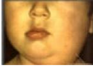
Resim 3.3: Kabakulaklı çocuğun görünümü