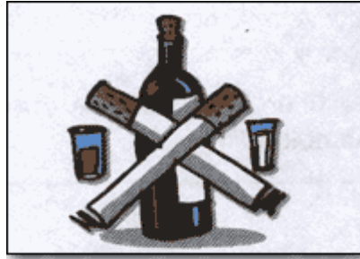
Şekil 1.4: Sağlığı bozan sigara ve alkol

Yetişkinlerin sigarayı bebeklerin ve çocukların yanlarında içmeleri onların sağlığını olumsuz etkiler. Pasif içici durumunda olanlar, en az içenler kadar zarar görürler.