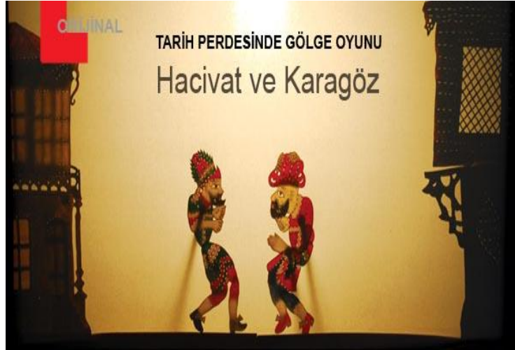
Resim 1.3. : Gölge oyunu

Gölge oyununun çıkış noktası Uzakdoğu Çin olarak bilinir. Ticaret ve geziler sonucu Endonezya, Java ve Hindistan’da yaygınlaşan gölge oyunu, mistik ve dinsel bir etkiye sahiptir. Türkler Çin ile yakın ilişkileri dolayısıyla bu sanatı öğrenmişler ve kendi kültürleri doğrultusunda geliştirmişlerdir.