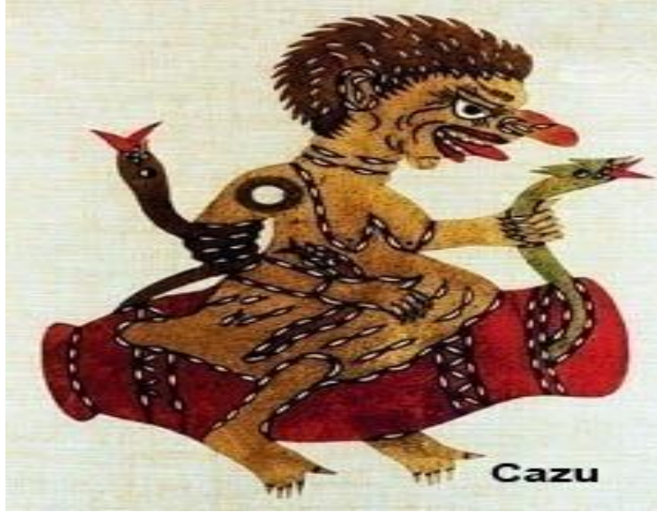
Resim 1.12. : Cazu