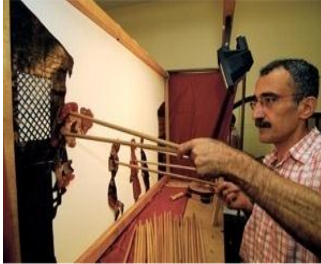
Resim 2.1. : Karagöz perde sahnesi

Toplumların yaşamlarında din her zaman en belirleyici unsur olmuştur. Bu yüzden gölge oyunu da daha çok dini anlatımlar için kullanılmıştır. Karagöz'den örnek verelim. Karagöz sahnesindeki beyaz perde dünyadır. Tasvirler (kuklalar) insanlardır. Arkadan vuran ışık ise ruhtur. Işık kapanınca ruh gider, perdedeki kuklalar yani dünyadaki insanlar görünmez âleme geçerler.