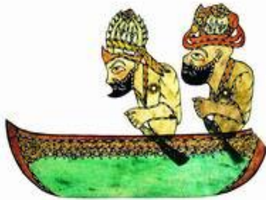
Resim 1.4. : Hacivat ve karagöz

Karagöz oyununda trajik komik sahnelerin büyük bir çoğunluğu çeşitli karakterlerin varlığı ile gerçekleşir. Bu karakterler mahallenin insanlarıdır. Oyunda sıra ile perdeye gelirler. Karakterlerin bir bölümü Anadolu'nun çeşitli yerlerinden İstanbul'a para kazanmak için gelen ve belli bir işi olan kişilerdir. Genellikle yöresel giysiler içinde kendi lehçeleri ile konuştukları için onların bu farklılıkları "komik unsur" yaratır.