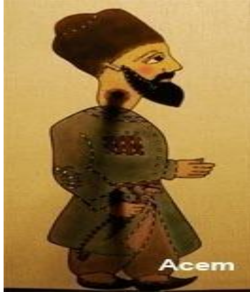
Resim 1.9. : Acem