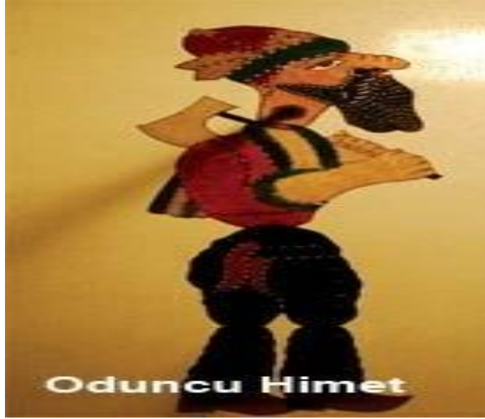
Resim 1.7. : Oduncu himet