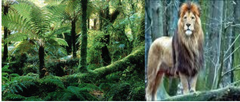
Resim 1.1. : Doğa ve vahşi hayvanlar