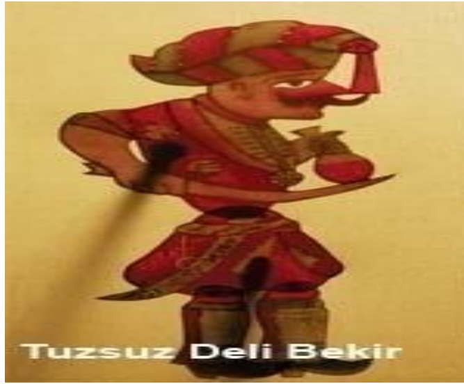
Resim 1.11. : Tuzsuz Deli Bekir