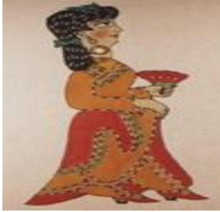
Resim 1.5. : Karagözün karısı