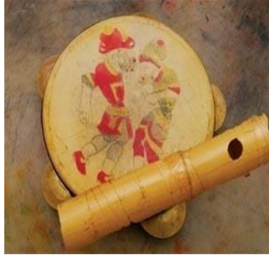
Resim 1.13. : Karagözün Defi

Karagöz defî: Tek tarafına deri gerilmiş tahta kasnak ve 5 çift zilden oluşur. Karagöz düdüğü olarak da anılan“ nareke “ ise bir ucuna ince kâğıt gerilmiş kamaştan yapılır.