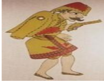
Resim 1.8. : Karagöz tiplerinden 'efe'