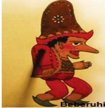
Resim 1.6. : Beberuhi