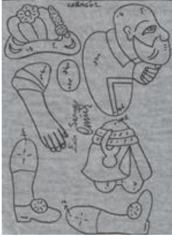
Resim 1.15. : Karagöz kalıbı