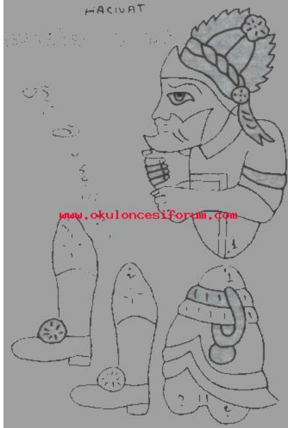
Resim 1.14. : Hacivat kalıbı

Marangoza ince sunta kestirilir. Daha önce hazırlanmış Hacivat Karagöz kalıpları ince sunta üzerine çizilir. Çizilen yerlerden kıl testere ile kesilir. Eklem yerleri oyulur. Guaj boya ile boyanıp verniklendikten sonra kurumaya bırakılır. Daha sonra eklem yerleri çivi raptiye ile tutturulur. 60 cm uzunluklarındaki sopalar kuklaların arkasına monte edilir. Kuklalar anadili etkinliklerinde oynatılır.