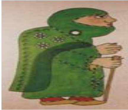
Resim 1.10. : Hımhım