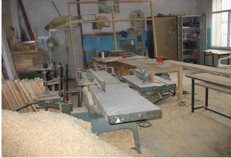
Resim 1.4: Marangoz atölyesi

İlkokul II. Devre (9 -13): II. devre eğitim programlarında çocuğun fiziksel, sosyal ve kişisel çevresini tanıması ve uyum sağlaması yanında, okuma, yazma ve aritmetik işlevsel akademik beceriler kazanmasına ağırlık verilmektedir. İşlevsel akademik becerilerle amaçlanan günlük yaşama uyumu kolaylaştırıcı örneğin, gazetenin, sokak tabelalarının, telefon kullanma yönergesinin okunması, bir formun doldurulması, alışverişte para hesabının yapılması gibi becerilerdir. Programlarda akademik çalışmalarıyla birlikte hazırlık çalışmalarına da yer verilmektedir.