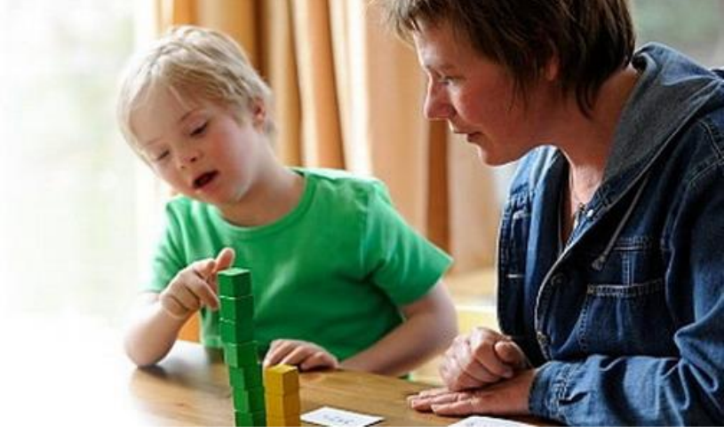
Resim 2.1: Zihinsel yetersizliği olan bireyler için bireyselleştirilmiş eğitim programı

BEP hazırlığında, bireyin gerçekleştiremediği amaçlar, verilecek eğitim için yol gösterici olacaktır. Bu amaçla “Kaba Değerlendirme Formu” kullanılarak bireyin, eğitim programının hangi düzeyinde performans gösterdiği tespit edilebilir. BEP içerisinde yer alacak uzun dönemli hedefler ve buna bağlı kısa dönemli hedefler, bireyin yetersiz olduğu kazanımların öncelik sırasına göre belirlenir. Verilecek eğitim etkinliği sonunda ilerlemeyi ölçmek için yapılacak değerlendirme süreci, yine programa dayalı olarak gerçekleştirilecek olup, bireyin BEP’inde yer alan amaçlarla sınırlı olacaktır.