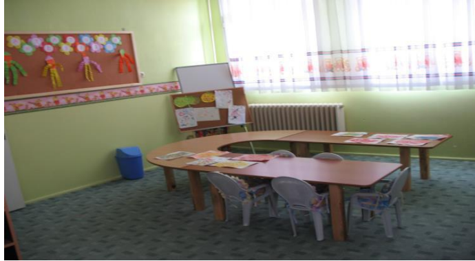
Resim 1.5. Erken çocukluk eğitim sınıfları

Bu çocukların eğitimleri genellikle özel sınıf, okul ve korumalı iş yerlerinde sađlanmaktadır. Bunun yanı sıra çocuđa kendi evinde ve grup evlerinde sađlanan eğitim programları bulunmaktadır. Zihinsel yetersizliđi olan çocuklara uyarıcı ve erken çocukluk eğitimi sınıfları ile ilk ve ortaokul sınıfları düzeylerinde özel eğitim olanakları sađlanmaktadır.