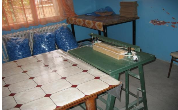
Resim 1.7: Galoş üretim atölyesi

İlkokulun ileri sınıflarında uygulanmasına başlanılan bu programlarda çocuk bir taraftan iş eğitiminden geçirilirken diğer yandan yarım zamanlı olarak gerçek bir iş yerine yerleştirilmektedir. Bu uygulamada okulda gerçekleştirilen eğitim çalışmalarının sonuçları gerçek iş ortamlarında gözlenmekte, buna göre iş eğitimi programlarına yön verilmektedir.