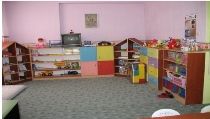
Resim 1.6: Eğitim sınıfları