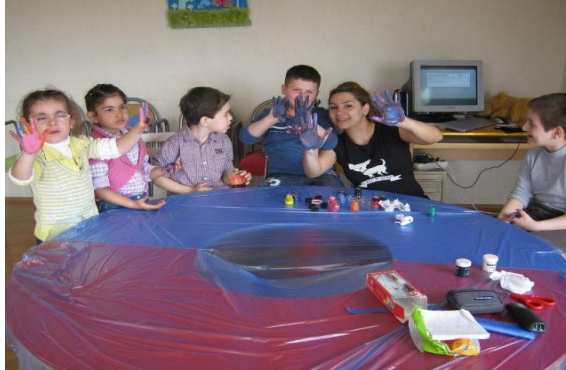
Resim 2.2: Zihinsel yetersizliği olan bireylerle grup eğitimi

Grup eğitimi programı hazırlanırken, eğitim programında öğrencilerin yaşlarına, gelişimsel ihtiyaçlarına ve eğitimsel düzeylerine göre dikkat edilmelidir. Grup eğitiminde, gruba yönelik hedefler ve bireye yönelik hedefler ayrı ayrı belirtilmelidir.