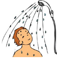
Şekil 1.1: Vücut temizliği

Ellerde kesik, yara ve benzeri durumlar varsa bunların üzeri ancak su geçirmez bir bantla kapatıldıktan sonra laboratuvarlarda çalışılmalı, aksi takdirde çalışılmamalıdır.