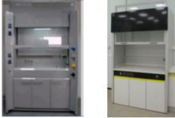
Resim 2.4: Çeker ocaklar

Çeker ocaklar çalışma alanında oluşan asit buharı, ısı, proses aroması gibi gazları uzaklaştırmak amacıyla kullanılır. Cihazlar, yüksek emiş gücüne sahiptir ve sisteme bağlı bulunan baca bağlantısı ile gazları dış ortama atan bir yapıya sahiptir. Çeker ocaklar, galvaniz gövde yapısı ve özel kaplama boya sayesinde, paslanma tehlikesine karşı koyması, dayanıklılık, kullanım rahatlığı, iş ve çevre güvenliğini de sağlaması açısından laboratuvarlarda kullanılan standart donanımlardandır. Çeker ocakların içinde gaz muslukları, lavabo ve lavabo bataryaları bulunur.