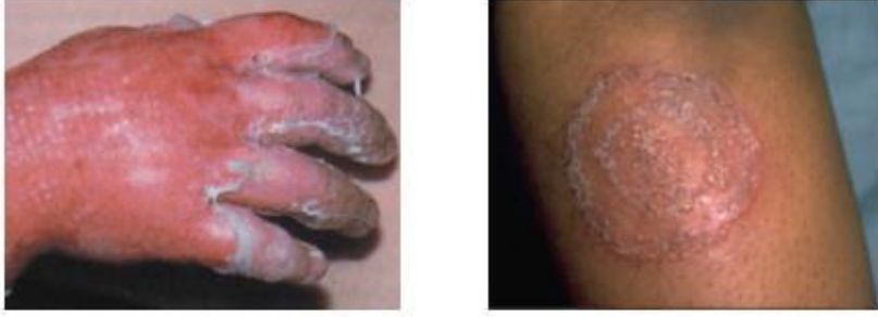
Resim 4.4: Laboratuvar yanıkları

Laboratuvarda kaynar su, alev, sıcak yüzeyle temas ve çeşitli kimyasallardan kaynaklanan yanıklar oluşmaktadır. Eğer sıcak cisimler ile temas var ise kişi hâlâ yanıyorsa öncelikle kazazede yanmaktan kurtarılır, temas kesilir. Yanık bölge soğuk su altında tutulur (Yanık yüzeyi büyükse ısı kaybı çok olacağından önerilmez.). Ödem oluşabileceği düşünülerek yüzük, bilezik, saat vb. eşyalar çıkarılır. Yanmış alandaki deriler kaldırılmadan giysiler çıkarılır, gerekirse kesilir. Su toplamış yerler patlatılmaz. Yanık üzerine hiçbir madde (ilaç dâhil) sürülmemelidir. Yanık üzeri temiz bir bez ile örtülür. Yanık büyük ise tıbbi yardım istenir.