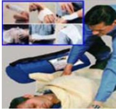
Resim 4.1: İlk yardım

Aniden hastalanan veya kazaya uğrayan kişilere, sağlık görevlilerinin yardımı sağlanıncaya kadar hasta veya kazazedenin durumunun daha kötüye gitmesini önlemek için mevcut imkânlar ile yapılan yardıma ilk yardım denir.