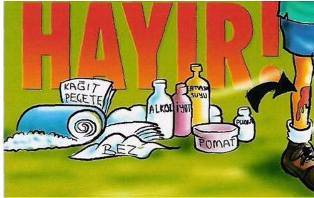
Şekil 4.1: Yaralarda asla kullanılmaması gereken malzemeler