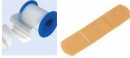
Resim 4.3: Flaster ve yara bandı