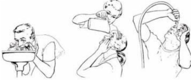
Şekil 4.2: Gözlerin yıkanması

fiş çıkarılır. Bunlar yapılamıyorsa iletken olmayan bir araç yardımı ile kazazede elektrikten kurtarılır. Solunumu durmuşsa suni solunum yapıp hastaneye sevk edilir.