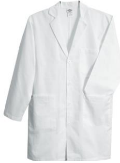
Resim 1.1: Laboratuvar önlüğü

Laboratuvarlarda oluşması en muhtemel tehlikelerden biri, kimyasal maddelerin çalışanlar üzerine sıçraması, yakıcı ve delici etkileri ile zarar vermesidir. Buna benzer tehlikelerden korunmanın en basit ve etkili yolu laboratuvar önlüğü ve koruyucu malzemeler kullanmaktır.