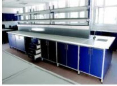
Resim 2.2: Çalışma tezgâhları

Laboratuvar, idari ve analiz yapılan bölümler ayrı olacak şekilde planlanmalıdır. Her hizmet bölümü için en az on beş metre karelik alan olmalıdır. Enstrümantal cihazlarla yapılan analizlerde numunenin hazırlandığı alan ile cihazın bulunduğu alan ayrı planlanmalıdır.