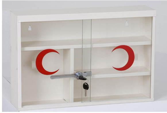
Resim 4.2: Ecza dolabı

Laboratuvarda çalışan hiç kimse, isteyerek kazaya neden olmayacağına göre kazaya uğrayan kişi, ilk şaşkınlık hâlinde elinde olmadan yanlış ve sağlığı tehlikeye sokacak hareketler yapabilir. Hatta bazen kendisine yardım edemeyecek durumda bulunabilir. Bu nedenle laboratuvarda çalışan herkesin ilk yardım konusunda bir anda tereddüt etmeyecek derecede bilgili olması ve mümkün olduğunca süratli karar verebilmesi gerekir.