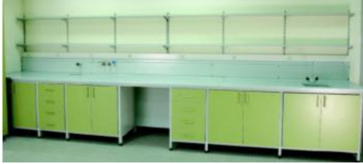
Resim 2.3: Malzeme dolapları

Bunların haricinde, ilk yardım için gerekli ilaç ve malzemelerin bulunduğu ilk yardım dolabı ve gerekli talimatların yer aldığı panolar bulunmalıdır.