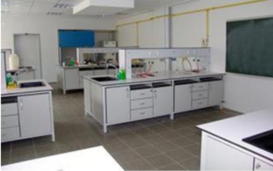
Resim 2.1: Laboratuvar

Bir bilim dalı veya çalışma alanı bünyesinde, çeşitli alet ve cihazlar kullanılarak deneysel çalışmalar, testler, analiz ve gözlemlerin yapıldığı mekânlara laboratuvar denmektedir.