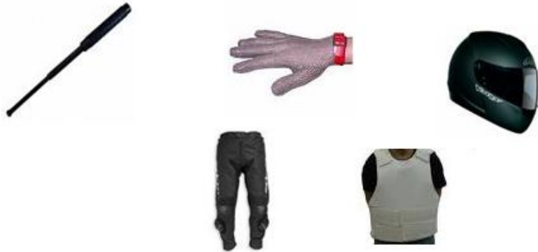
Fotoğraf 1.1: İnfaz koruma memurlarının olağanüstü hâllerde kullandıkları malzemeler

Ceza infaz kurumlarının bürolarında işin sürdürülmesi için gereken araçların yanında, güvenlik ve gözetim servisinde olağanüstü hâllerde kullanılmak üzere cop, çelik eldiven, kask, göğüs ve bacak kısımlarını korumak için tasarlanmış alt ve üst giysiler ile anahtarlar kullanılmaktadır.