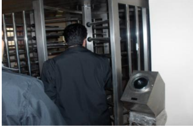
Fotoğraf 1.2: Görüş alanlarına ve bloklara geçişler için göz okuma cihazı ve turnikeler

Ceza infaz kurumlarına girecek her türlü araç gereç ve malzemelerin kontrolü, öncelikle araç gereci getiren vasıtanın altının güvenlik aynası araması ile başlar. Giriş izni olup olmadığına bakılır. Giriş izni olan araç dış kapıdan içeri alınır.