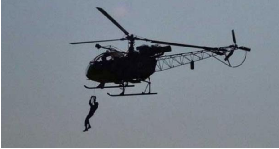
Fotoğraf 2.5: Yunanistan’da bir mahkumun cezaevinden helikopterle firar girişimi