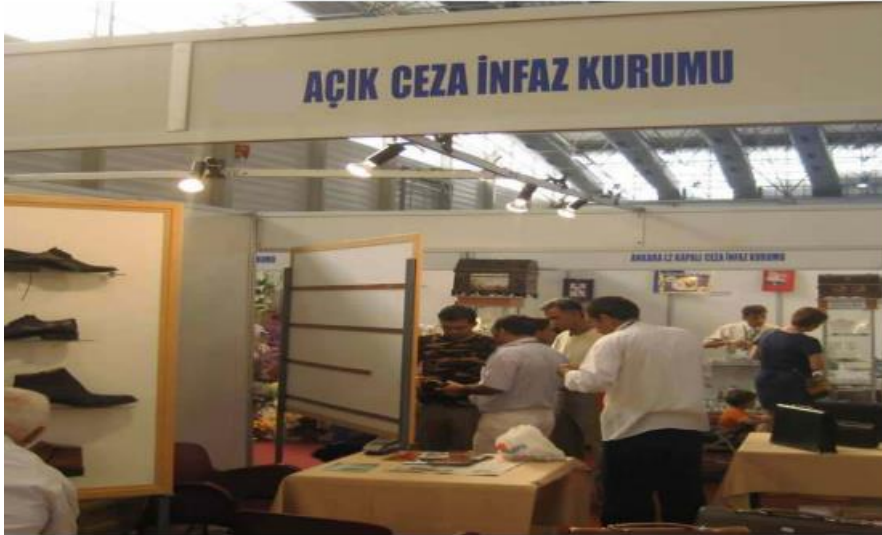
Fotoğraf 2.1: Sergi ve fuar organizasyonunda sergilenmek için cezaevinden çıkarılmış ürünler

Yukarıda sayılan sebeplerden dolayı cezaevinden çıkan malzemeler aynen cezaevine giren malzemeler gibi aramaya tabi tutulur.