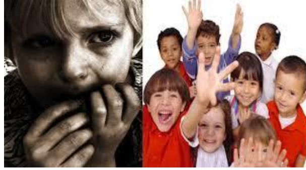
Resim 1.3: Yaşama hakkı

Birleşmiş Milletler Çocuk Hakları Bildirgesi'nin çok sayıda maddesi çocukların sağlıklı bir yaşam sürdürmelerini desteklemektedir. Sözleşme'nin 6. maddesine göre her çocuk esas olarak yaşama hakkına sahiptir. 24. madde gereğince her çocuk ulaşılabilir en yüksek sağlık standartlarından yararlanabilmelidir, gerekli tedavi ve iyileştirme hizmetlerinden faydalanabilmelidir. İhmal edilen, terk edilen, istismara uğrayan ya da işkenceye tâbi tutulan çocukların iyileştirilmesi ve yeniden topluma kazandırmasından devletler sorumludur.