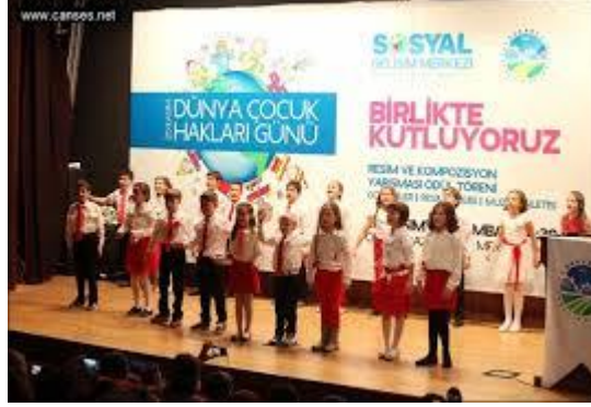
Resim 1.1: Çocuk Hakları Günü

Bunun dışında çeşitli ülkelerde farklı günlerde çocuk günü kutlanmaktadır. Türkiye'de 23 Nisan Ulusal Egemenlik ve Çocuk Bayramı ilk olarak Nisan 1929'da kutlanmaya başlandı ve bu tarihte örgütlenen 4 bin çocuk ilk kez TBMM'den haklarını talep etti. İlk olarak 1924'te çocukların korunmasına yönelik çalışma yürürlüğe girmiştir.