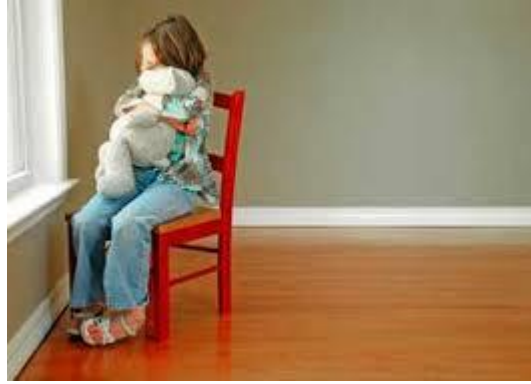
Resim 3.4: Duygusal istismar

En genel anlamı ile “çocuğun iç görüsünü ya da duygusal bütünlüğünü bozan her türlü eylem ya da eylemsizlik” duygusal istismar kapsamında değerlendirilmektedir. Reddetme, yalnız bırakma, aşırı koruma, bağımlı kılma, aşırı hoşgörü, baskı, aşırı otorite, sevgiden ve uyarandan yoksun bırakma, sürekli eleştiri, aşağılama, tehdit, korkutma, yıldırma, suça yöneltme, suçlama, yok sayma, çocuğun yaşına ve özelliklerine uygun olmayan beklentiler içinde olma, çocukla sürekli alay etme, çocuğun davranışlarıyla uyumsuz ağır cezalandırma ve iz bırakmasa da yüze şiddet uygulama, çocuğu aile içi uyuşmazlıklarda taraf tutmaya zorlama, aile içi şiddete tanık etme, beslenme, giyim, tıbbi gereksinimler, duygusal ihtiyaçlar veya optimal yaşam koşulları için gerekli ilgiyi göstermeme gibi eylemler de “duygusal istismar” olarak tanımlanmaktadır. Duygusal istismar; sözel istismar, fiziksel olmayan ancak çok ağır olan cezalar ya da tehditleri de içerir.