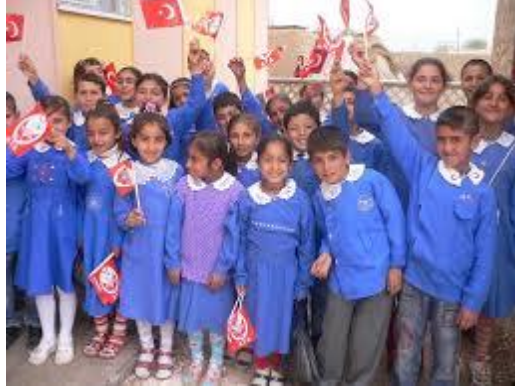
Resim 1.4: Eğitim hakkı

Kız çocukların da gereksinimlerini karşılayacak ve kendilerine yaşam becerisi kazandıracak nitelikli eğitim görmeye hakkı vardır. Oysa tüm dünyada okula gitmeyen 6-11 yaşlarındaki 130 milyon çocuğun 73 milyonunu kız çocukları oluşturmaktadır. Kız çocukların eğitiminin önemi 1990'lar boyunca her fırsatta vurgulanmıştır.