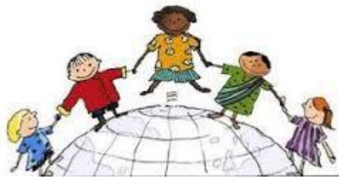
Resim 1.2: Çocukların evrenselliği

NOT: Çocuk Hakları Sözleşmesi 54 maddeden oluşmaktadır. Sözleşmenin bundan sonra 54'e kadar devam eden maddeleri, sözleşmenin devletler tarafından nasıl imzalanacağı, onaylanacağı ve yürütüleceği ile ilgilidir.