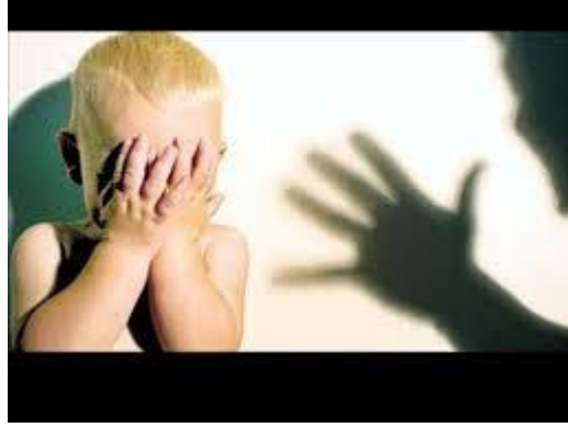
Resim 3.2: Fiziksel istismar