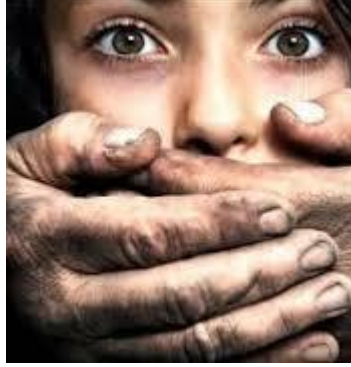
Resim 3.3: Cinsel istismar