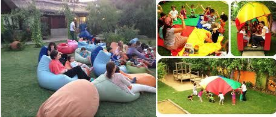
Resimler 2. 1: Çocuk dostu ortamlar

Yukarıda ifade edilen tüm bilgiler çocuk haklarına uygun çocuk dostu ortamların temel özellikleri ve yararlarını içermektedir.