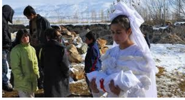
Resim 13: Çocuk istismarı