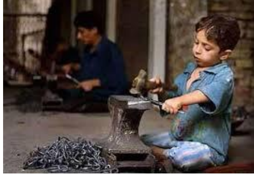
Resim 1.6: Çocuk işçiliği

Uluslararası Çalışma Örgütü'nün verilerine göre dünya genelinde 200 milyondan fazla çocuk işçi bulunuyor. Bu ülkelerin başında Hindistan bulunuyor. Çocuk işçiler için en tehlikeli sektörler arasında tarım, inşaat ve madencilik yer alıyor. Uluslararası Çalışma Örgütü, yaşları 5 ila 14 olan 132 milyon çocuğun tarım sektöründe çalışmaya zorlandığına ve bu nedenle eğitim ve sağlık olanaklarından yoksun kaldığına dikkat çekiyor. Ayrıca çocukların mafya ve çetelerin elinde zorla gasp ve yankesicilik suçlarına yönlendirilmesi, duygusal istismarı göz önünde bulundurarak dilencilige teşvik ettirilmeleri verilecek örneklerden bazılarıdır.