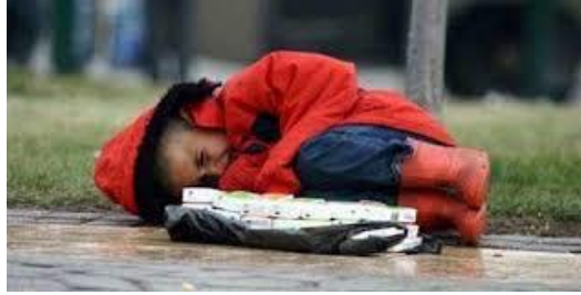
Resim 1.5: Barınma hakkı

Etik ve yasal zorunluluklar dikkate alındığında çocuk koruma toplumun her kademesinde her görevde bulunan herkesin işidir. Devlet; hâkimler, polis, öğretmenler, doktorlar, sosyal çalışmacılar, sağlık çalışanları, ebeveynler ve medya için görevler yaratmaktadır. Bu görevler, ülkenin kabul ettiği yasal standartlara yansıtılabilir. Ayrıca bir devletin seçimlerine, kaynak tahsisatına da yansıtılabilir. Giderek artan bir şekilde düzenleyici kurallara ve medya kuruluşlarının rehber ilkelerine yansıtılmaktadır.