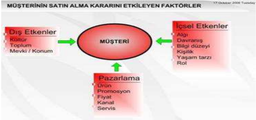
Şekil 1.1: Satın alma kararı etkileyen faktörler