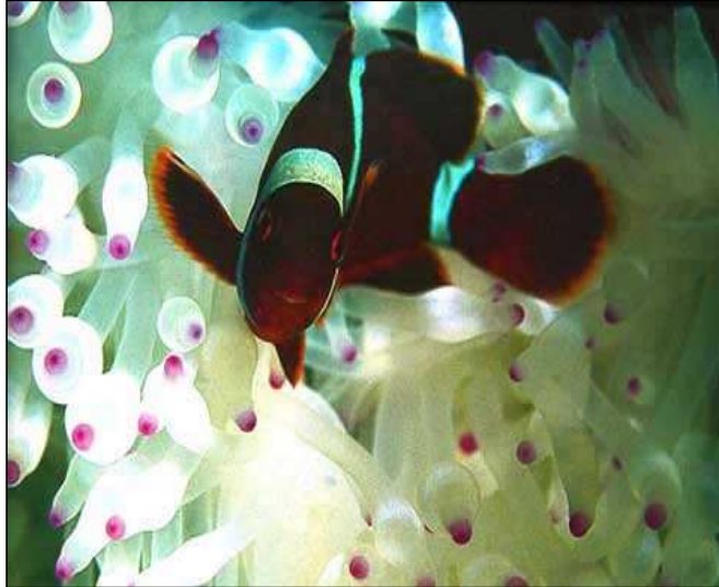
Fotoğraf 1.4: Su altı fotoğraf örnekleri